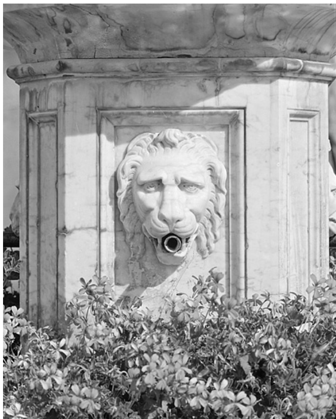
Tête de lion sur la colonne en marbre.