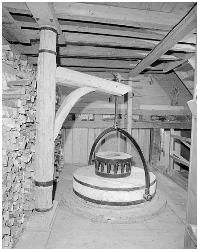
Meule gisante en place, potence pour habiller la meule.