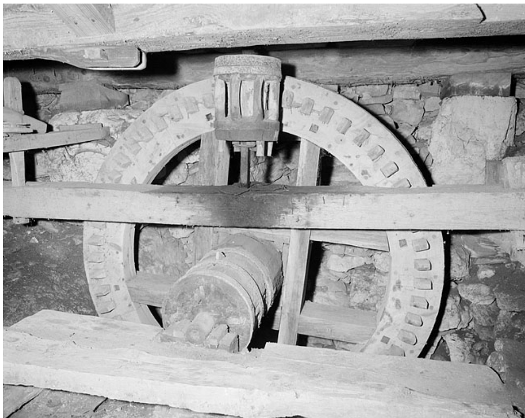
Rouet et lanterne en liaison avec la meule.