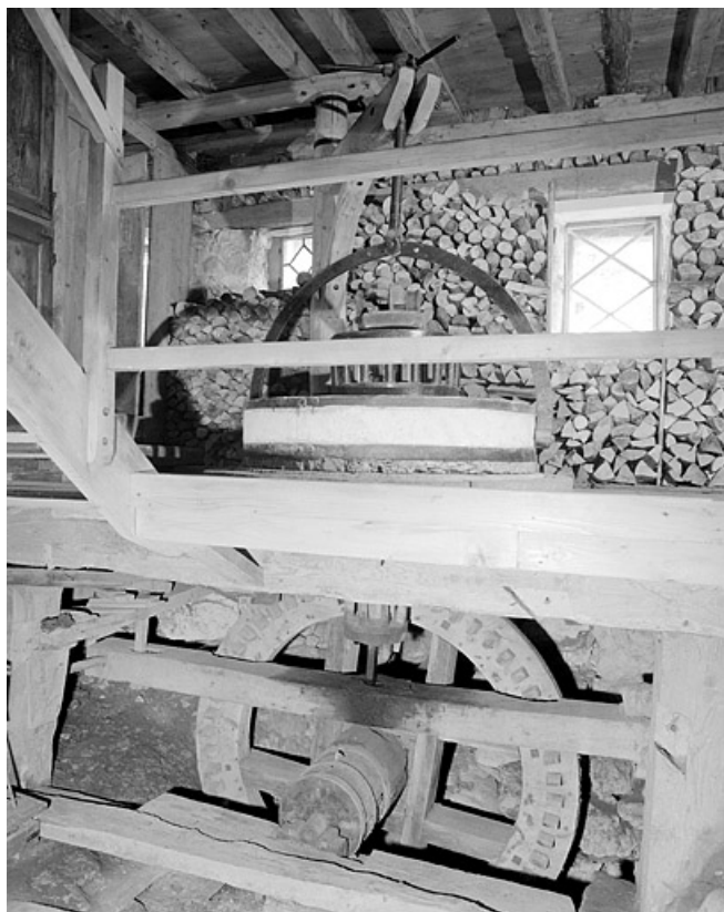
Ensemble meule et rouet.