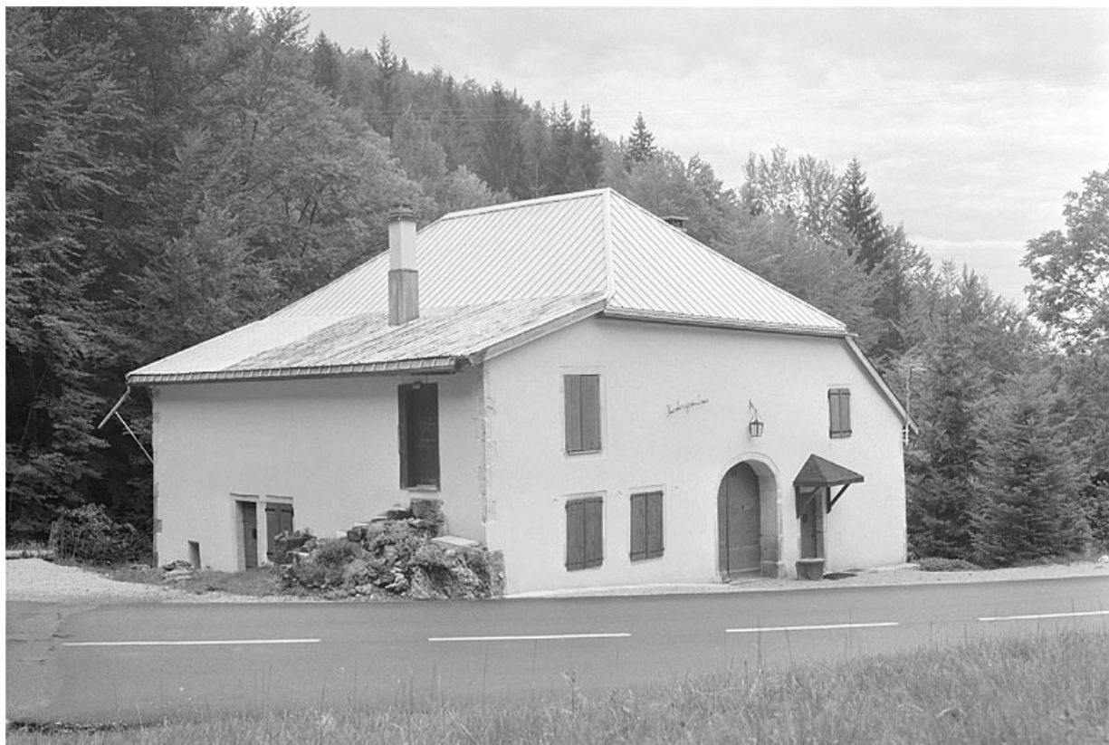
Face nord-est et façade postérieure.