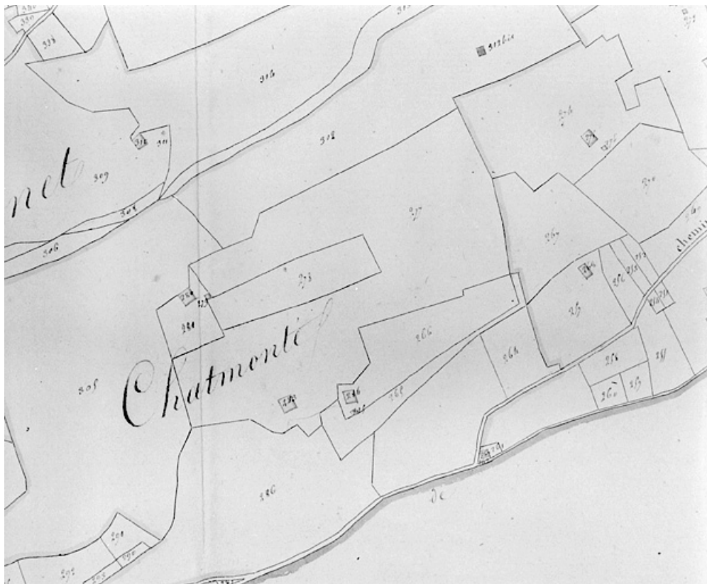
Plan-masse et de situation. Dessin, 1812. Extrait du plan cadastral, commune de Septmoncel, section F, feuille 1, échelle 1:5000. 39, Septmoncel, lieudit : Chamonté