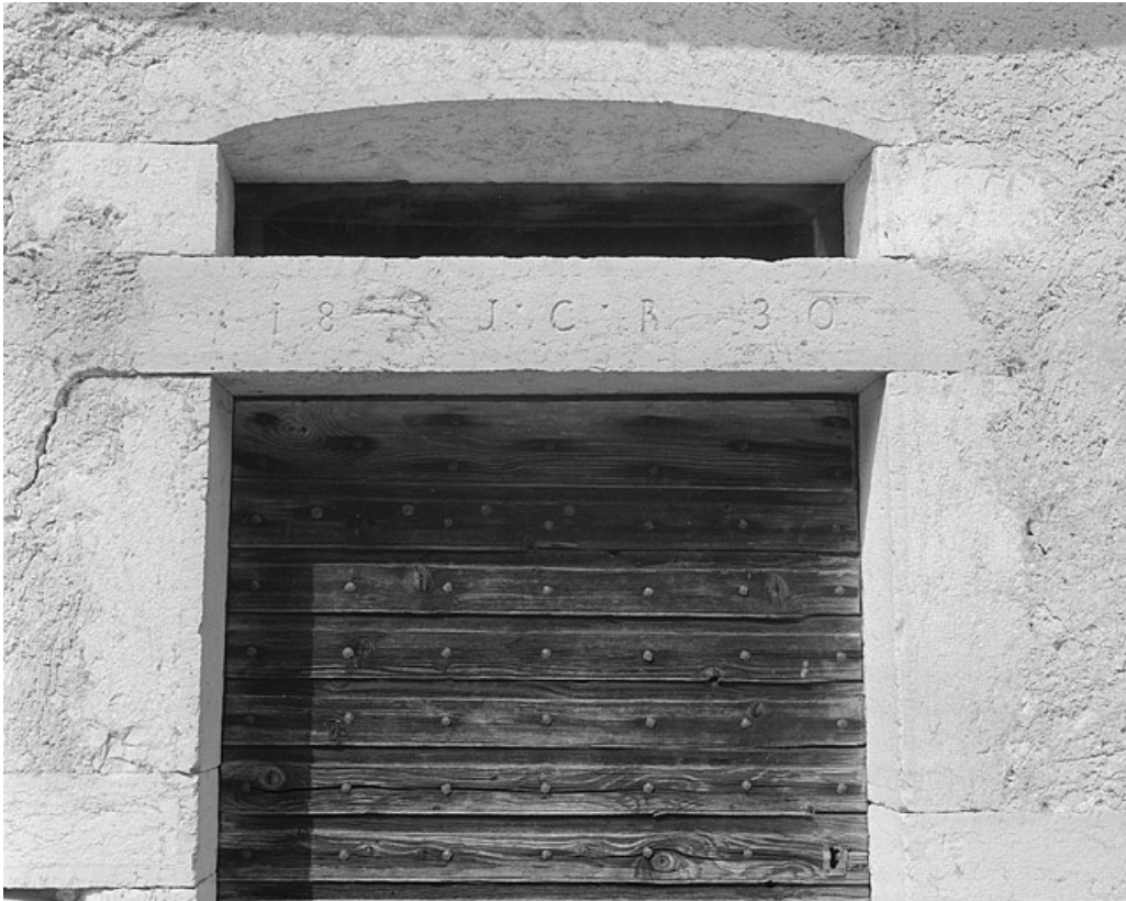
Détail de la date portée par le linteau de la porte du logis.