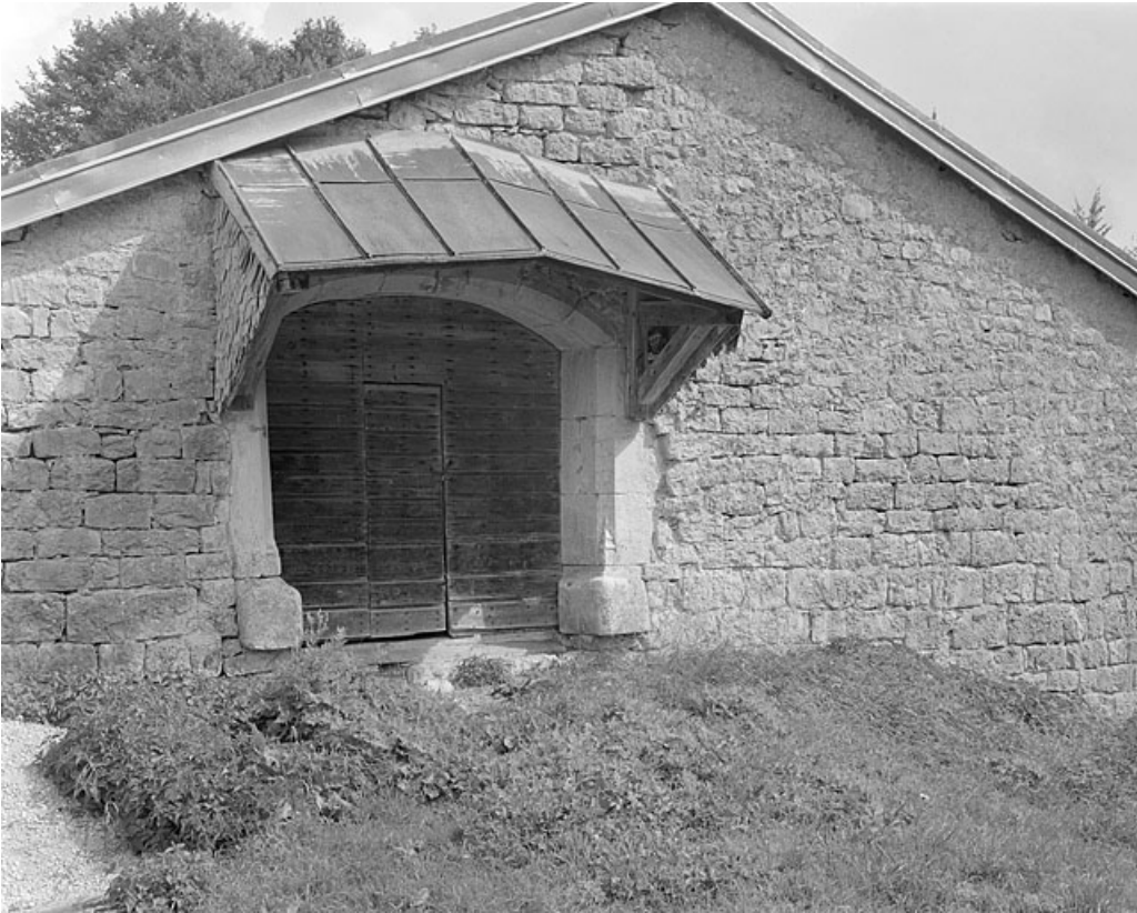
Accès à la grange haute sur la face sud-ouest.