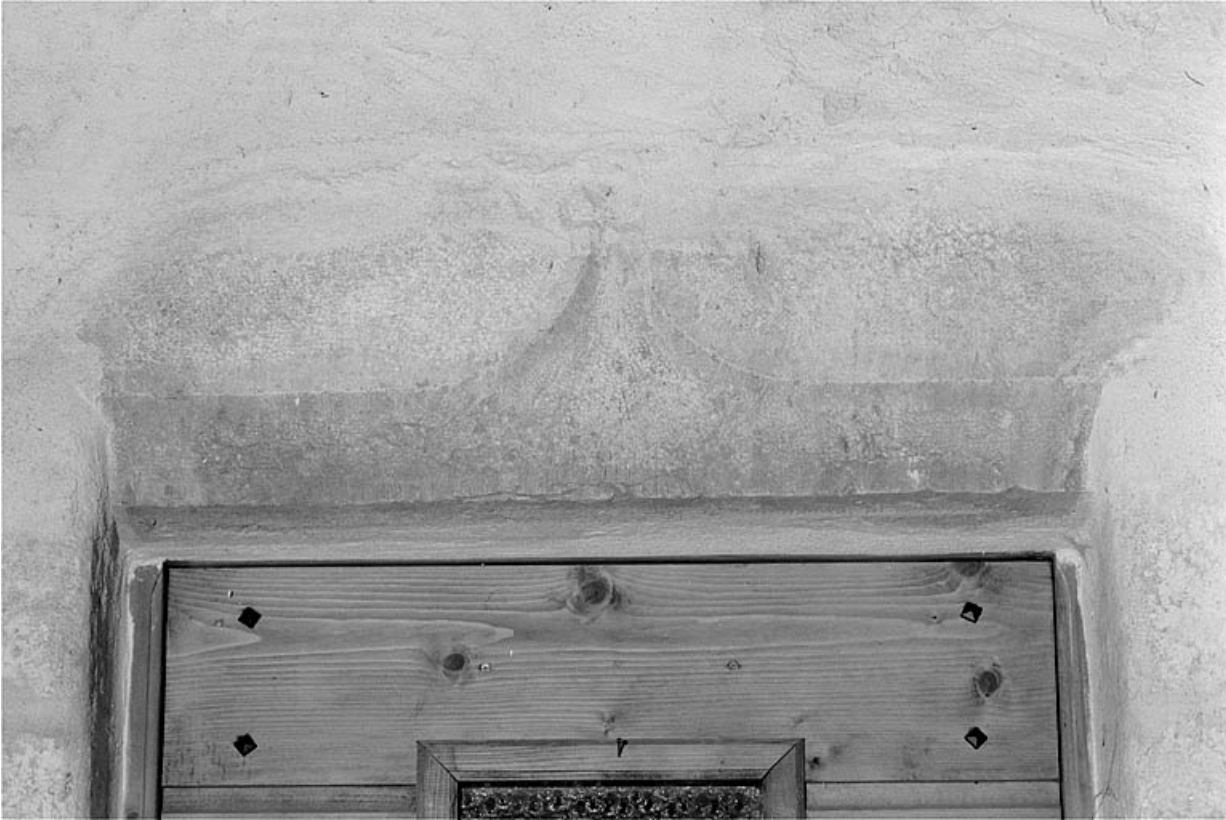
Linteau de la porte d'entrée en accolade.

39, Les Molunes, lieudit : les Chevalières