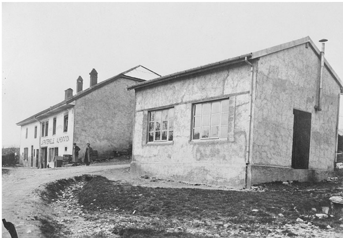
La succursale et la salle de bal.

39, Lavans-lès-Saint-Claude, 9 rue de la Cueilie