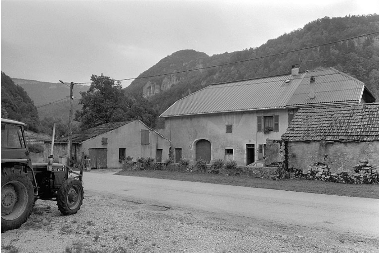
L'ensemble de la ferme et de ses annexes.

39, Lavans-lès-Saint-Claude, 50, 52 quartier de Lizon, lieudit : Lizon