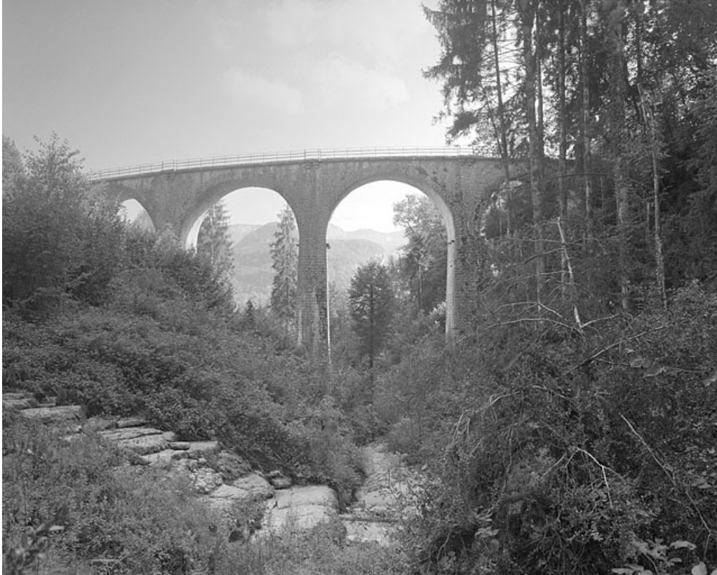
Le viaduc depuis le ruisseau du Nans.

39, Lavans-lès-Saint-Claude, lieudit : Lizon