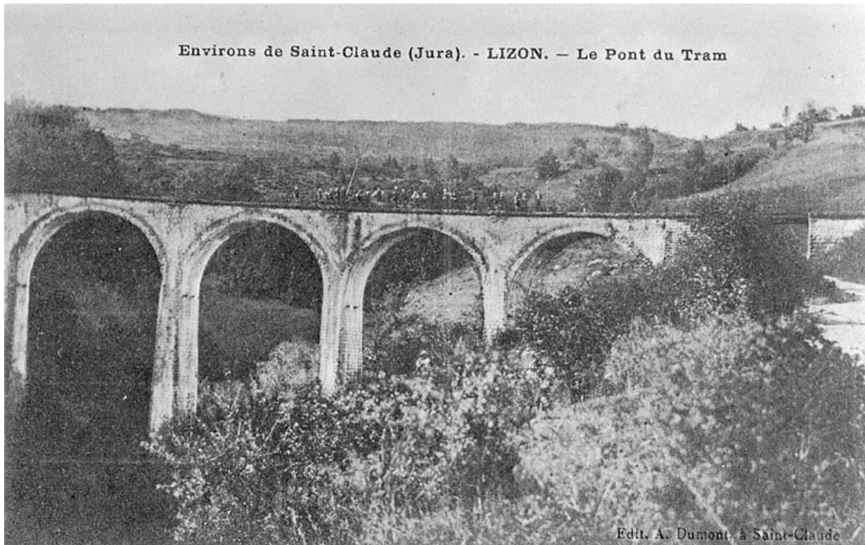
Environs de Saint-Claude (Jura) - Lizon - Le Pont du Tram.

39, Lavans-lès-Saint-Claude, lieu-dit : Lizon