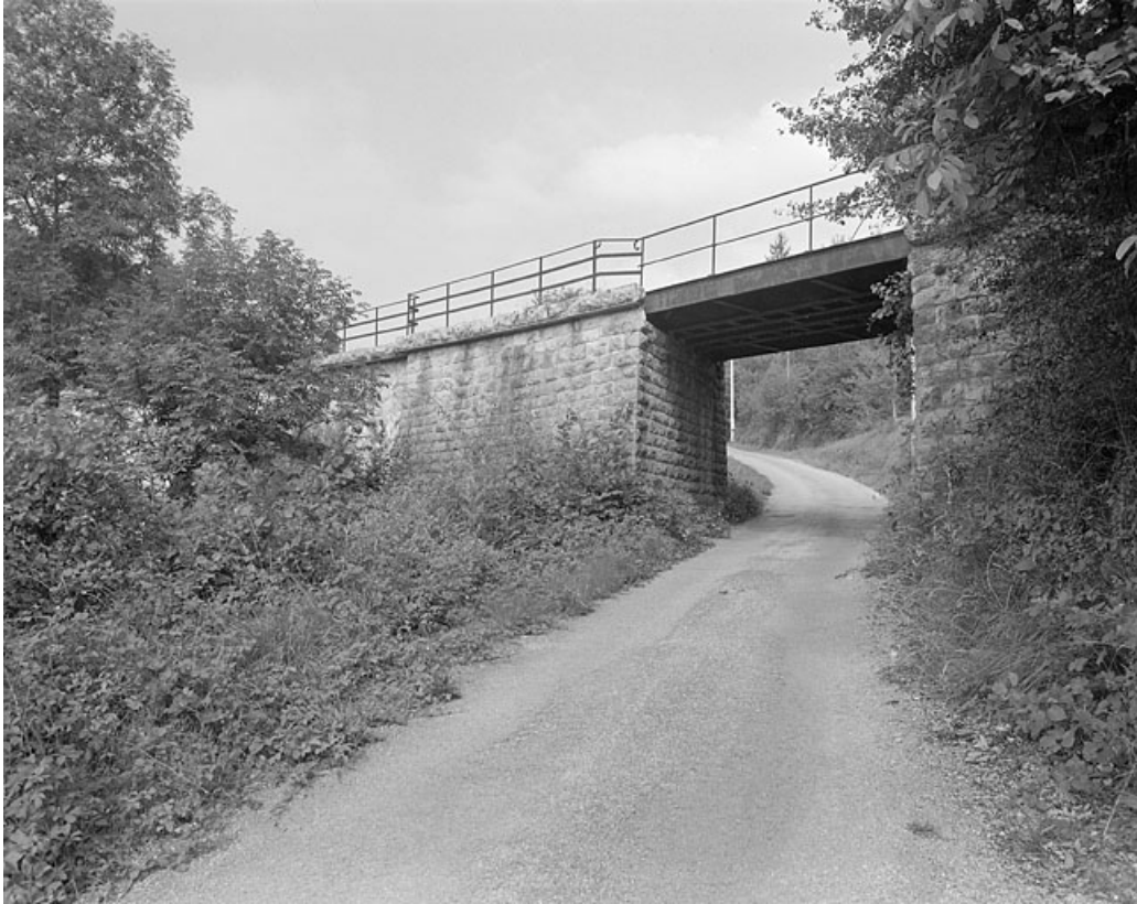
Passage du tramway sur l'ancien chemin menant à Lavans.

39, Lavans-lès-Saint-Claude, lieudit : Lizon