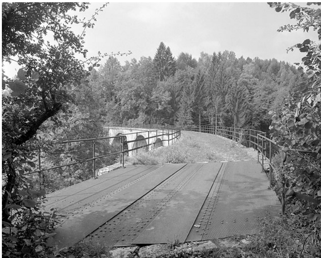
Tablier du viaduc.

39, Lavans-lès-Saint-Claude, lieudit : Lizon