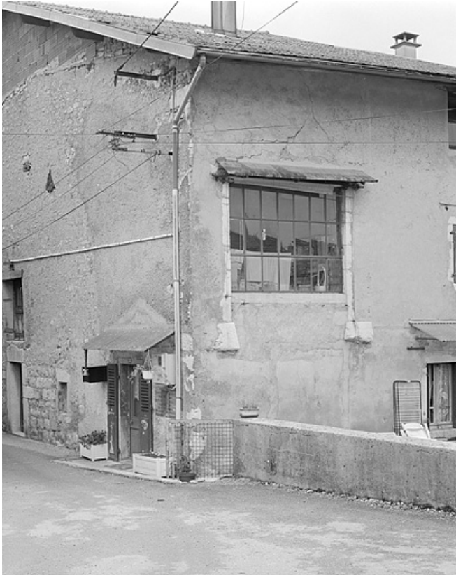
Atelier installé dans la grange haute d'une ferme.