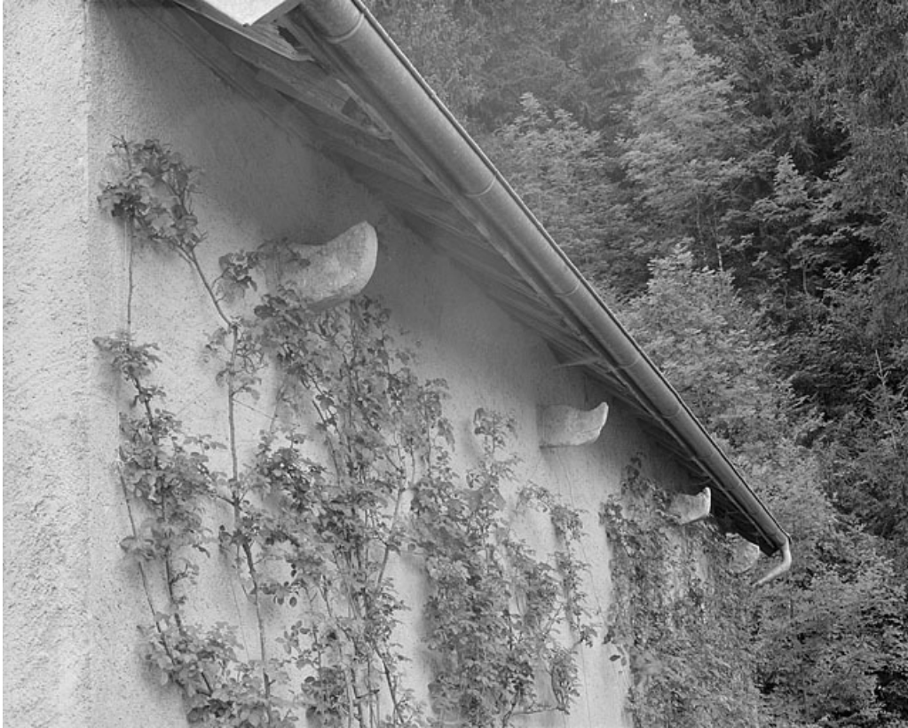
Corbeaux soutenant le chéneau amenant l'eau du toit à la citerne.