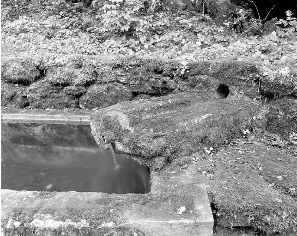
Détail d'une goulotte en pierre amenant l'eau dans le bassin.