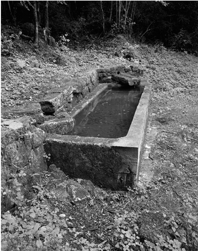
Le bassin, de profil.