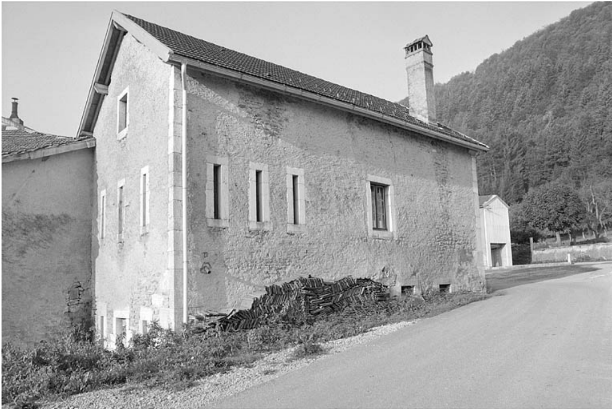
Face gauche et façade postérieure.