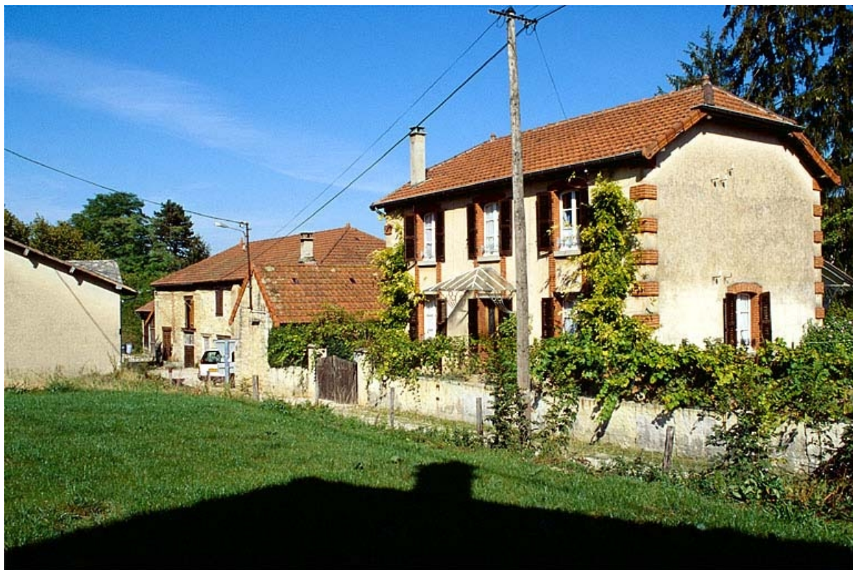
Vue d'ensemble depuis le sud-ouest.