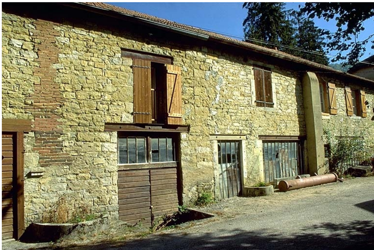
Façade antérieure de l'atelier de fabrication.