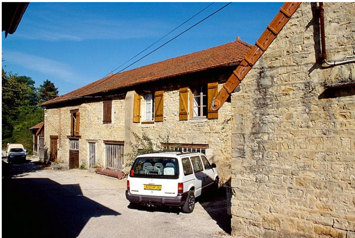
Atelier de fabrication et mur ouest du fournil.