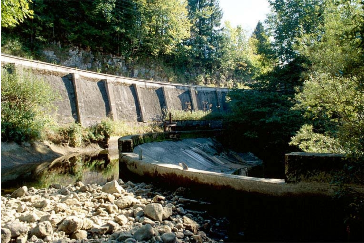
Canal d'amenée et déversoir du barrage.