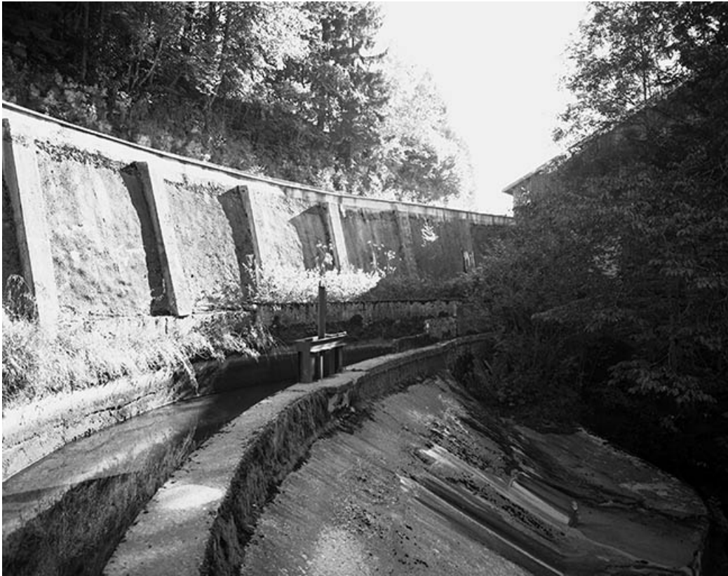
Canal d'amenée et déversoir du barrage.