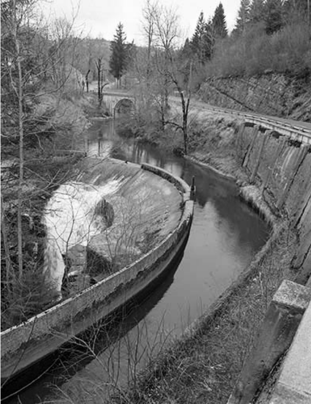
Canal d'amenée de la centrale.