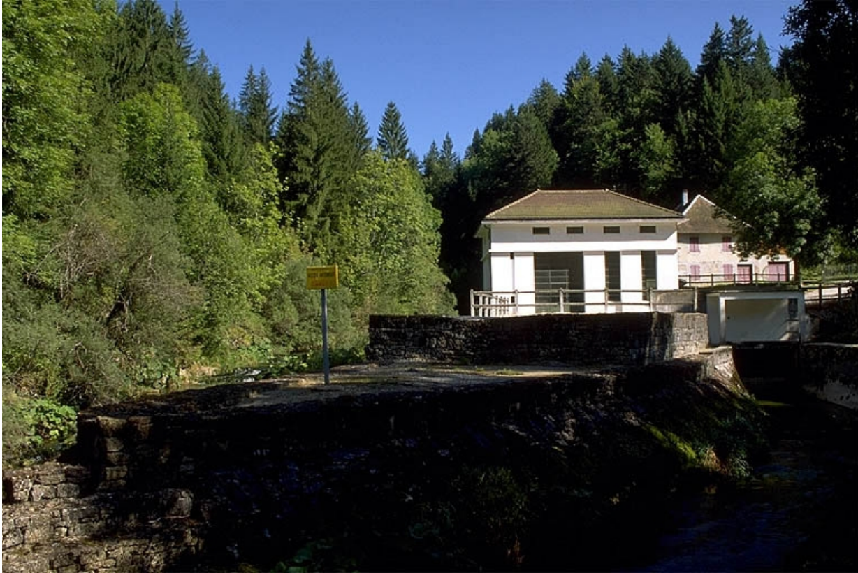
La centrale hydroélectrique depuis le canal de fuite.