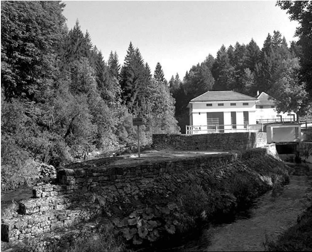
La centrale hydroélectrique depuis le canal de fuite.