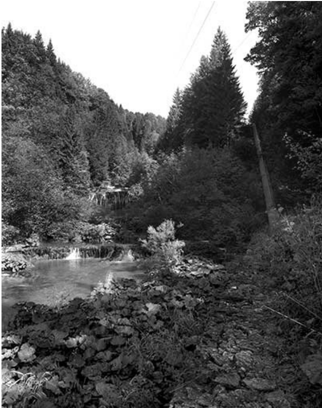
La Serpentine et la conduite forcée de la centrale.