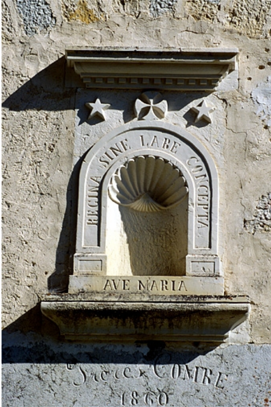
Façade du logement. Niche surmontant le linteau de la porte d'entrée.