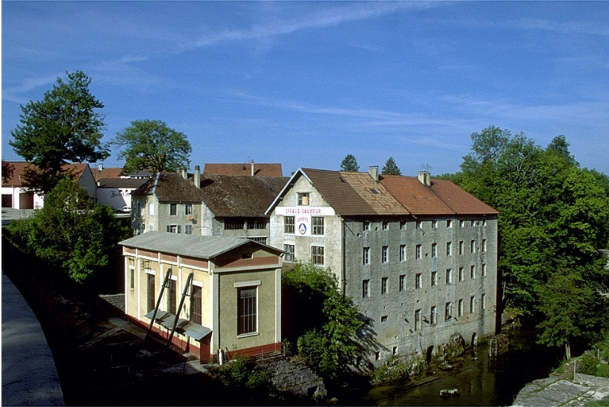
Vue d'ensemble depuis le sud-est.