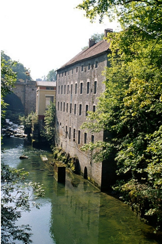
Elévation de l'atelier de fabrication depuis l'aval.