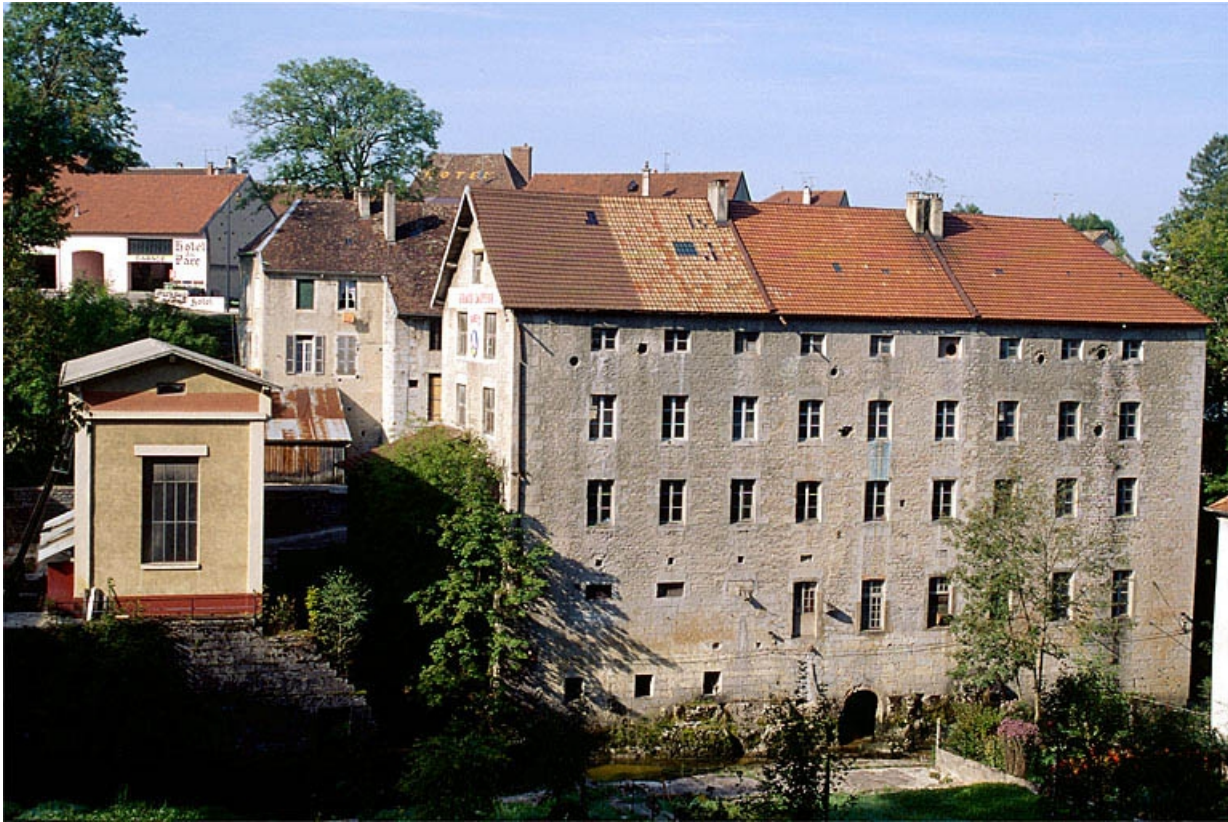
Vue d'ensemble depuis l'est.