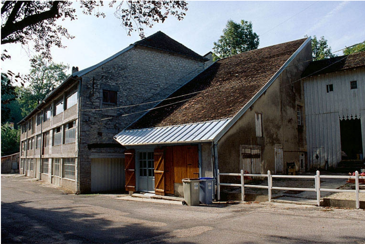
Atelier de fabrication, magasin industriel et bureau.