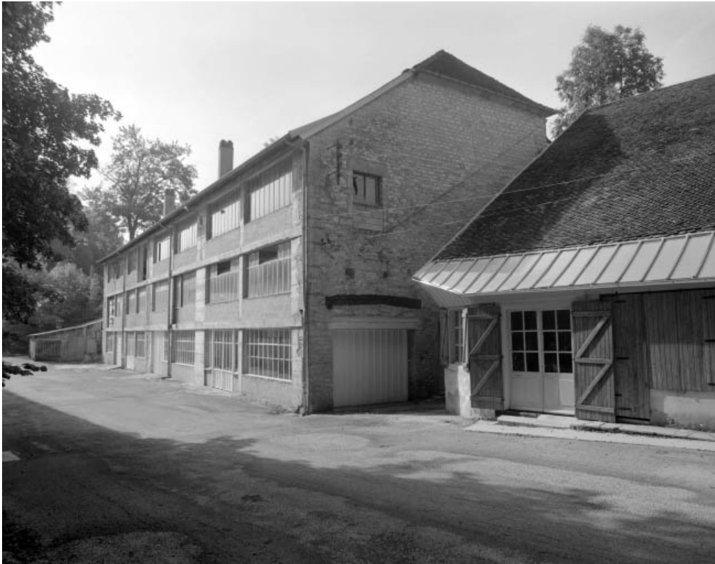
Atelier de fabrication et magasin industriel vus de trois quarts droit.