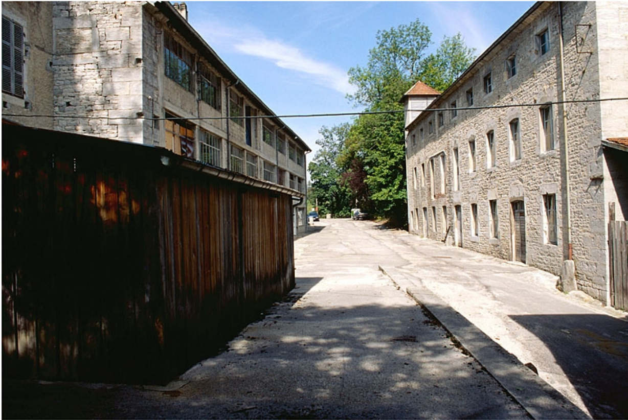
Les ateliers de fabrication depuis la ruelle des Moulins.