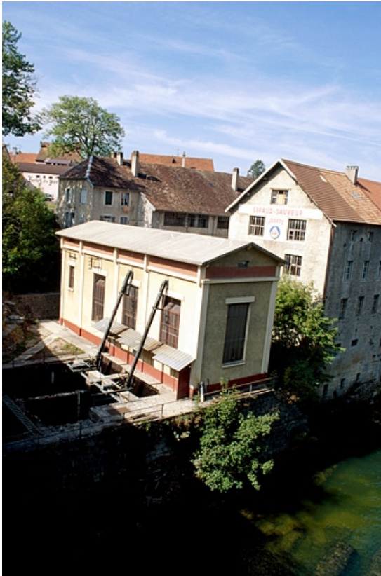
La centrale hydroélectrique.