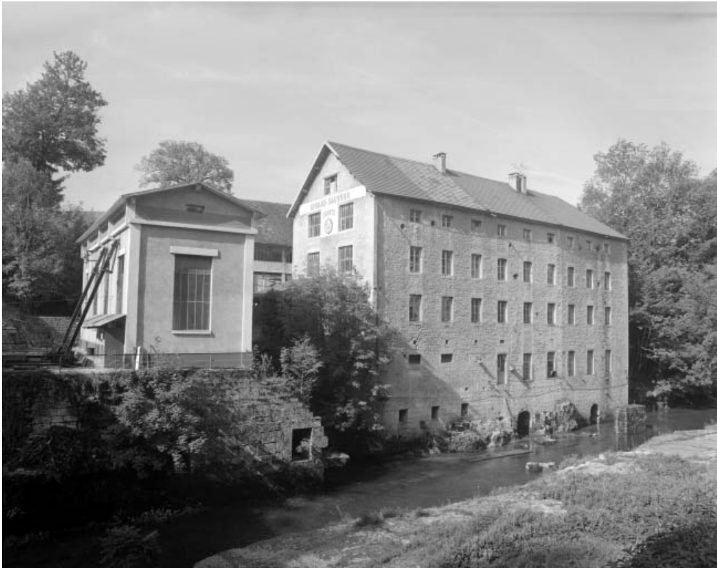
Centrale hydroélectrique et atelier de fabrication depuis la rive droite.