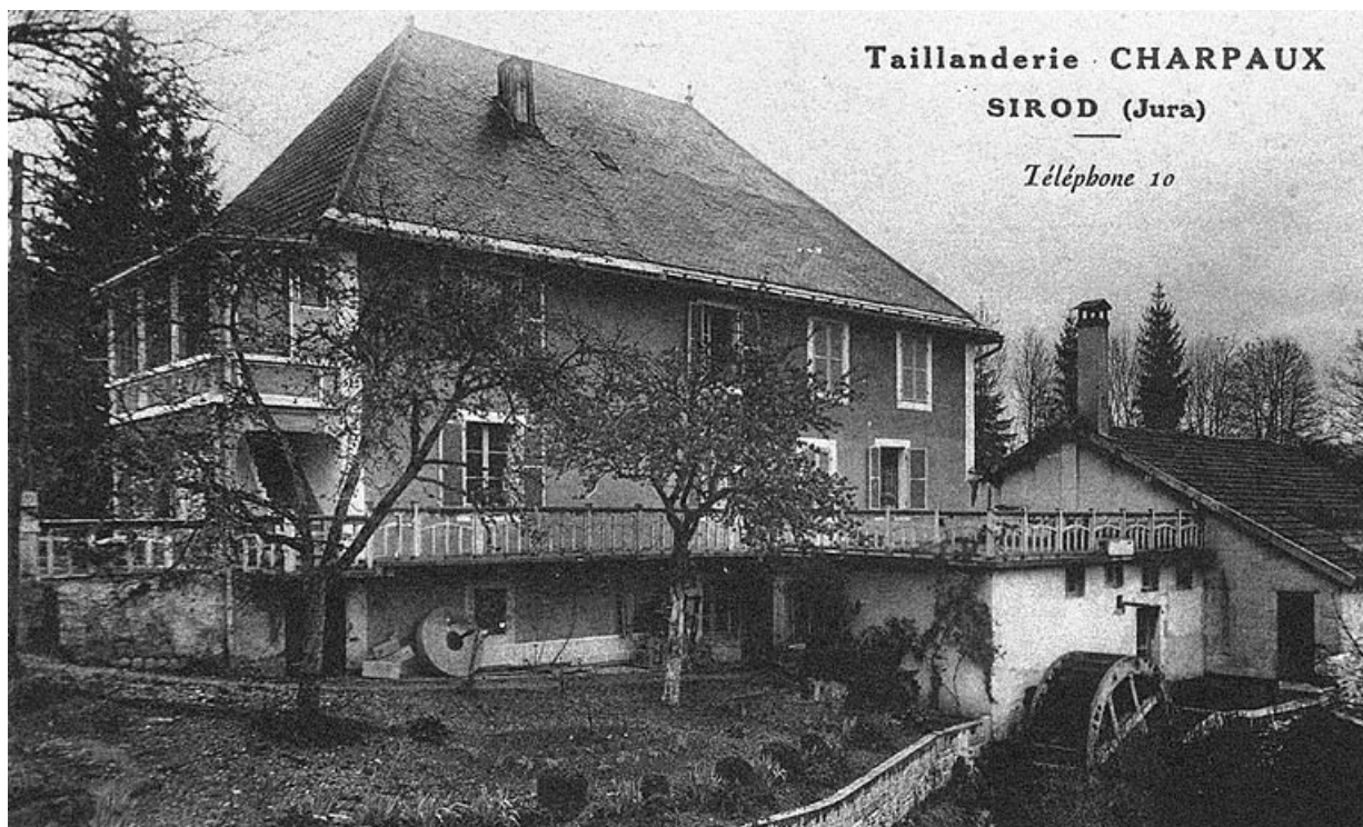
Taillanderie Charpoux - Sirod (Jura), vers 1922-1923. Carte postale, s.d. [vers 1922-1923].