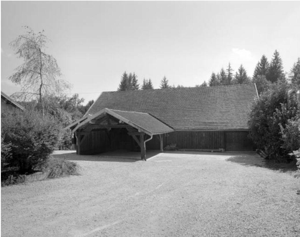
Façade nord de l'atelier de fabrication.