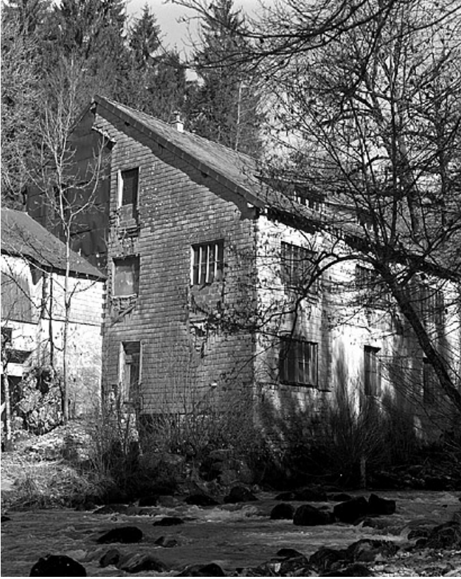
Ancien atelier de fabrication depuis le sud.