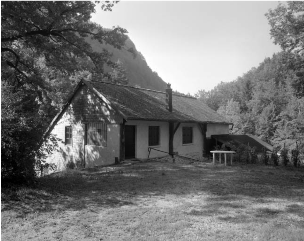
Atelier de fabrication vu de trois quarts.