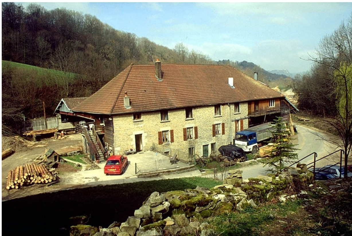
Vue d'ensemble depuis l'est.