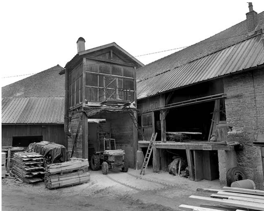
Silo à sciure et atelier de fabrication.