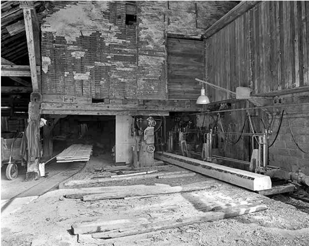
Intérieur de l'atelier de sciage.