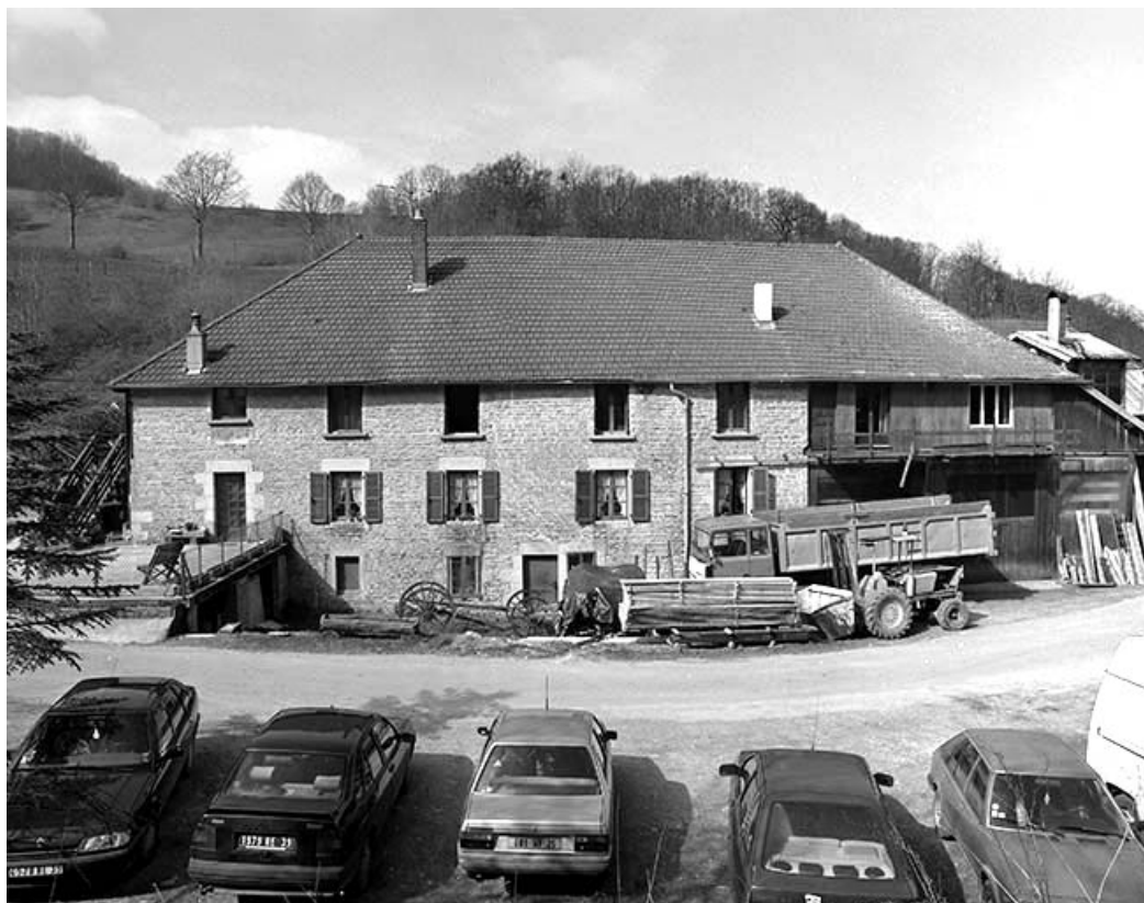
Logement et atelier de fabrication : façade antérieure.