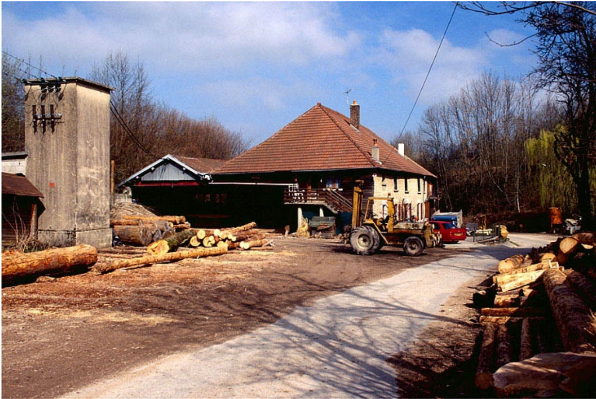
Vue d'ensemble depuis le sud.