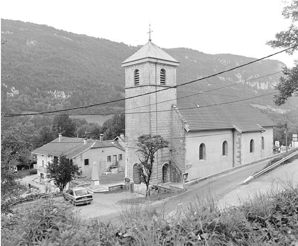
Vue de situation depuis le sud-est.

39, Villard-Saint-Sauveur, lieudit : le Villard