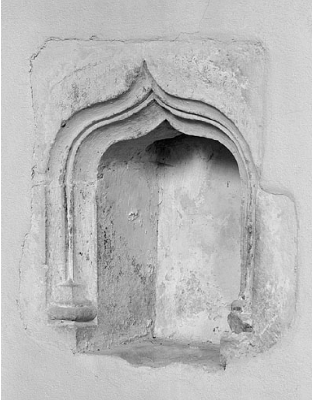
La niche-crédence du choeur.

39, Villard-Saint-Sauveur, lieudit : le Villard