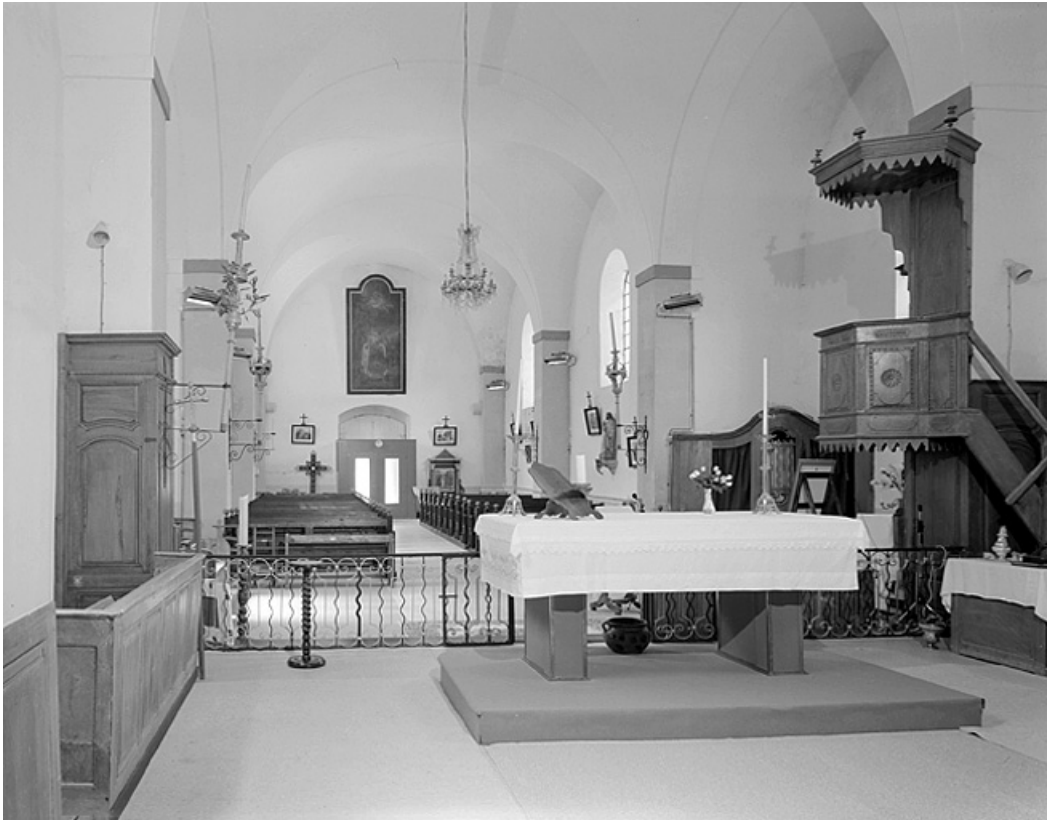
Elévation intérieure nord vue depuis le chœur.

39, Villard-Saint-Sauveur, lieudit : le Villard