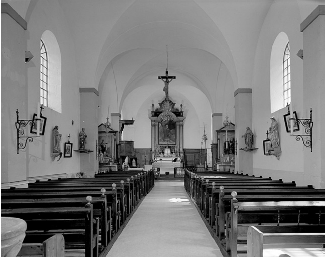
La nef et le chœur vus depuis l'entrée.

39, Villard-Saint-Sauveur, lieudit : le Villard