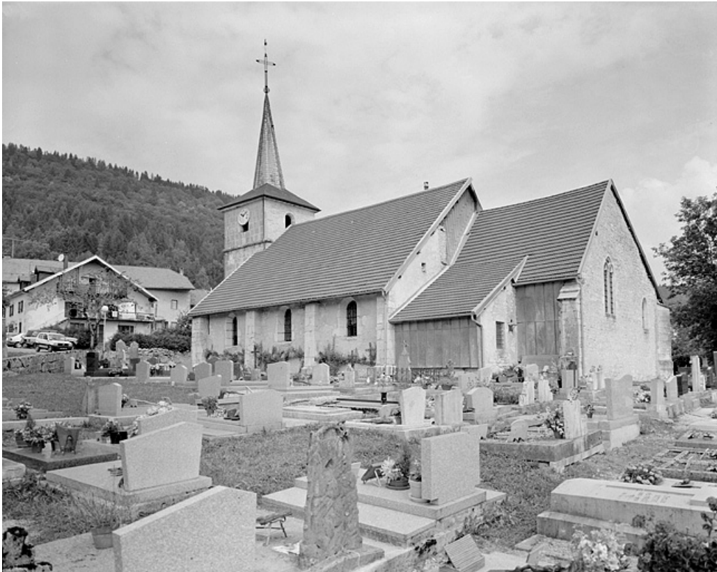
Face droite et chevet.