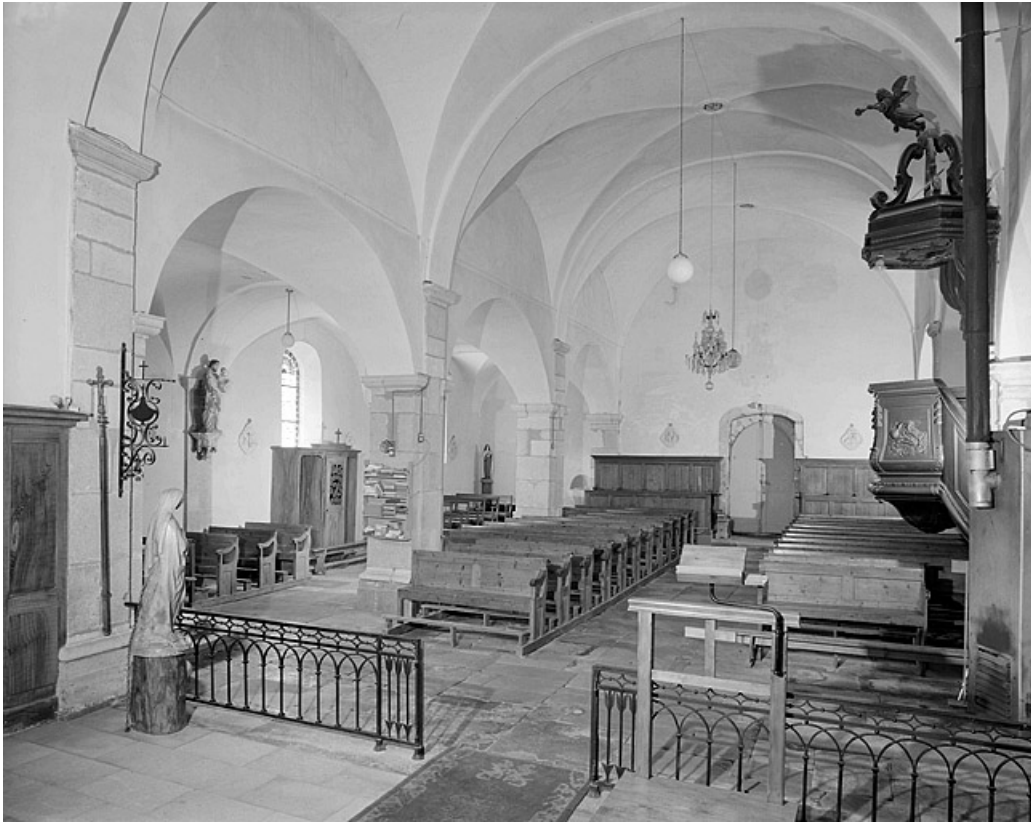
Elévation intérieure sud de la nef vue depuis le chœur.