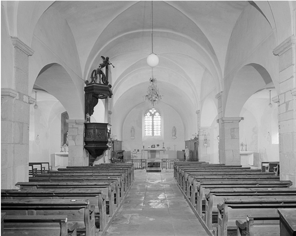
La nef et le chœur vus depuis l'entrée.