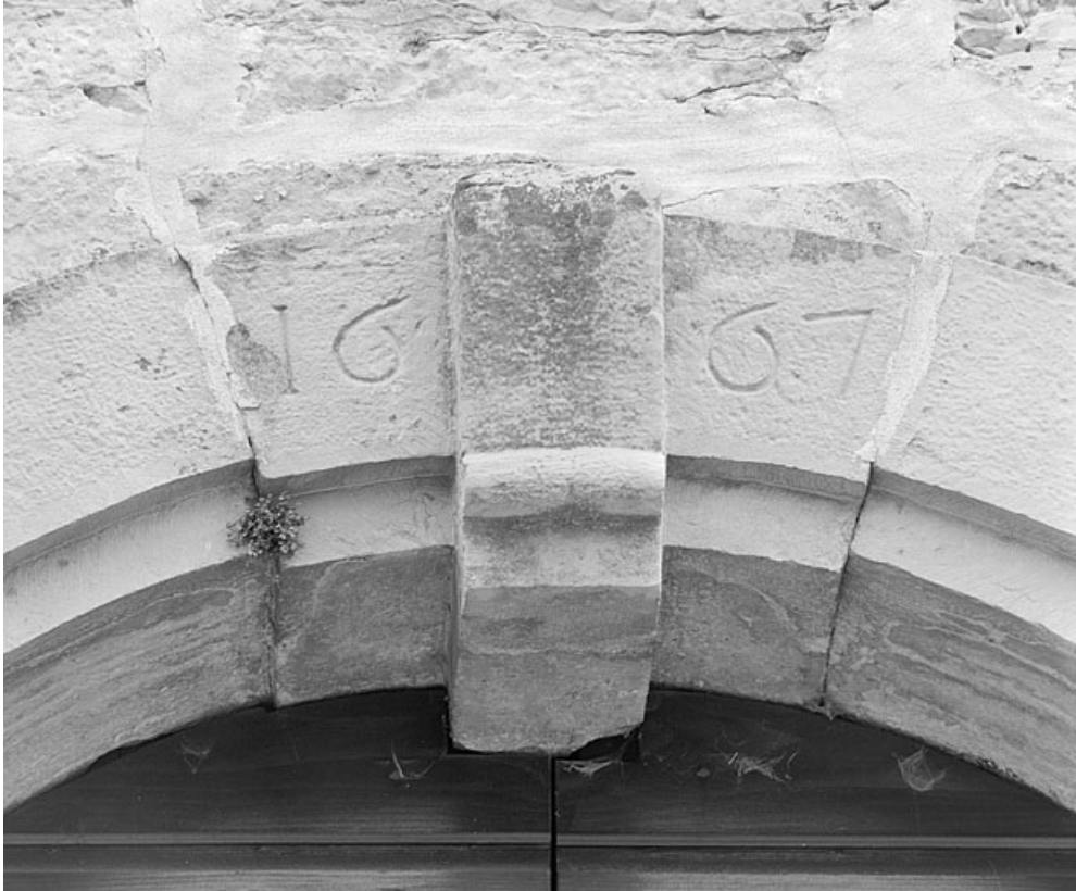
Date sur la clef de l'arc d'entrée de la nef. 39, Ravilloles