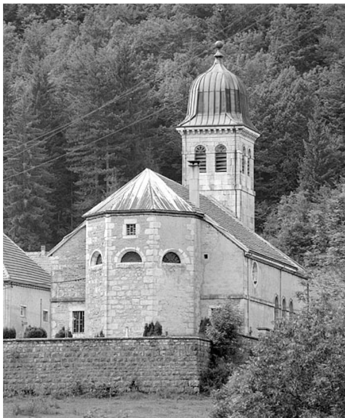
Le chevet. 39, Leschères