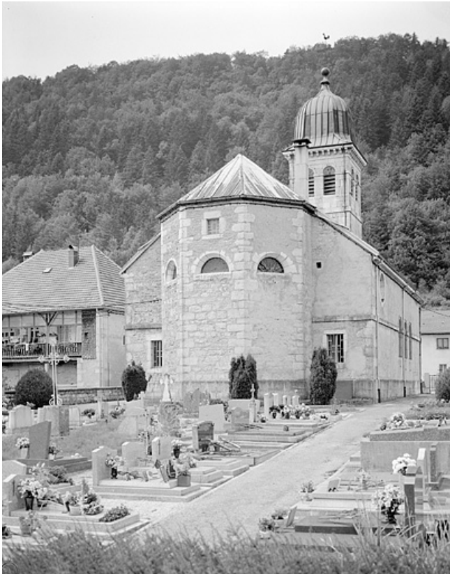
Le chevet, vu depuis le cimetière.