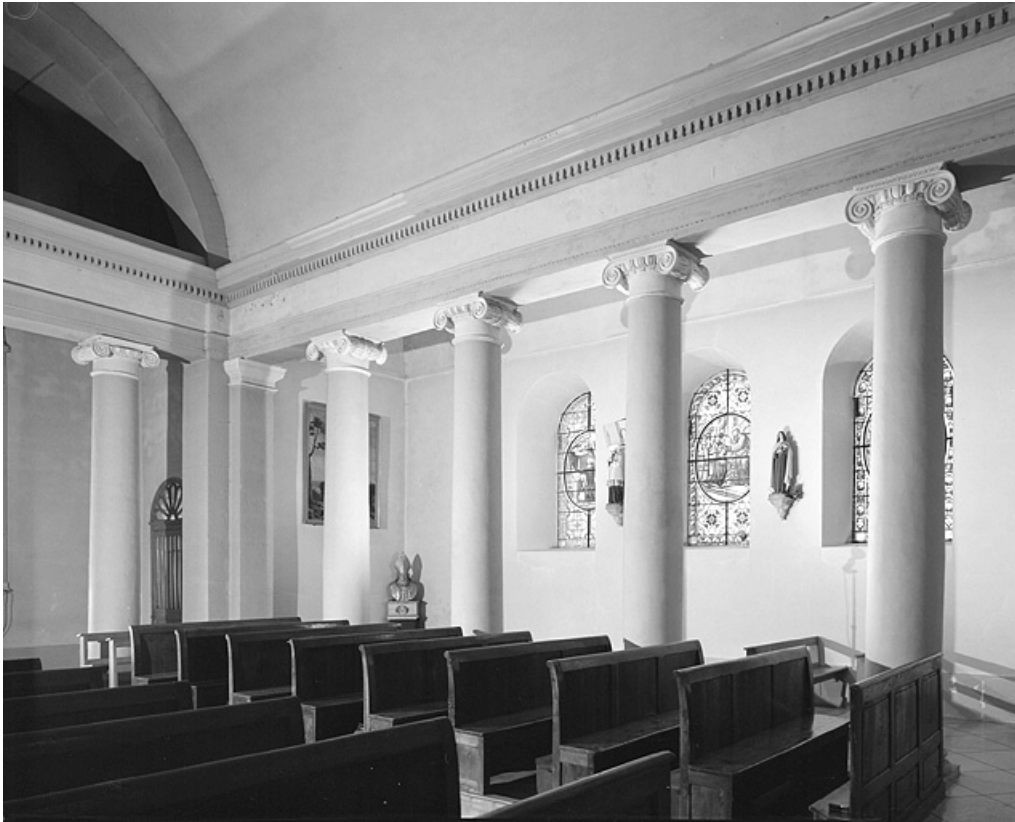
Elévation intérieure nord de la nef.