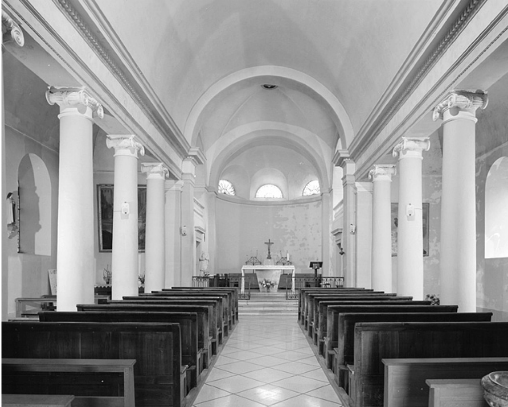
La nef et le chœur vus depuis l'entrée.