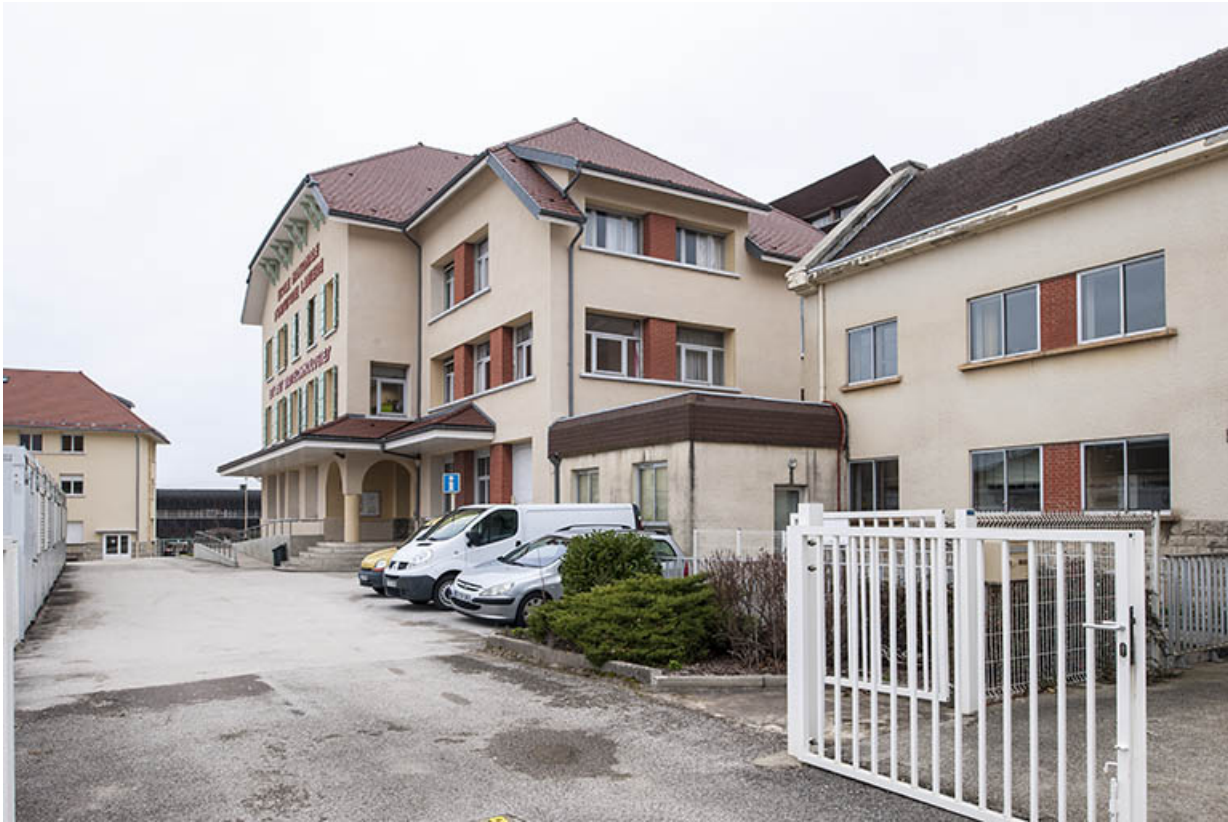
Façade antérieure ouest de l'école.