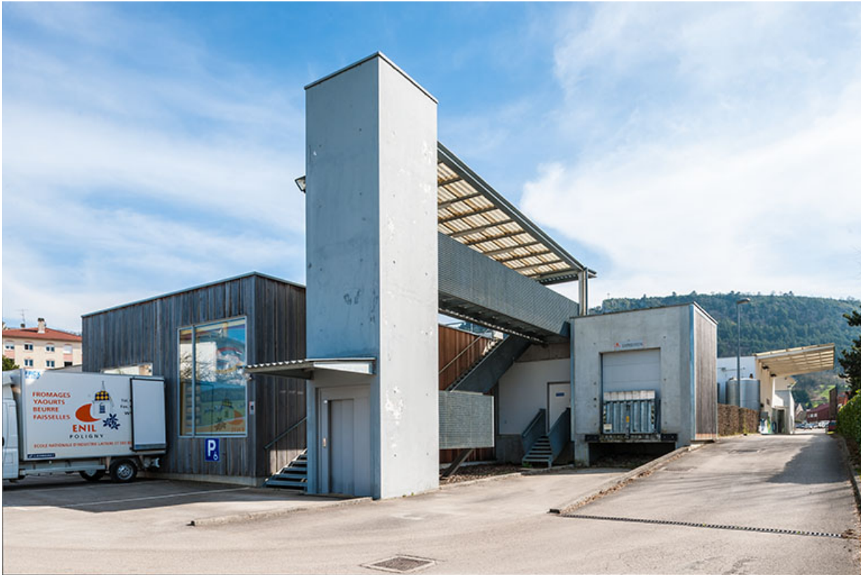
Tour d'ascenseur sur la face postérieure nord de la halle de génie alimentaire. 39, Poligny rue du Champ de Foire