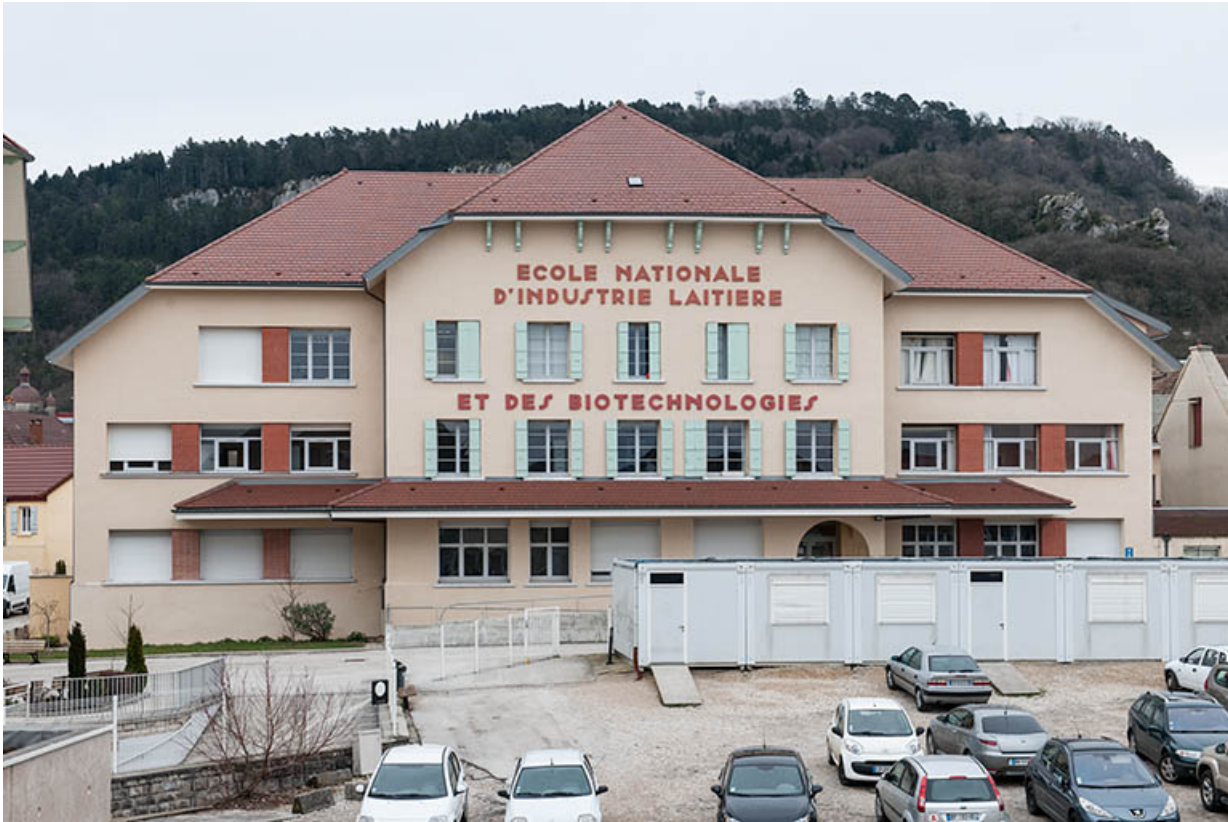
Façade antérieure ouest de l'école.