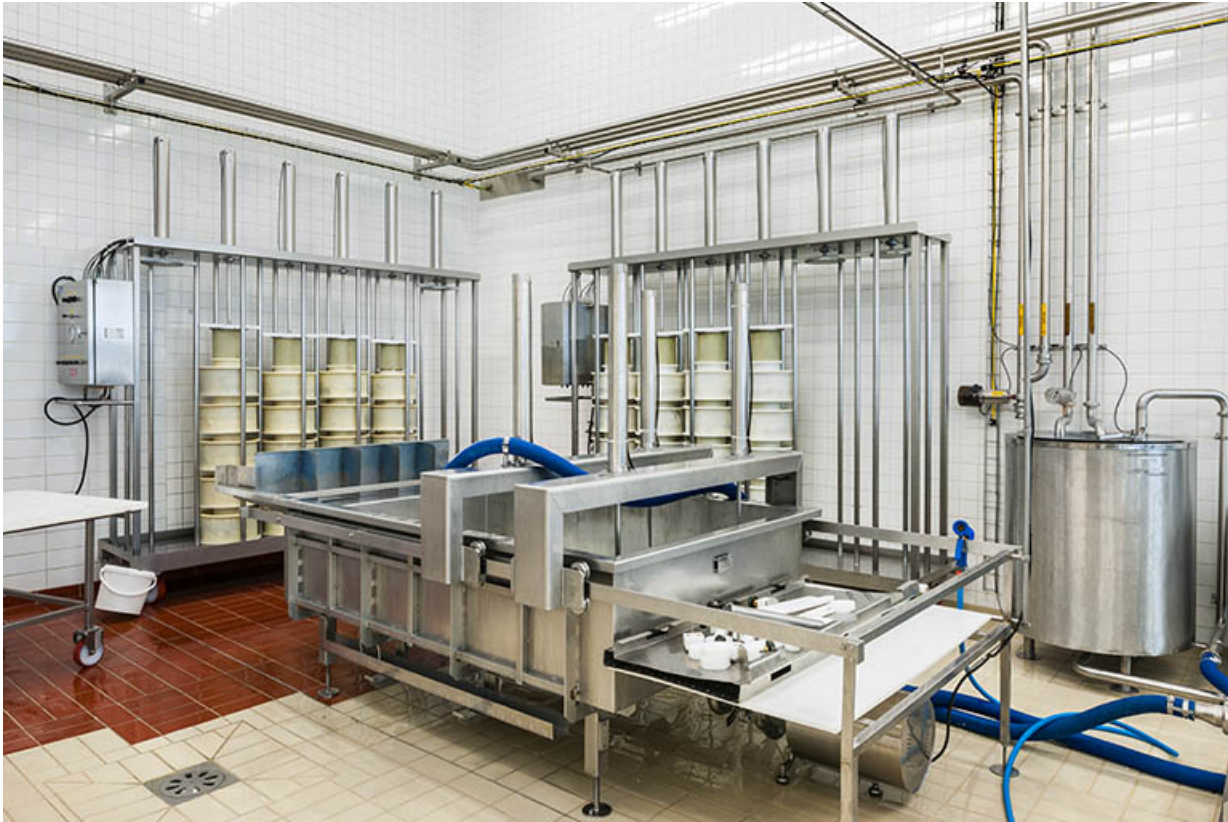
Salle de production des produits frais.