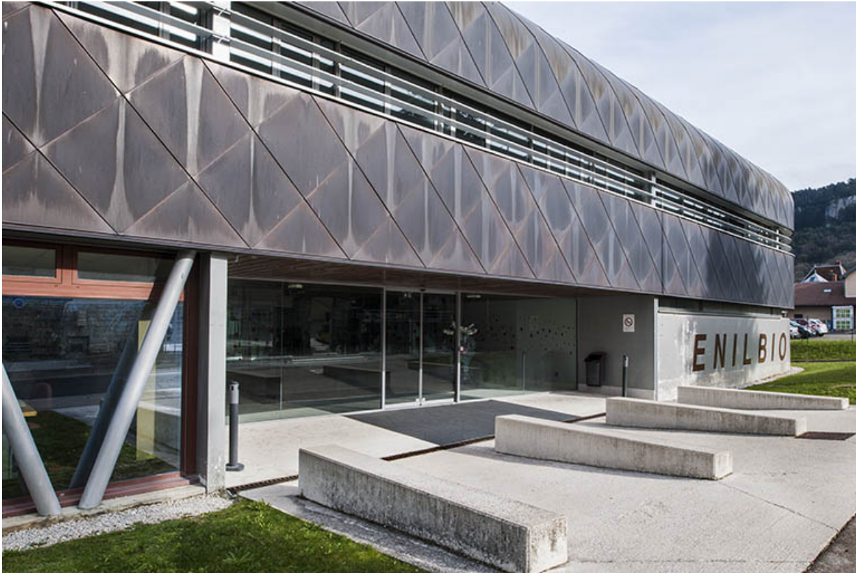
Détail de la façade d'entrée sud sur rue de la halle de génie alimentaire.