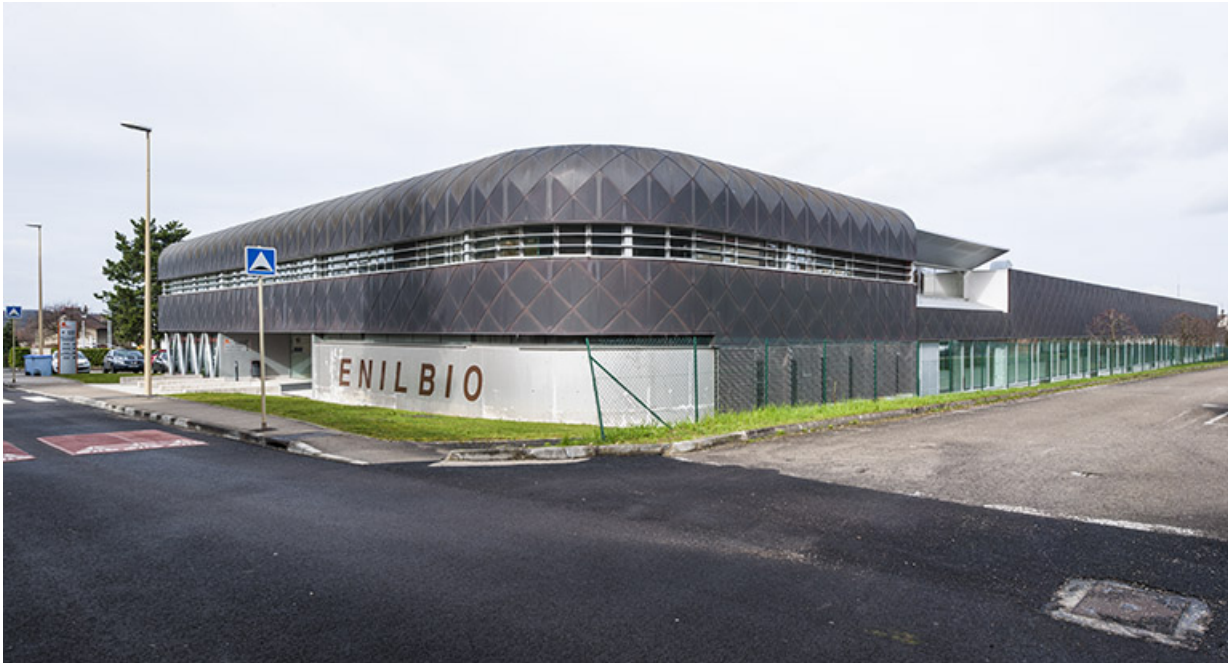
Vue sur les façades est et sud de la halle de génie alimentaire.