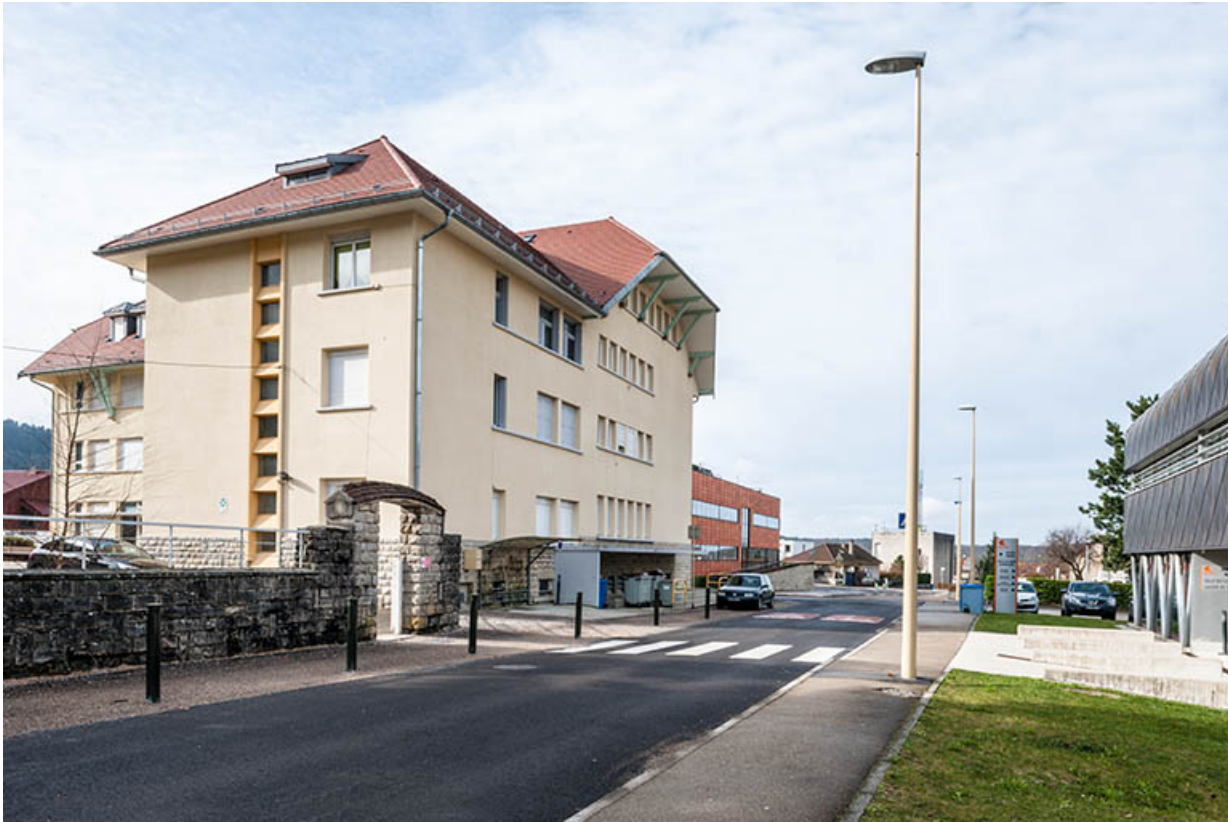
Façade nord de l'internat sur la rue du vieil hôpital.