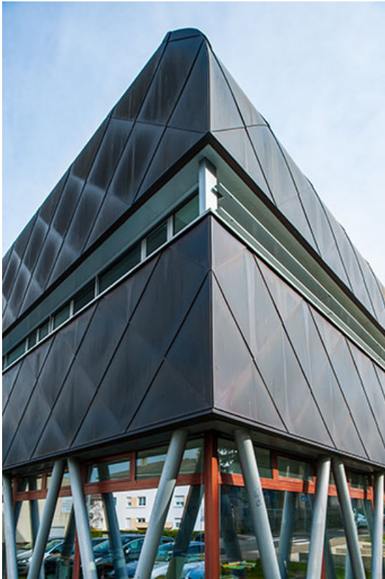
Détail de l'angle sud-ouest de la façade d'entrée sud sur rue de la halle de génie alimentaire. 39, Poligny rue du Champ de Foire