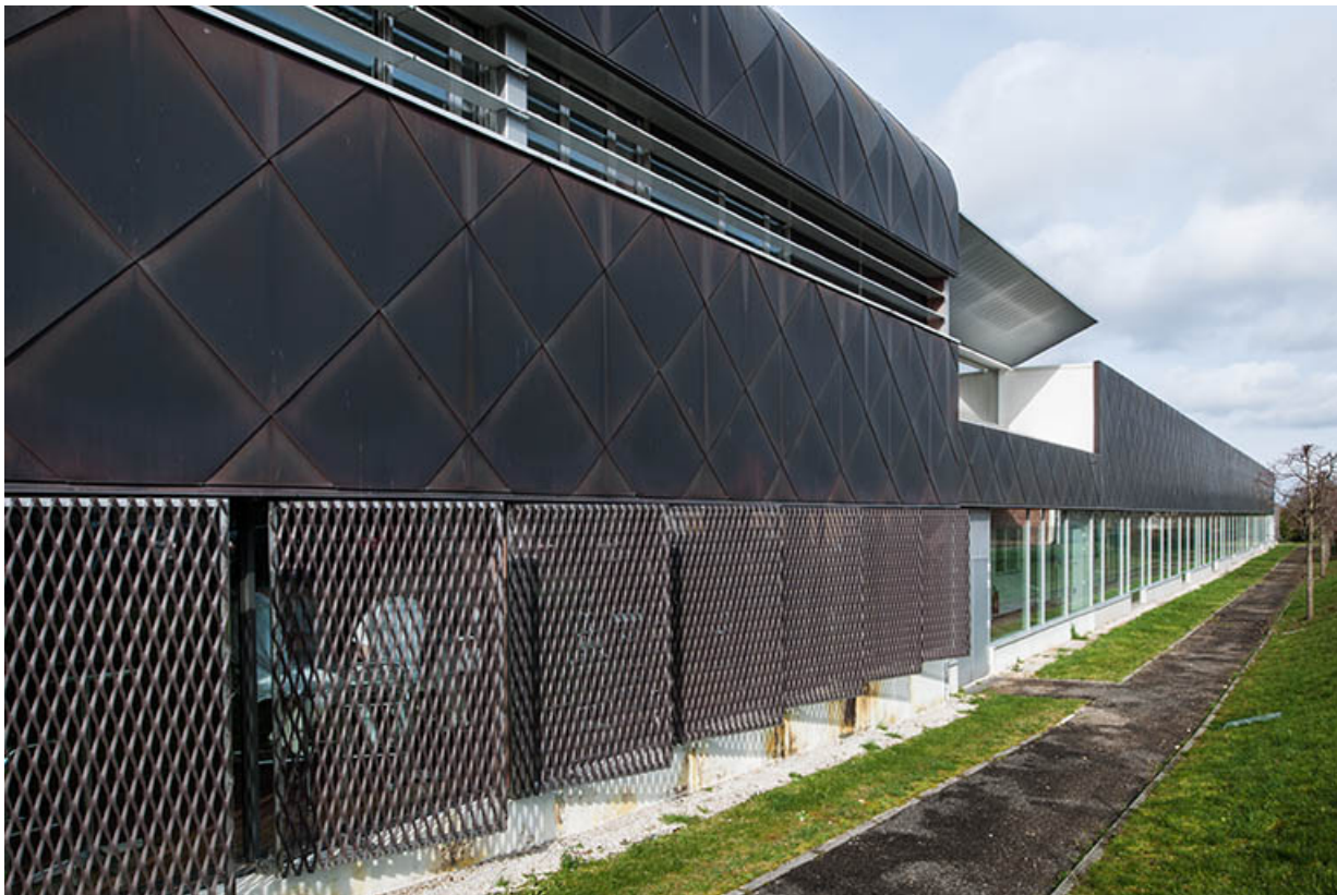
Détail de la façade orientale de la halle de génie alimentaire.