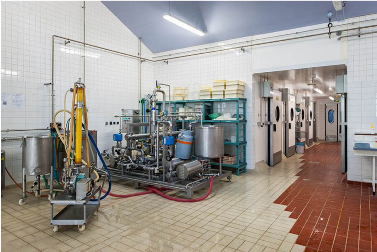
Salle de production des produits frais et accès aux chambres froides.