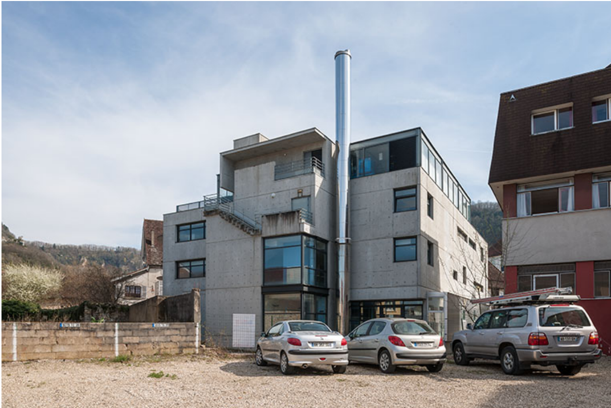
Façade nord de l'extension est de l'école et pignon nord de Cécalait. 39, Poligny rue du Champ de Foire