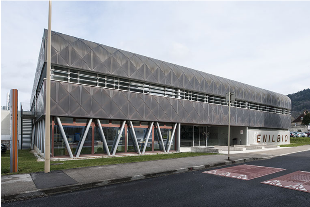
Façade d'entrée sud sur rue de la halle de génie alimentaire.