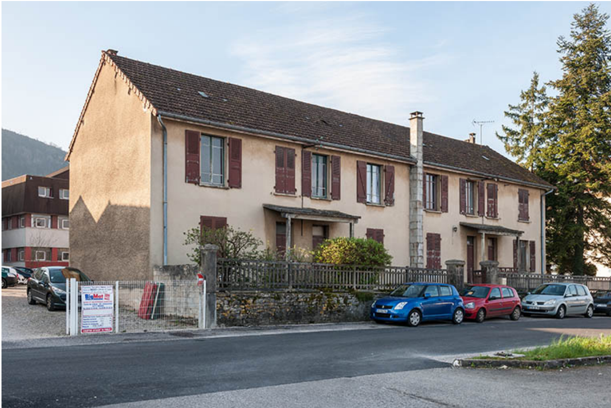
Façade antérieure nord de l'annexe (logement, atelier) sur la rue du vieil hôpital.