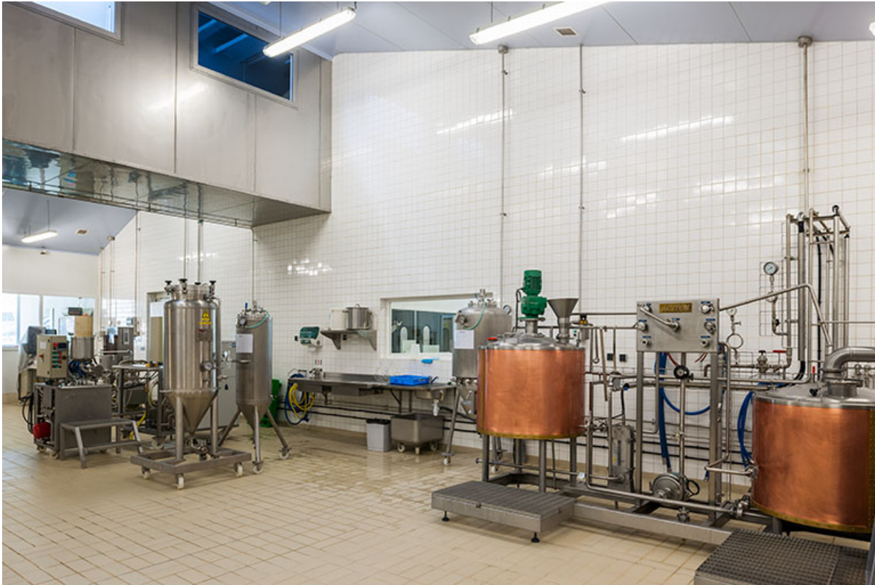
Salle de production des produits frais.