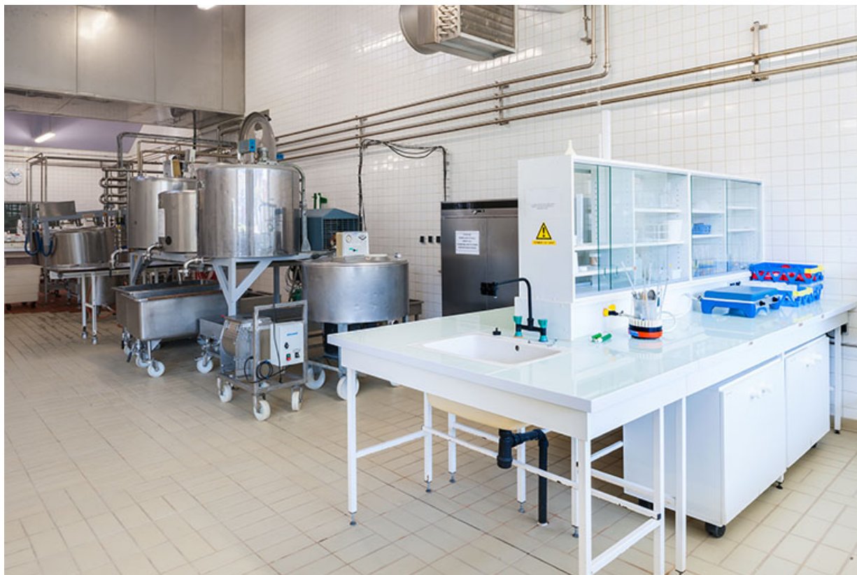
Salle de production des produits frais.