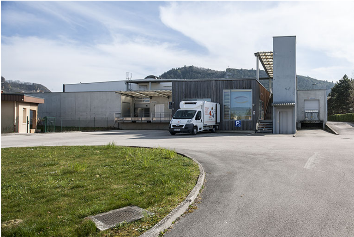
Angle d'une des deux villas de fonction et entrée nord de la halle de génie alimentaire avec sa tour d'ascenseur. 39, Poligny rue du Champ de Foire