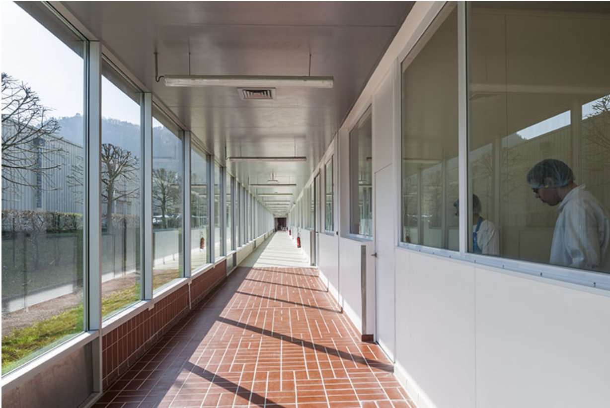
Galerie de circulation intérieure sur le côté est de la halle.