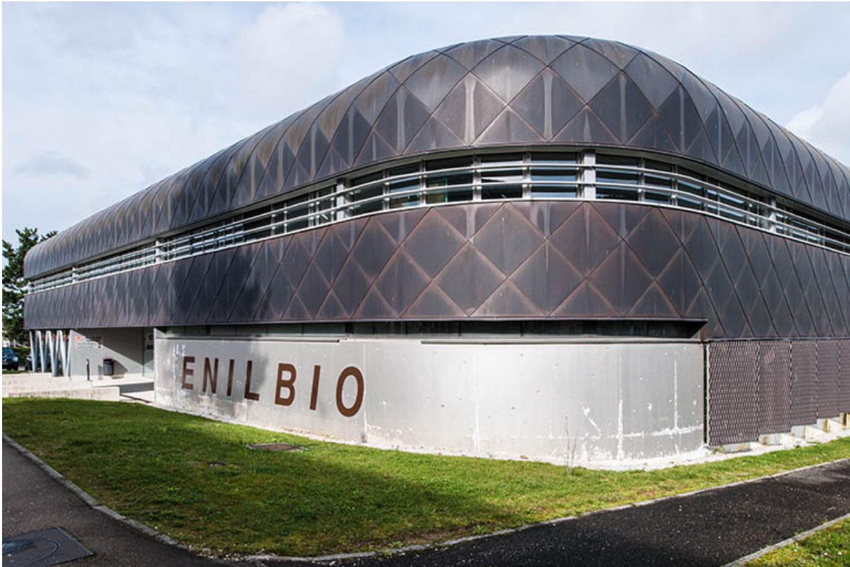
Angle sud-est et façade d'entrée sud sur rue de la halle de génie alimentaire. 39, Poligny rue du Champ de Foire