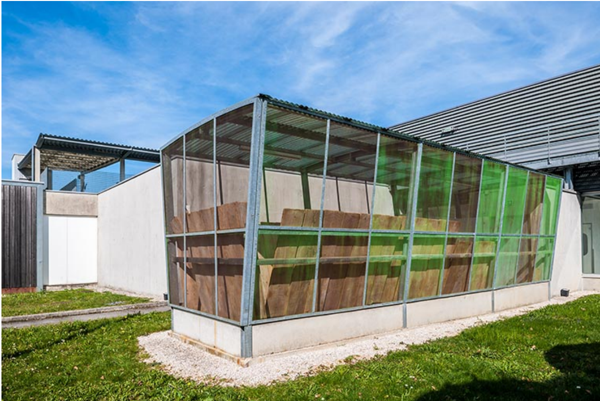
Local de séchage des planches sur la façade ouest.