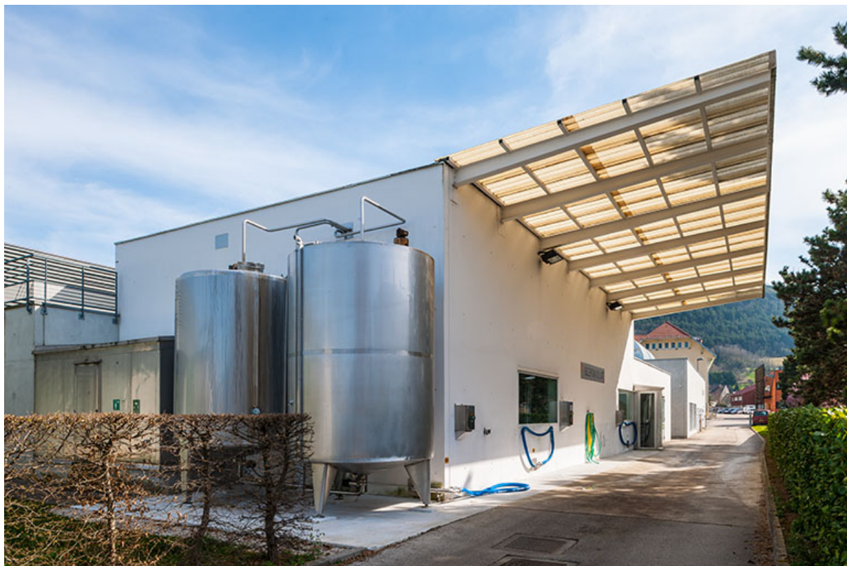
Angle nord-ouest de la halle de génie alimentaire.