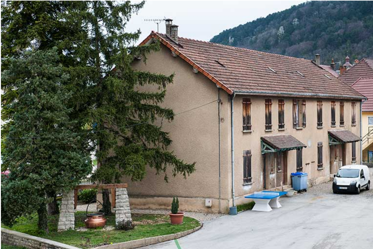
Chaudière à potence devant le pignon ouest de l'annexe (atelier logement).