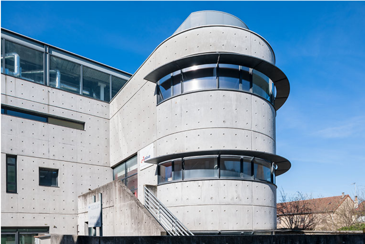
Détail de la rotonde de Cécailait.