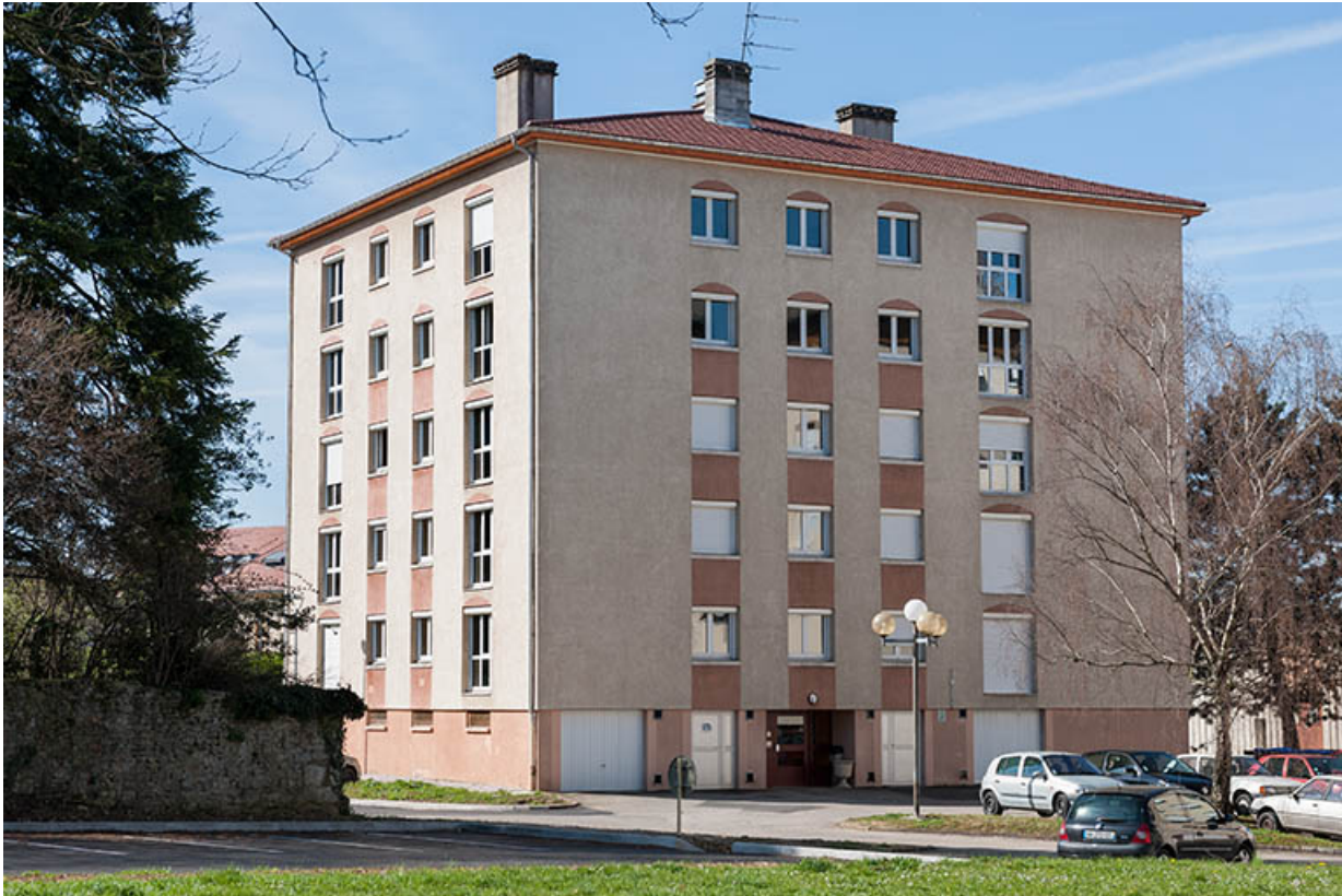
Angle nord-est, entrée du bâtiment des pinsons.