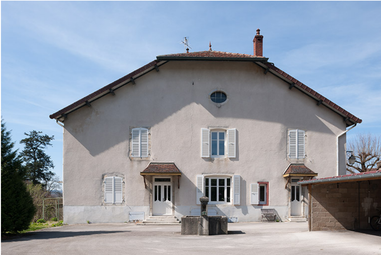
Façade est sur cour de la maison de fonction, 9 place Notre Dame.