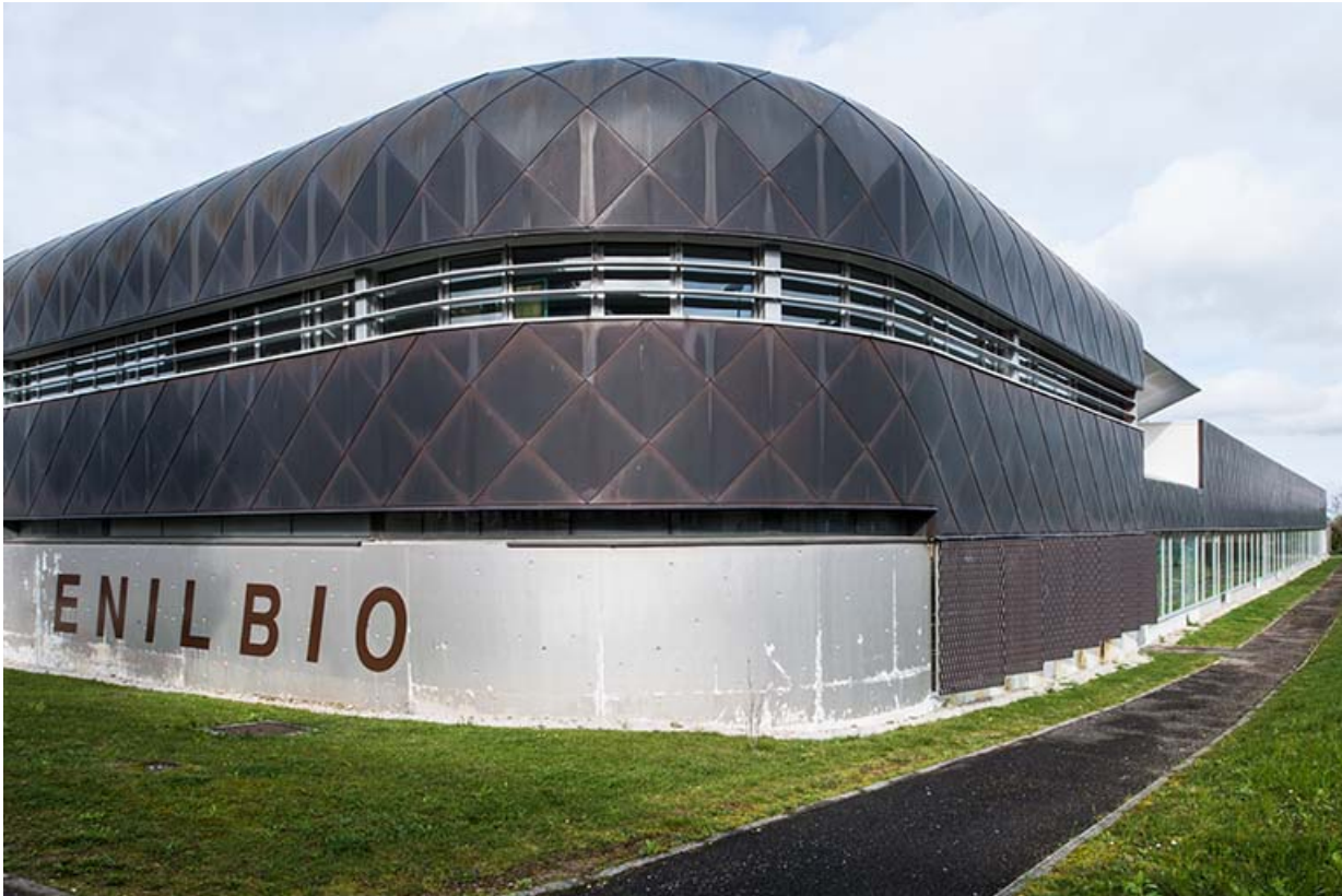
Angle sud-est et façade orientale de la halle de génie alimentaire.