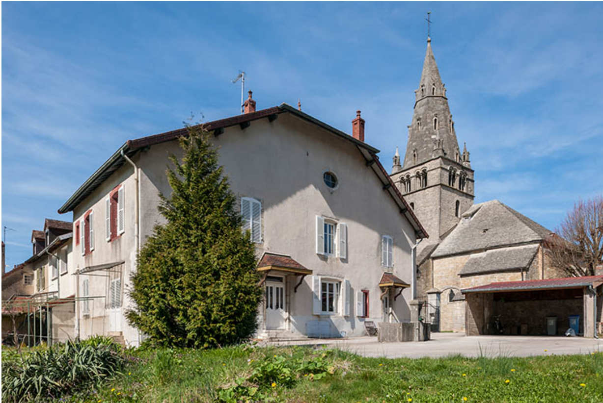
Façade est sur cour de la maison de fonction, annexe, dans son contexte, 9 place Notre Dame.