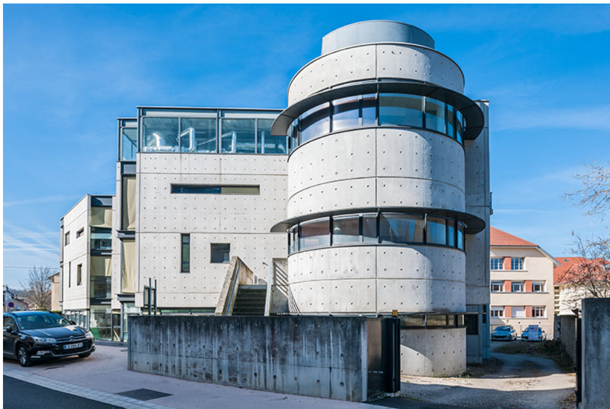
Rotonde nord-est et flanc est de Cécailait.