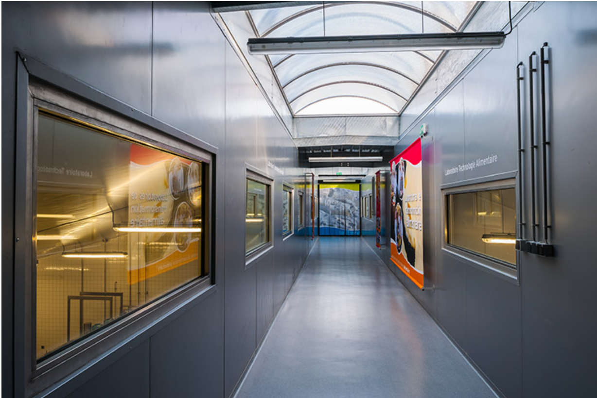
Galerie de circulation supérieure de la halle.