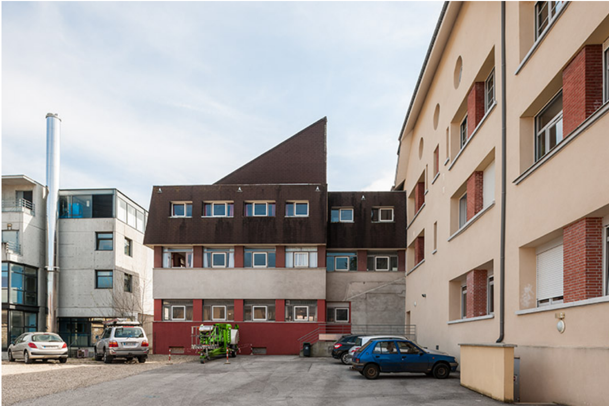
Façade postérieure est de l'école, façade nord de l'extension est de l'école et pignon nord de Cécailait. 39, Poligny rue du Champ de Foire