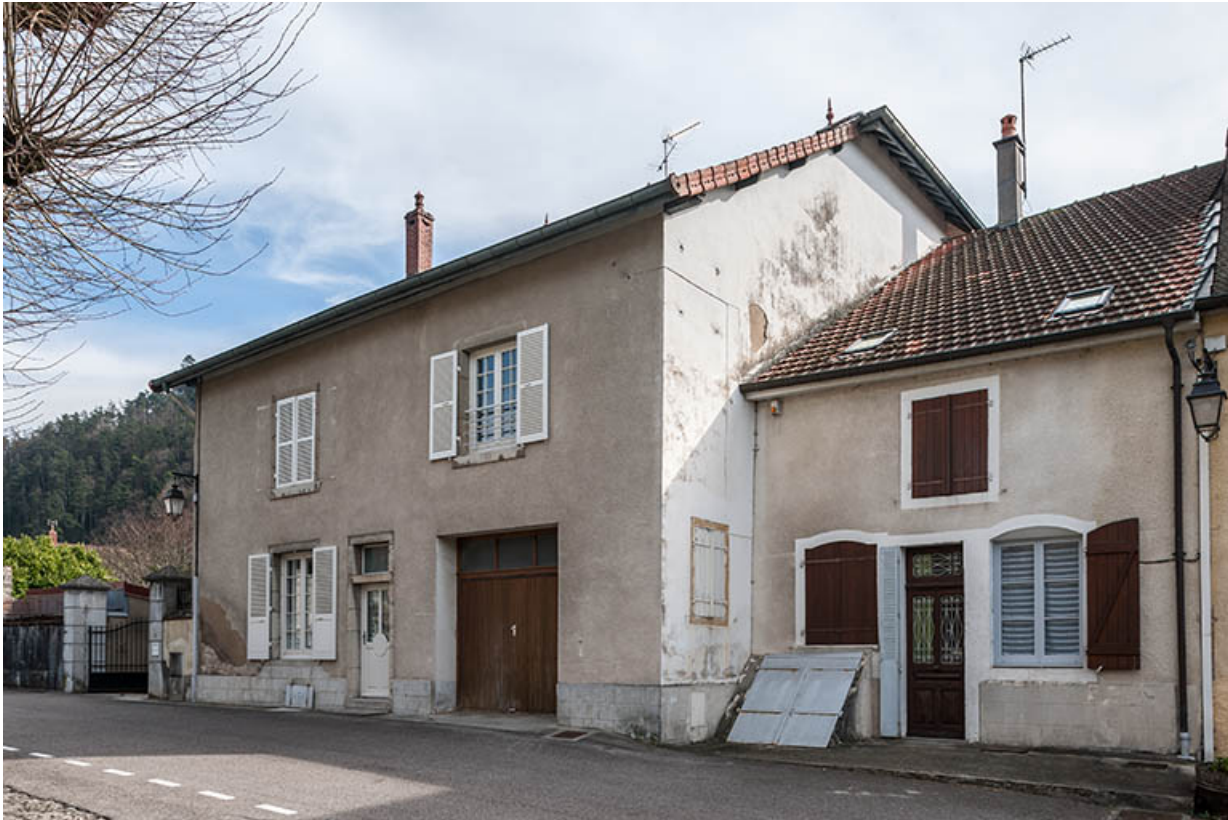
Angle nord-ouest de la façade sur rue de la maison de fonction, 9 place Notre Dame.