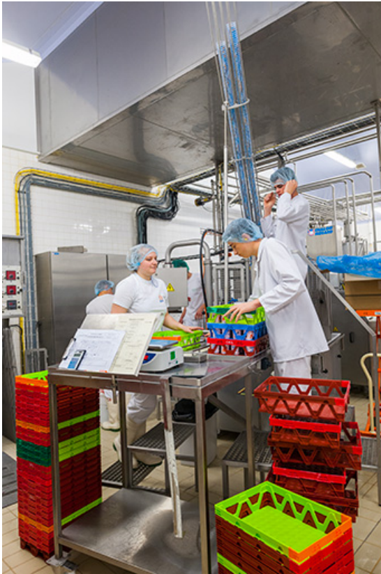
Détail de conditionnement.