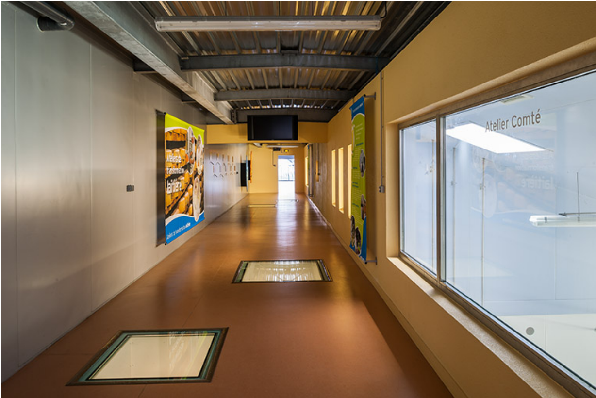
Galerie de circulation supérieure de la halle.