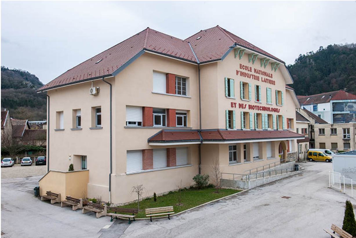
Façade antérieure principale de l'école, angle nord-ouest.