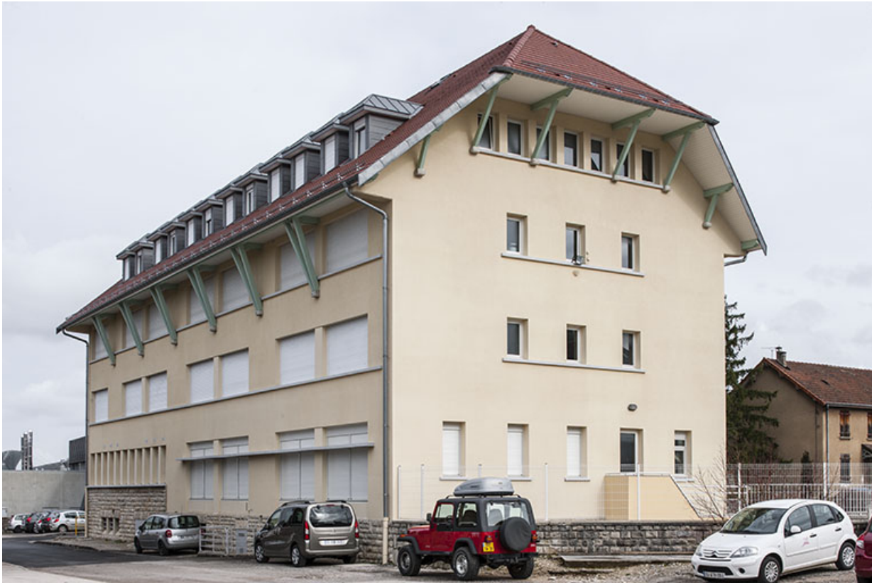
Angle sud-ouest et pignon sud de l'internat.