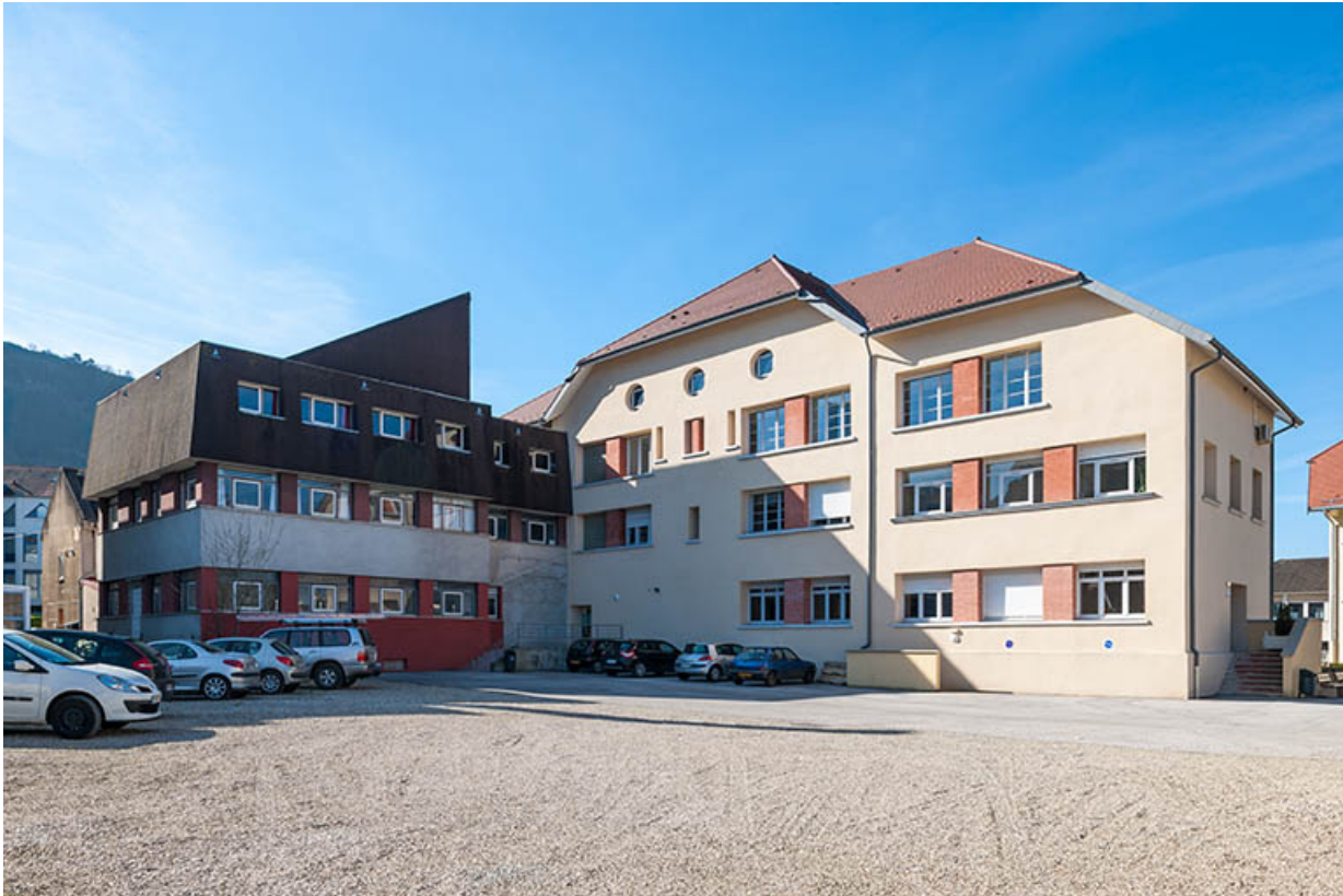
Cour intérieure, angle nord-est de l'école et façade nord de l'extension est. 39, Poligny rue du Champ de Foire