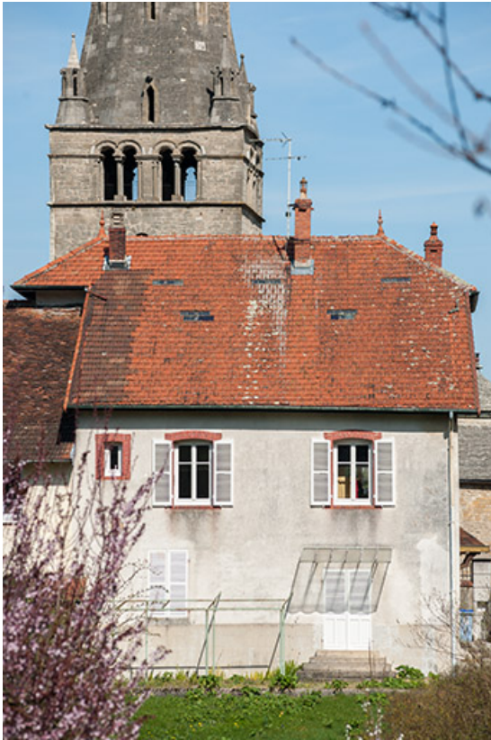
Pignon postérieur de la maison de fonction, 9 place Notre Dame.