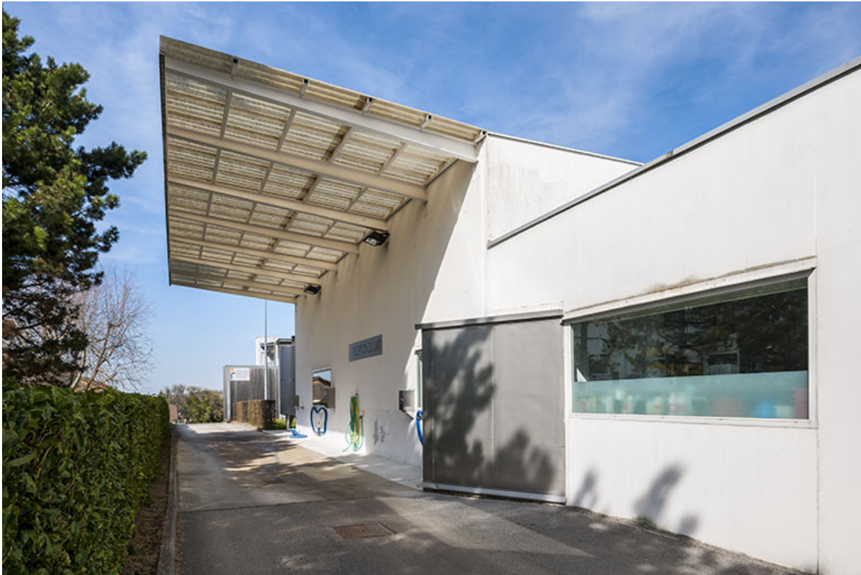
Détail de la façade ouest de la halle de génie alimentaire.