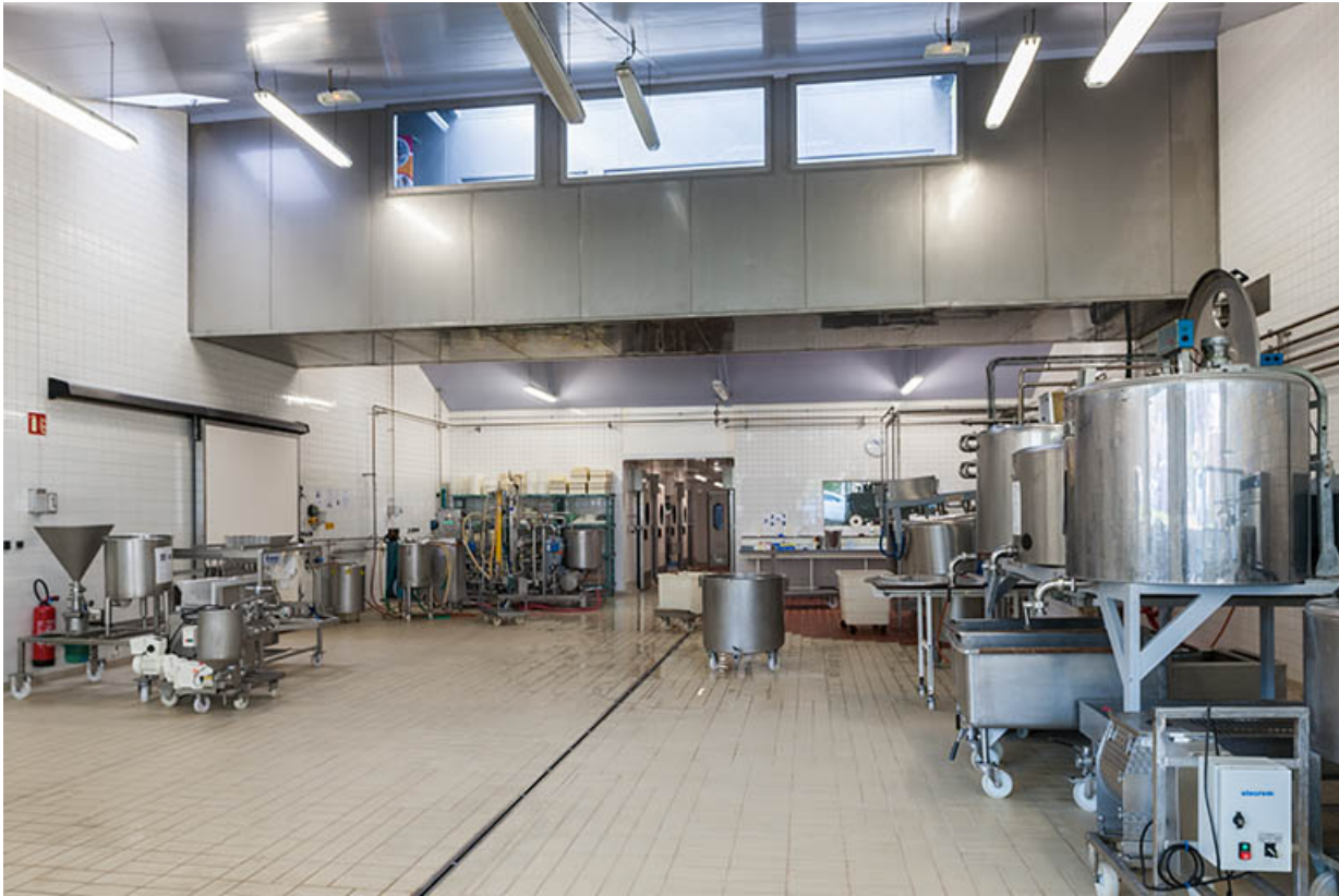
Salle de production des produits frais.