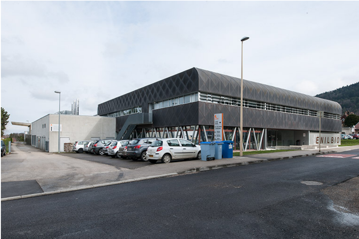
Vue sur les façades ouest et sud de la halle de génie alimentaire.