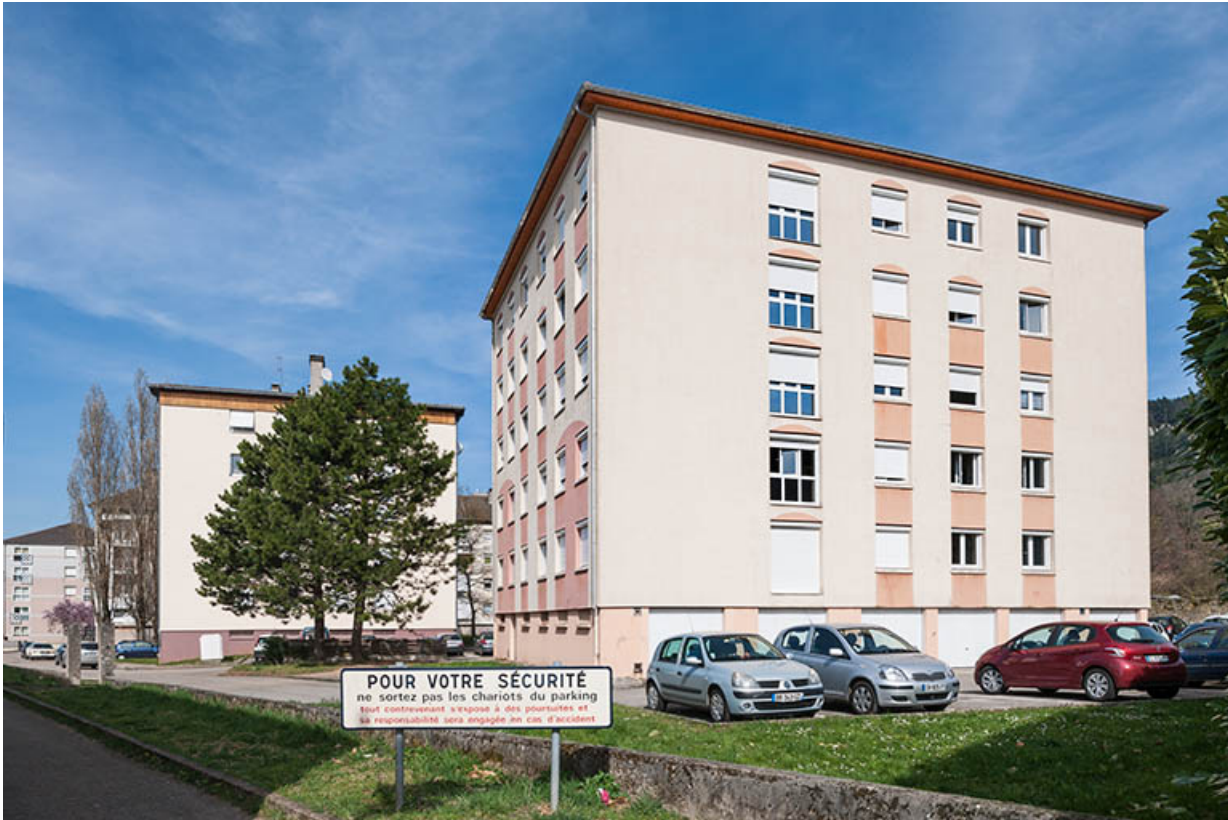
Angle sud-ouest du bâtiment des pinsons.