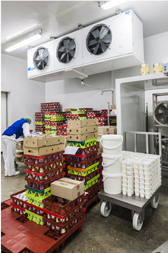
Détail de conditionnement.