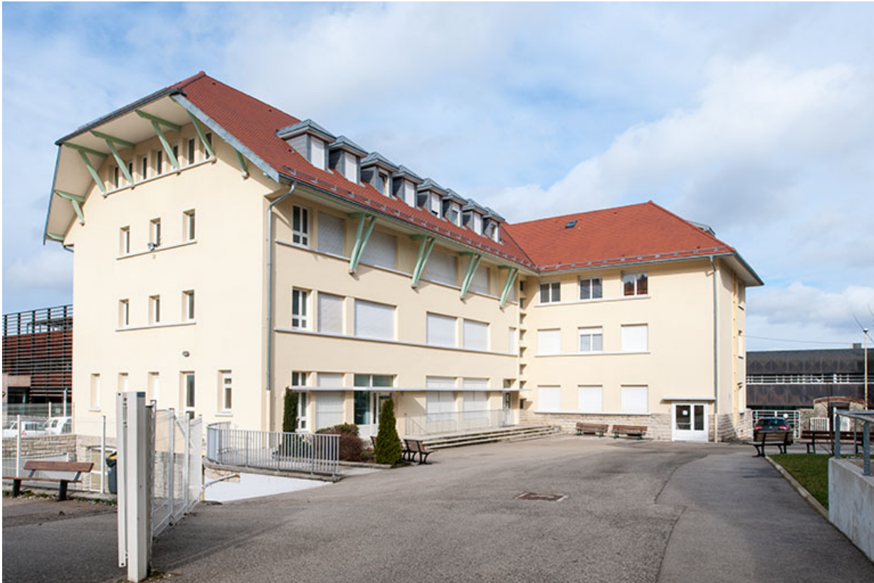
Pignon sud et façades sud et est de l'internat.