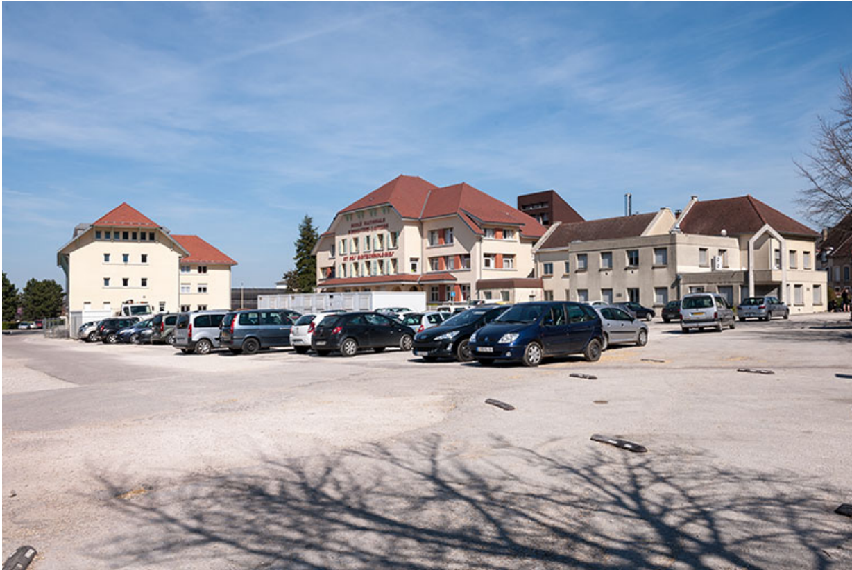
Depuis le champ de foire, les préfabriqués, l'école et son internat.