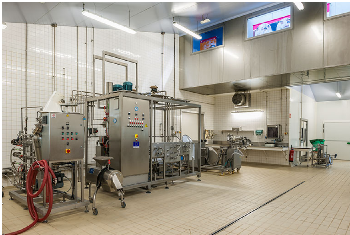
Salle de production des produits frais.