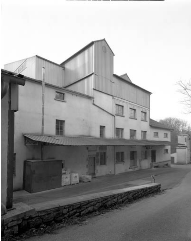
Ateliers de fabrication et magasin industriel.