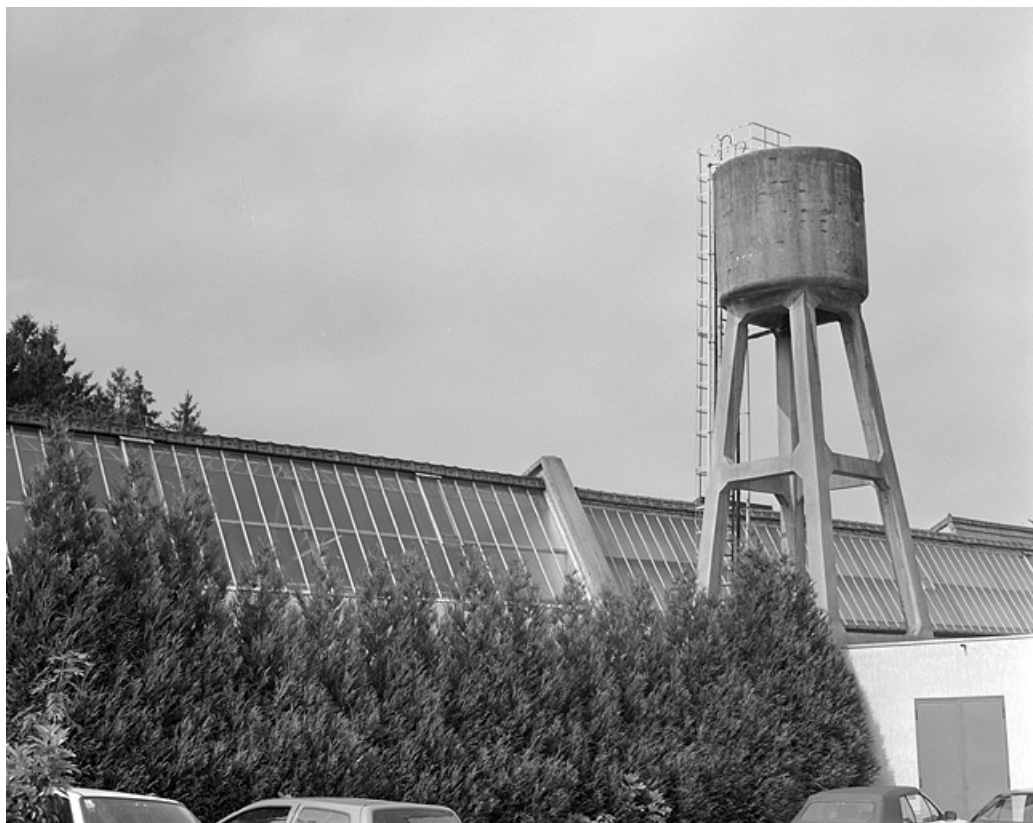
Atelier de fabrication et réservoir industriel.

39, Lons-le-Saunier, 2 rue des Mouillères