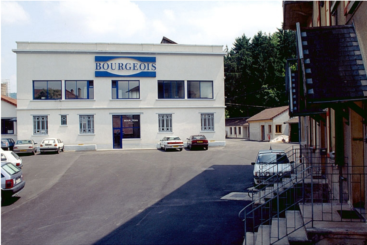
Vue d'ensemble depuis l'entrée : la façade du bureau.

39, Lons-le-Saunier, 2 rue des Mouillères