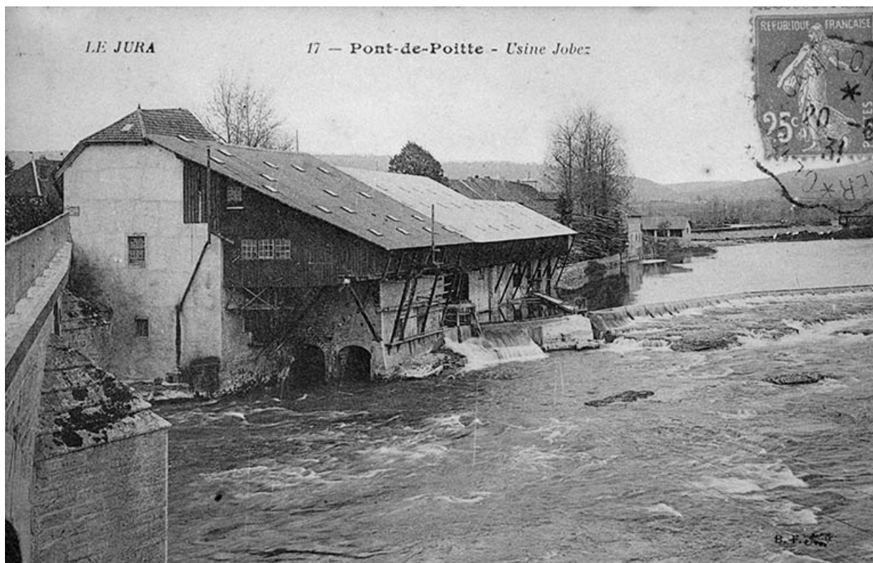
Pont-de-Poitte - Usine Jobez.

39, Pont-de-Poitte Grande Rue 1, 3, 4, 6