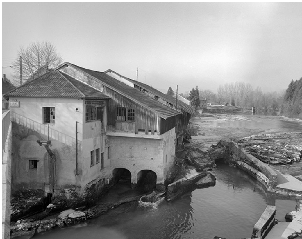
Atelier de fabrication et bâtiment d'eau depuis l'est.

39, Pont-de-Poitte Grande Rue 1, 3, 4, 6