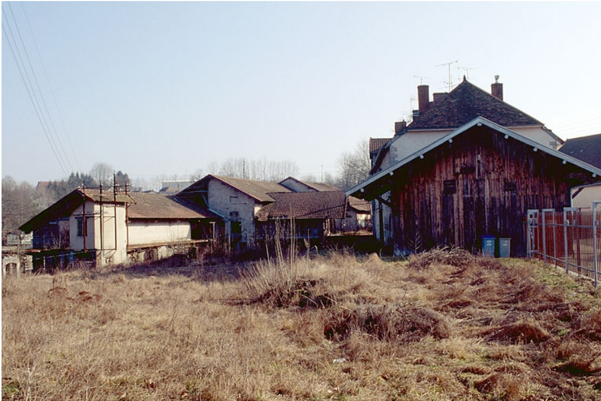
De gauche à droite : transformateur, atelier de fabrication, logement et remise à automobile. Au premier plan, aire des produits manufacturés.

39, Pont-de-Poitte Grande Rue 1, 3, 4, 6