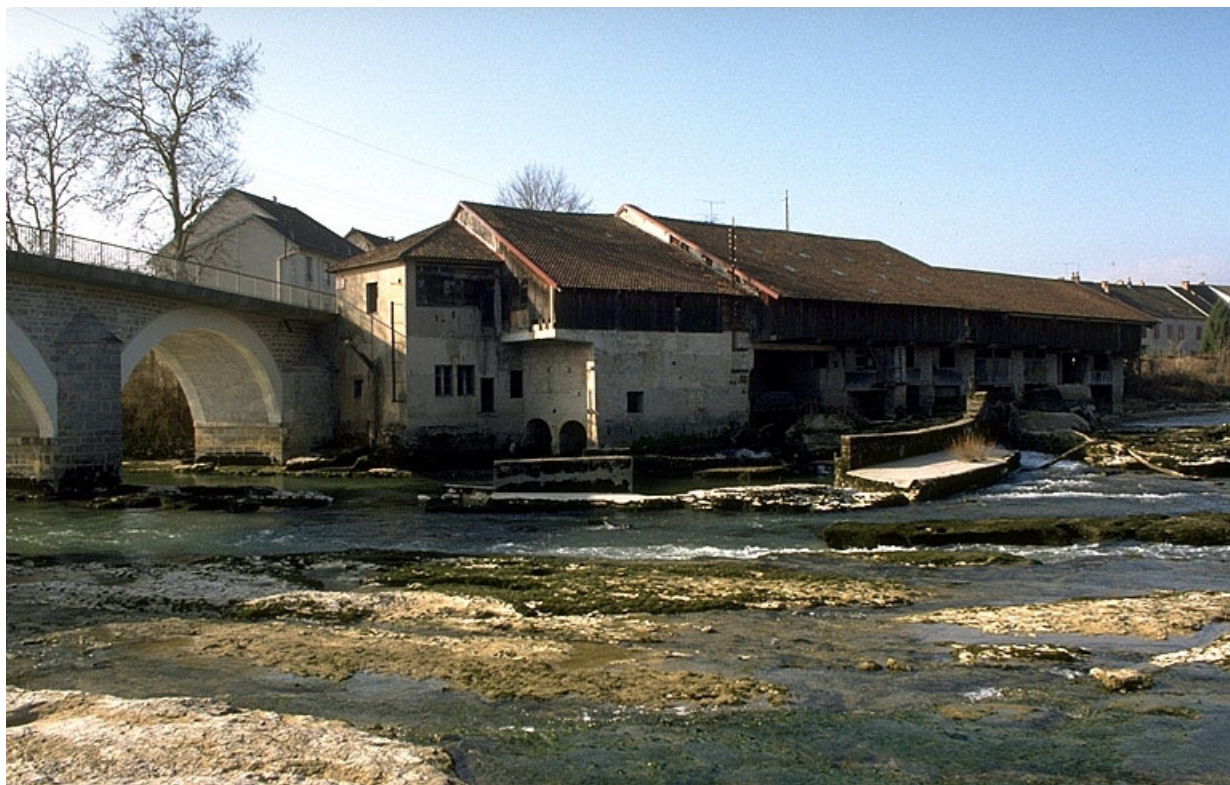
Vue d'ensemble depuis l'est.

39, Pont-de-Poitte Grande Rue 1, 3, 4, 6