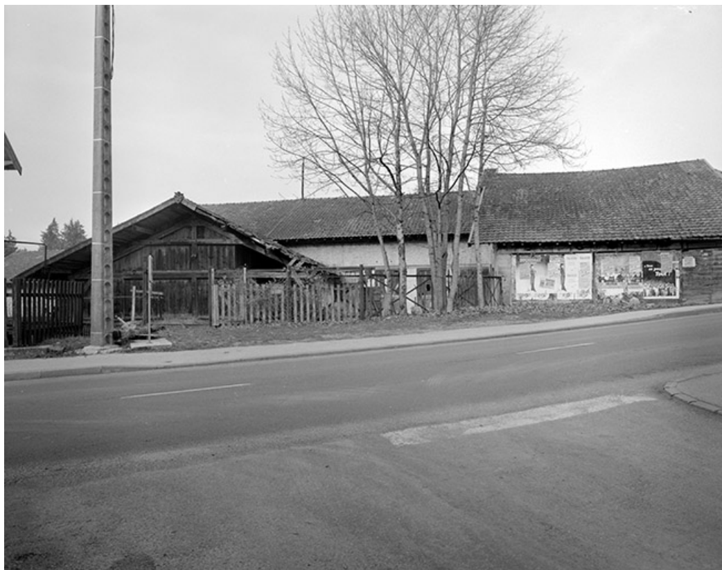
Atelier de fabrication depuis le sud.

39, Pont-de-Poitte Grande Rue 1, 3, 4, 6