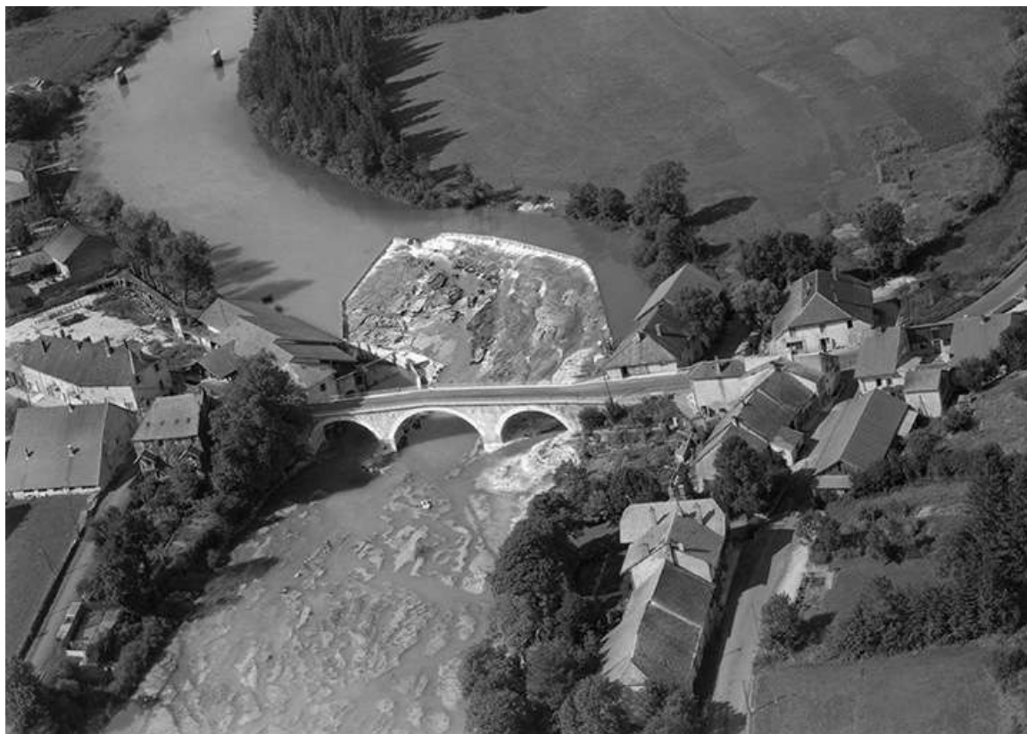
Vue de situation en 1956.

39, Pont-de-Poitte Grande Rue 1, 3, 4, 6