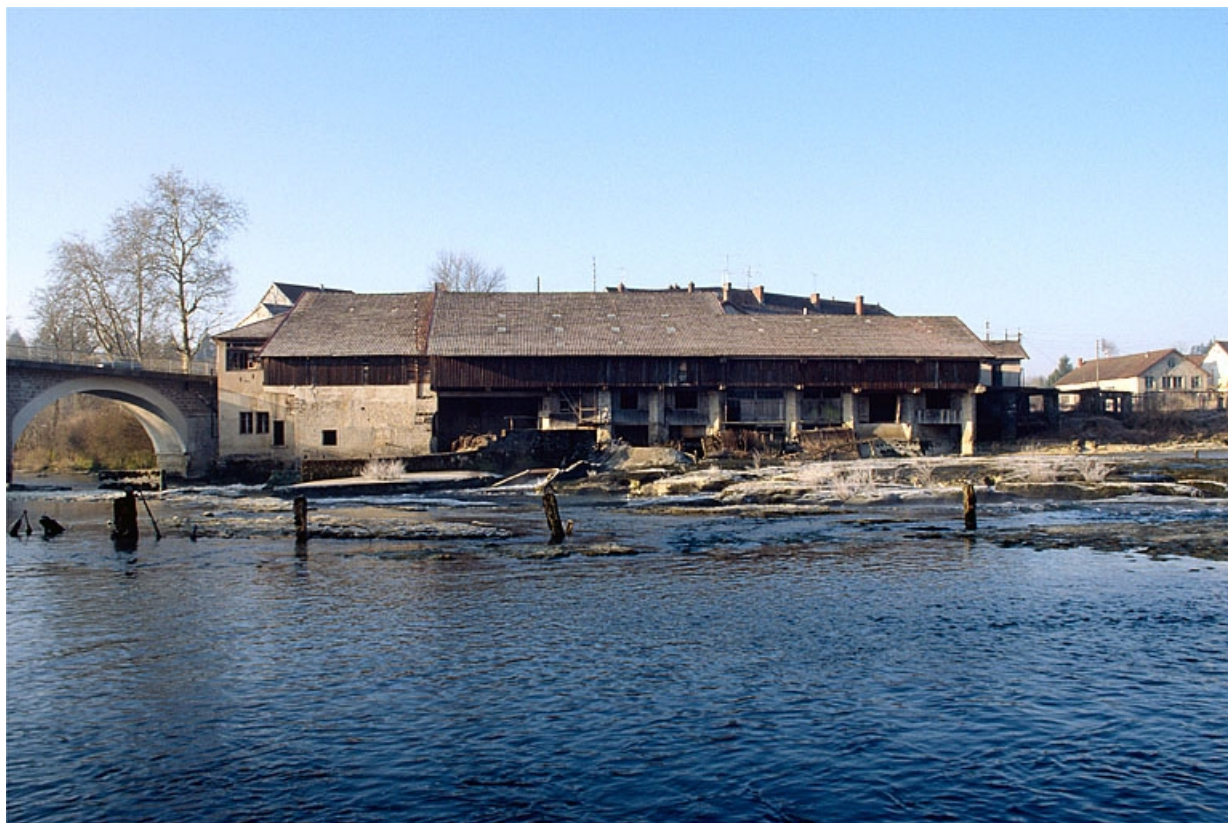
Façade de l'atelier de fabrication sur la rivière de l'Ain.

39, Pont-de-Poitte Grande Rue 1, 3, 4, 6