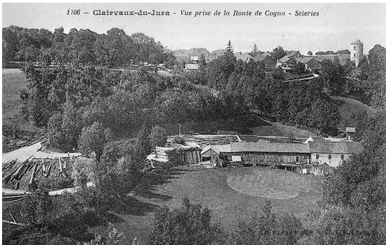
Clairvaux-du-Jura - Vue prise de la route de Cogna - Scieries.

39, Clairvaux-les-Lacs, lieudit : sous le Château