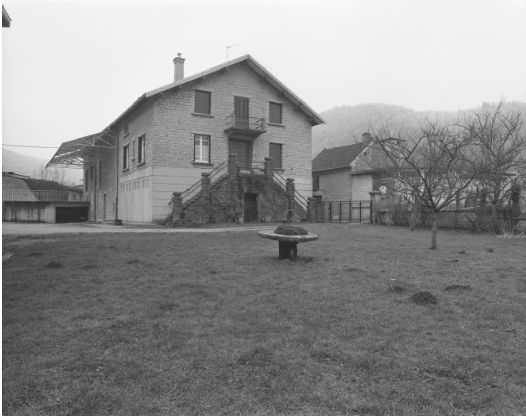
Pignon nord. A droite : four et entrepôt industriel.