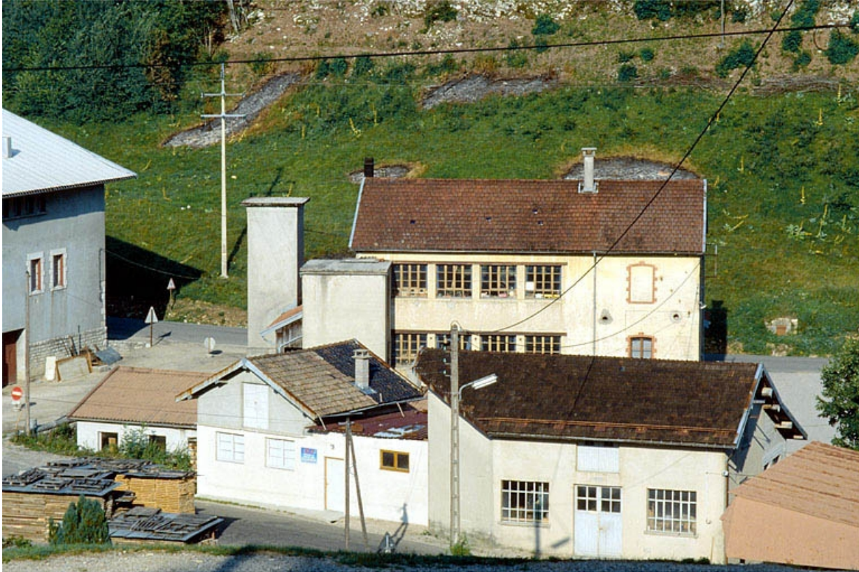
Façade postérieure vue de trois quarts droite.