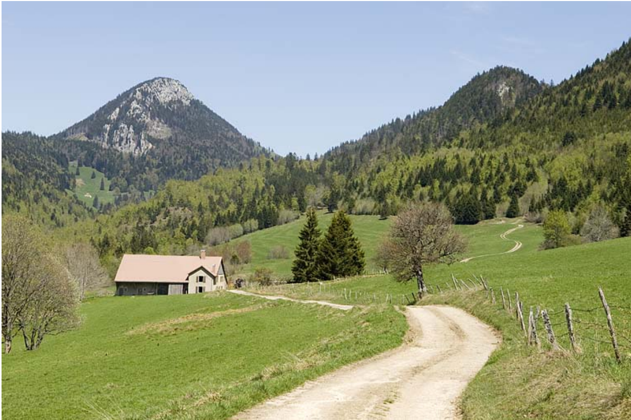
Vue d'ensemble depuis le sud-ouest. 25, Jougne