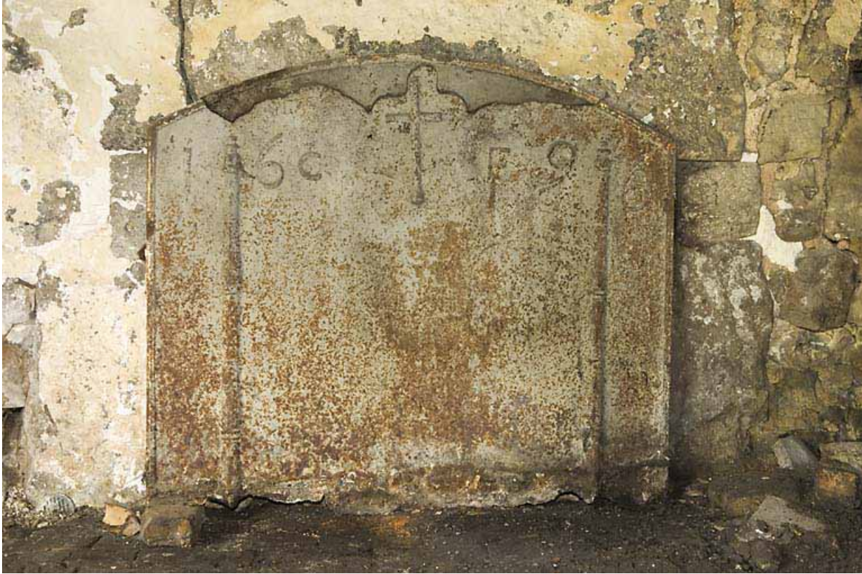
Plaque de cheminée portant la date 1696.