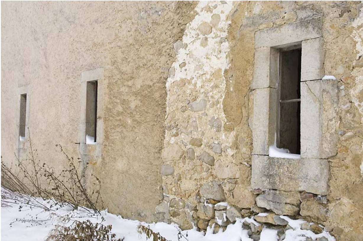
Façade latérale gauche : baies fromagères. 25, Jougne, lieudit : Palzard