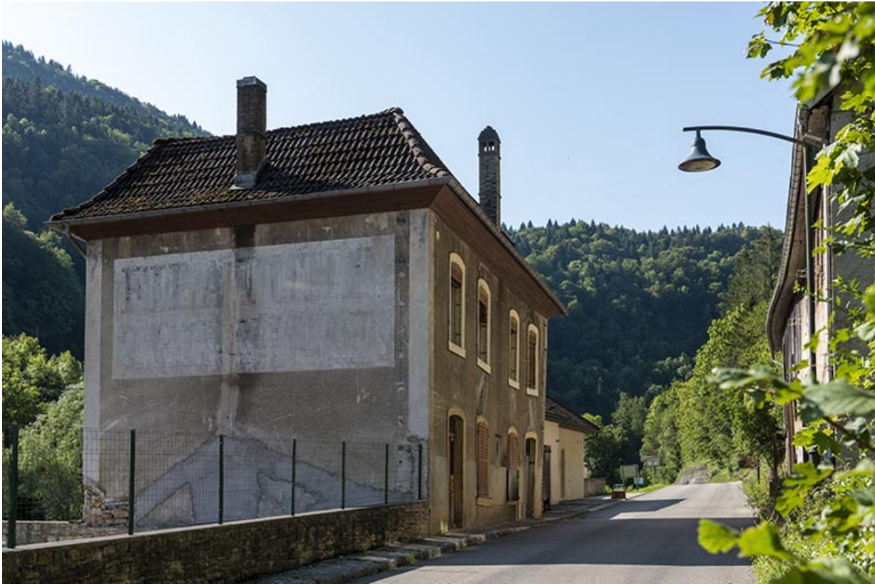
Logement, de trois quarts gauche (élévations antérieure et latérale gauche). 25, Saint-Hippolyte rue du Dessoubre