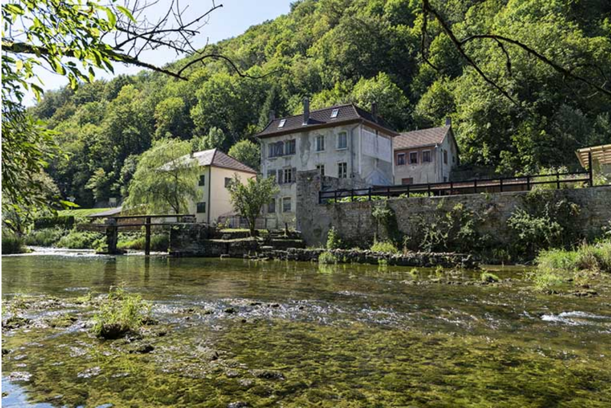
Vue d'ensemble, depuis la rive droite du Dessoubre (au nord-est). 25, Saint-Hippolyte rue du Dessoubre