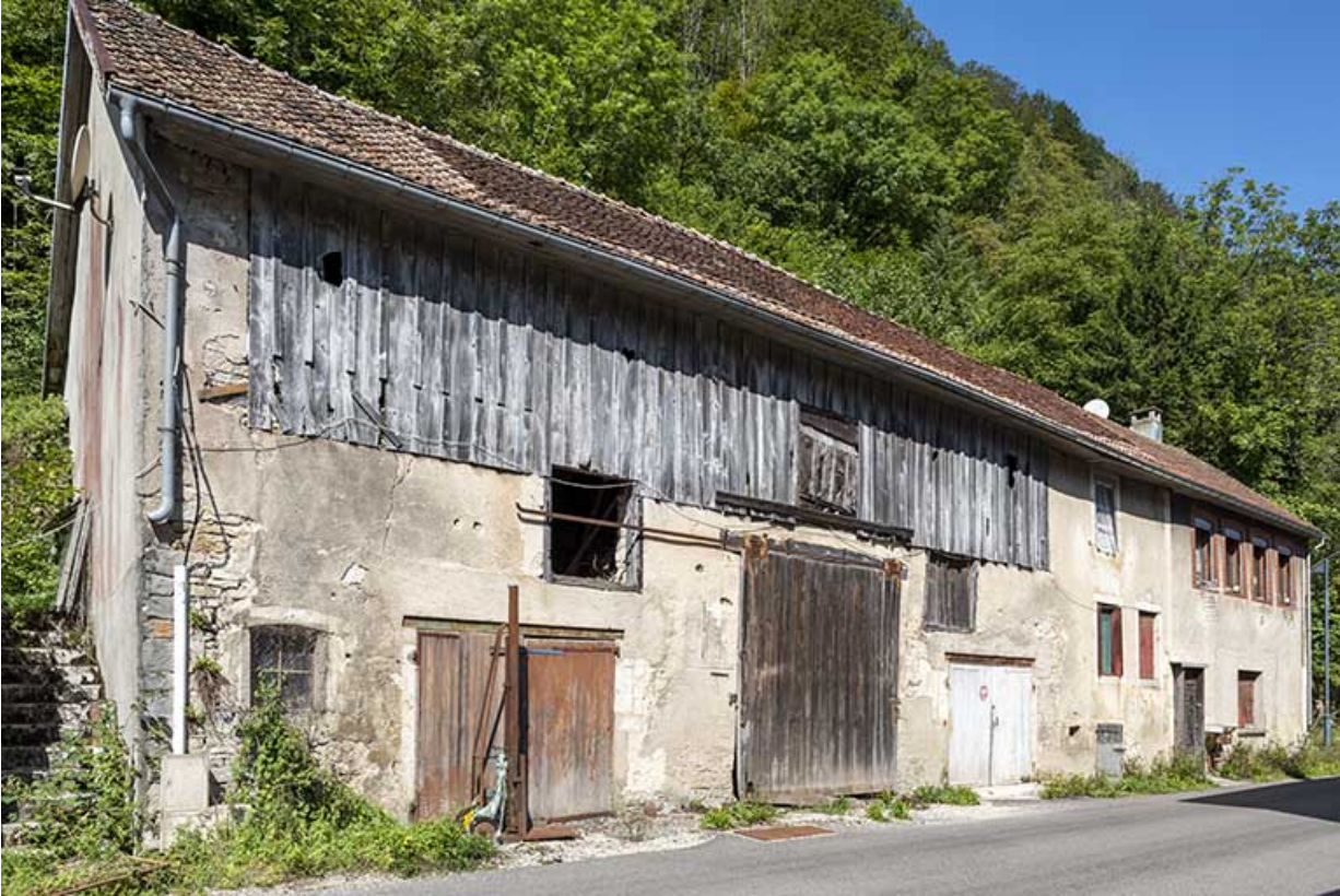
Logement occidental : façade antérieure, de trois quarts gauche.