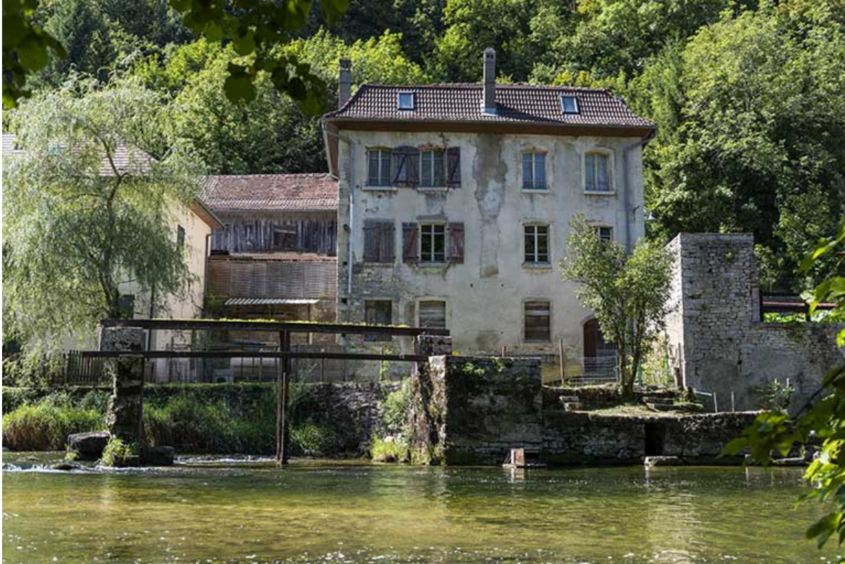
Vestiges de l'usine (avec vannage) et façade postérieure du logement. 25, Saint-Hippolyte rue du Dessoubre