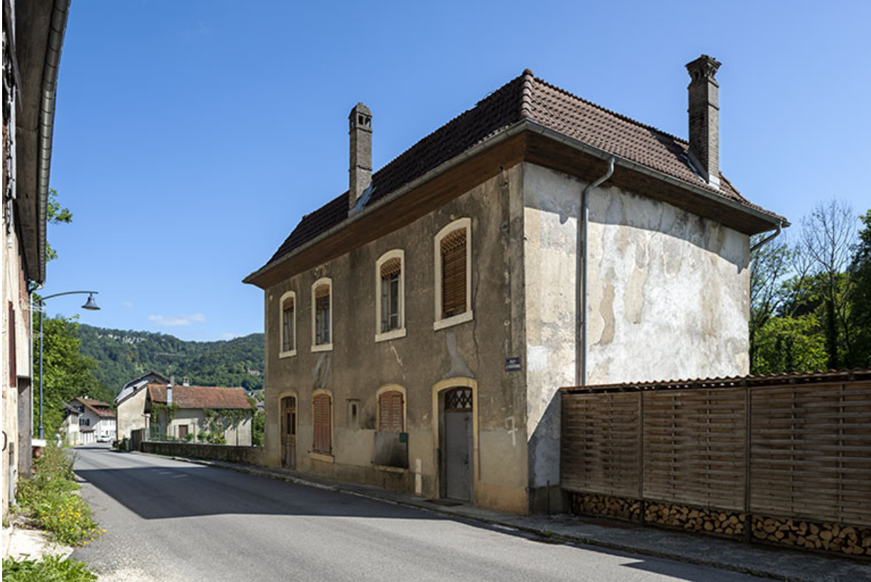
Logement, de trois quarts droite (élévations antérieure et latérale droite). 25, Saint-Hippolyte rue du Dessoubre