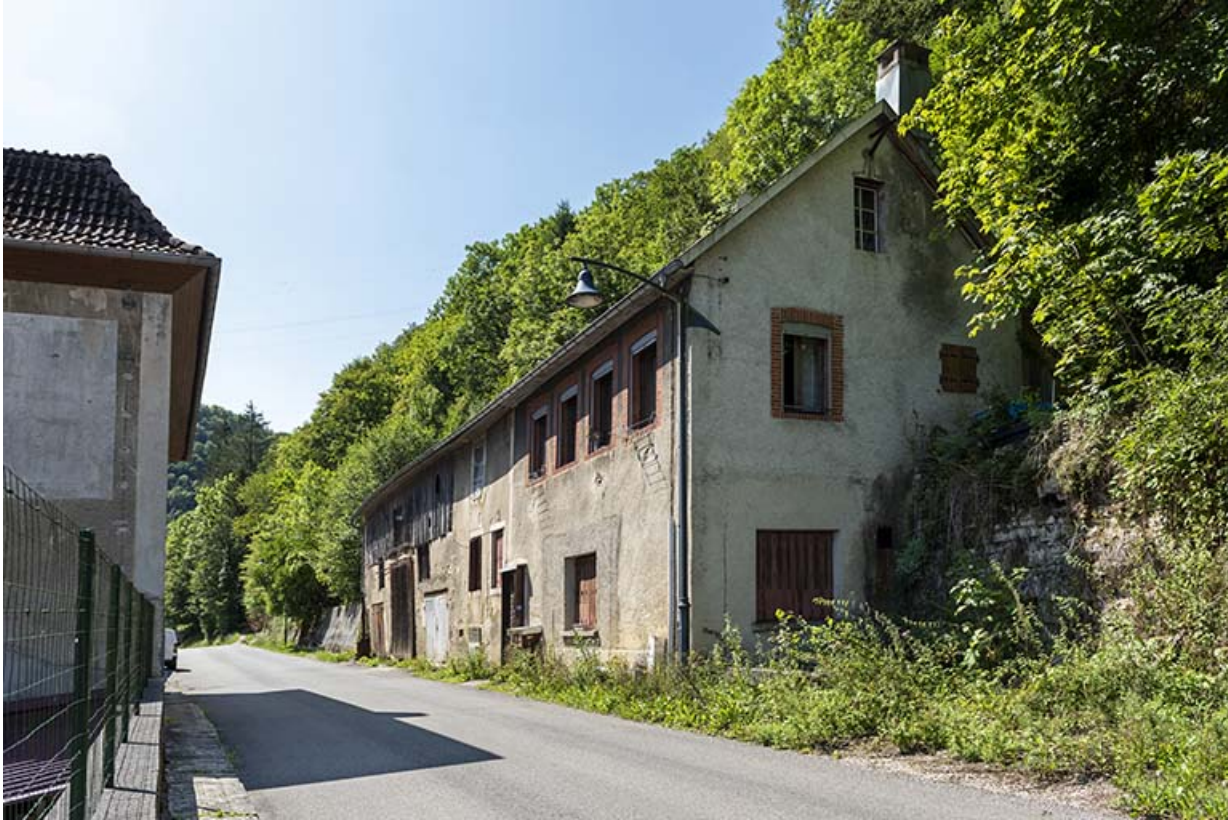
Logement occidental : vue d'ensemble, depuis le nord.