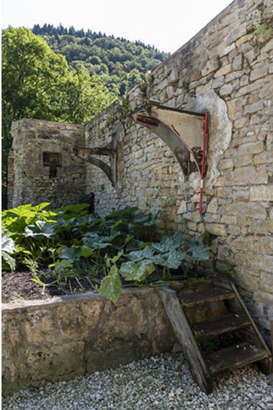
Vestiges de l'usine : supports de transmission.