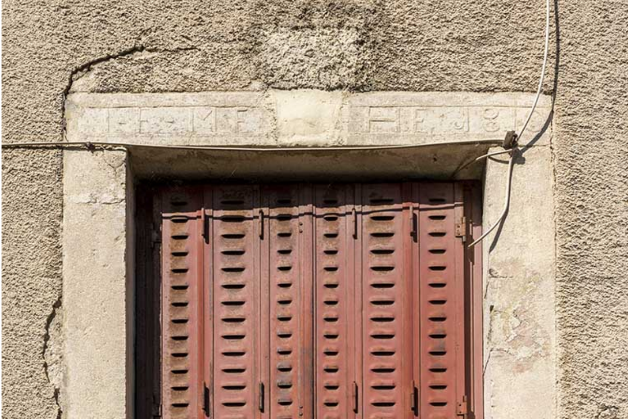
Logement occidental, façade antérieure : linteau daté.