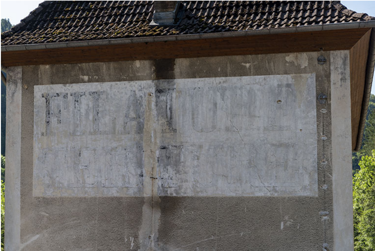
Logement, élévation latérale gauche : inscription peinte (filature teinturerie). 25, Saint-Hippolyte rue du Dessoubre