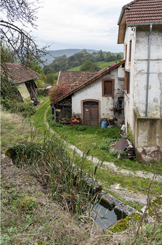
Bâtiment d'eau, vu de l'est.