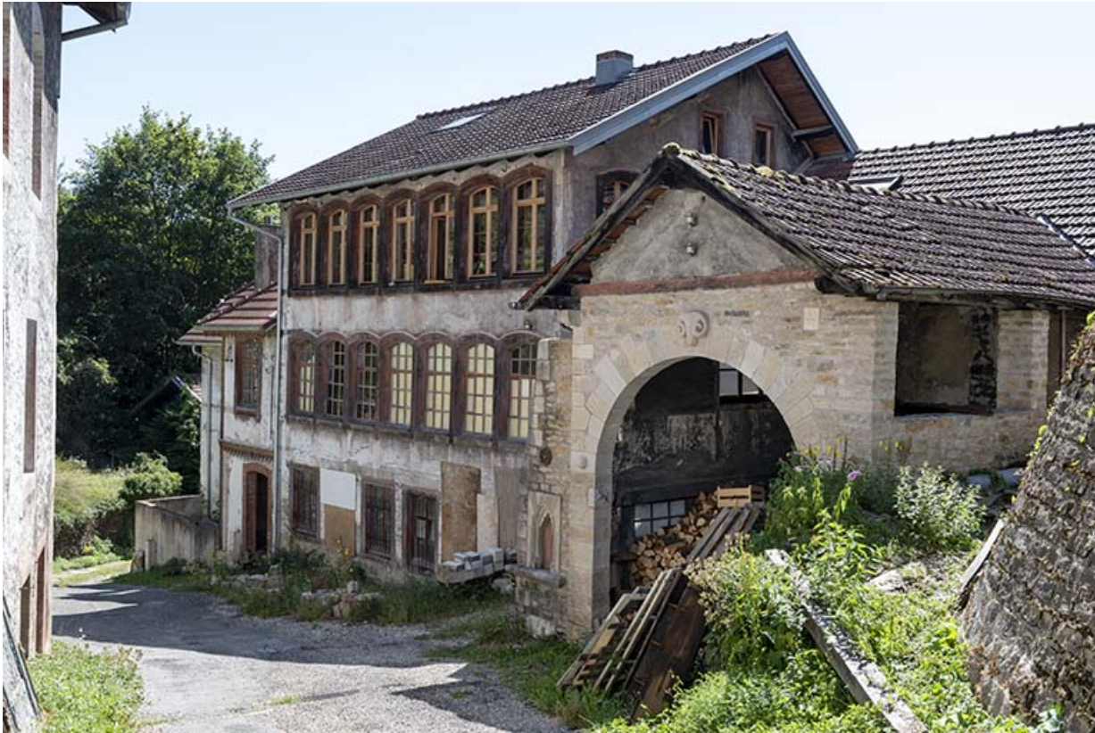
Usine (2e corps de bâtiment) et hangar, vus du nord (façade antérieure). 25, Liebvillers, 2-4 impasse du Moulin