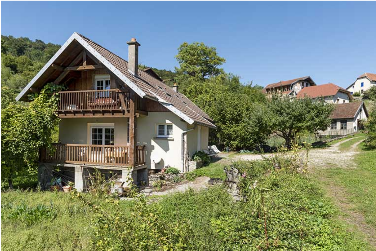
Atelier de polissage, depuis le sud.