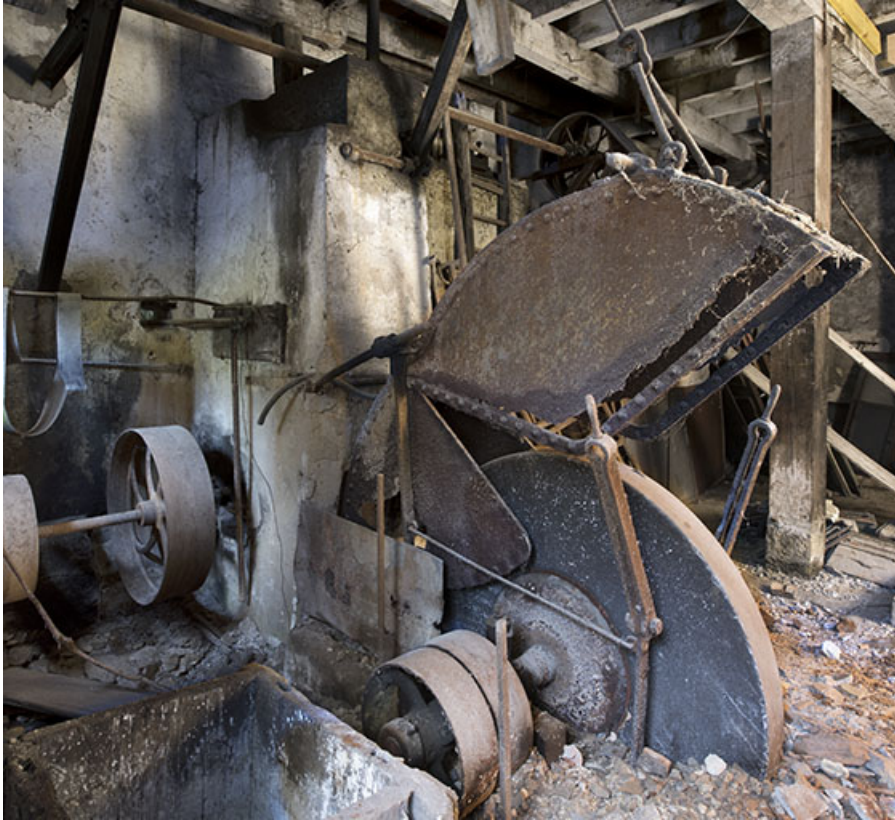
Usine : meule à l'étage de soubassement du 3e corps de bâtiment. 25, Liebvillers, 2-4 impasse du Moulin