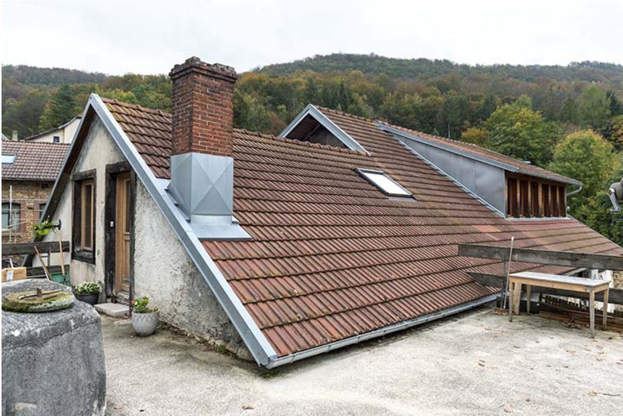
Usine : 1er corps de bâtiment, vu de l'ouest.