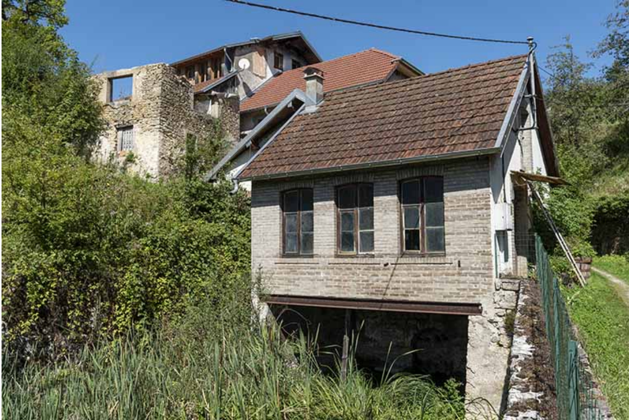
Bâtiment d'eau, vu du sud. A gauche, le bâtiment en ruine vu en contre-plongée.