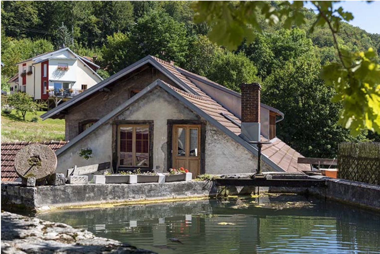
Usine : 1er corps de bâtiment, vu du nord-ouest.