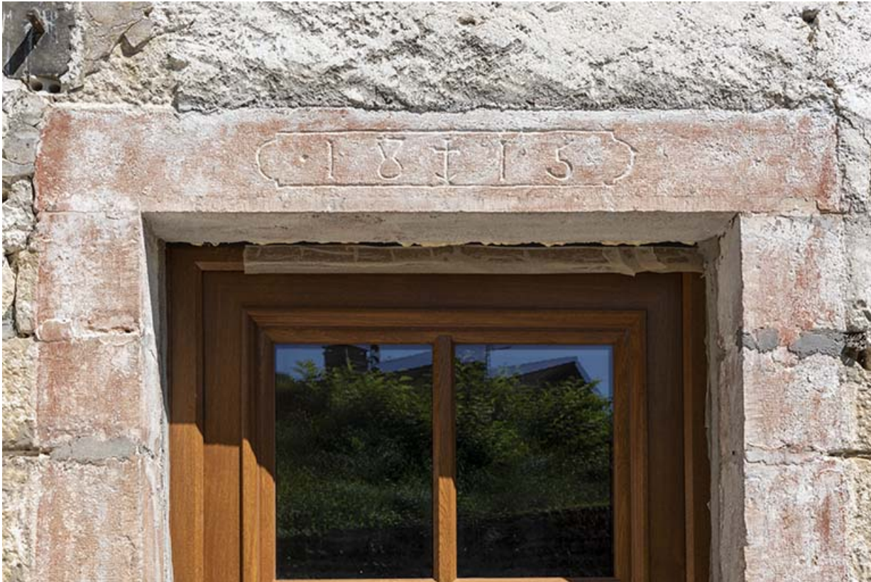
Bâtiment au n° 3 : linteau daté 1815.