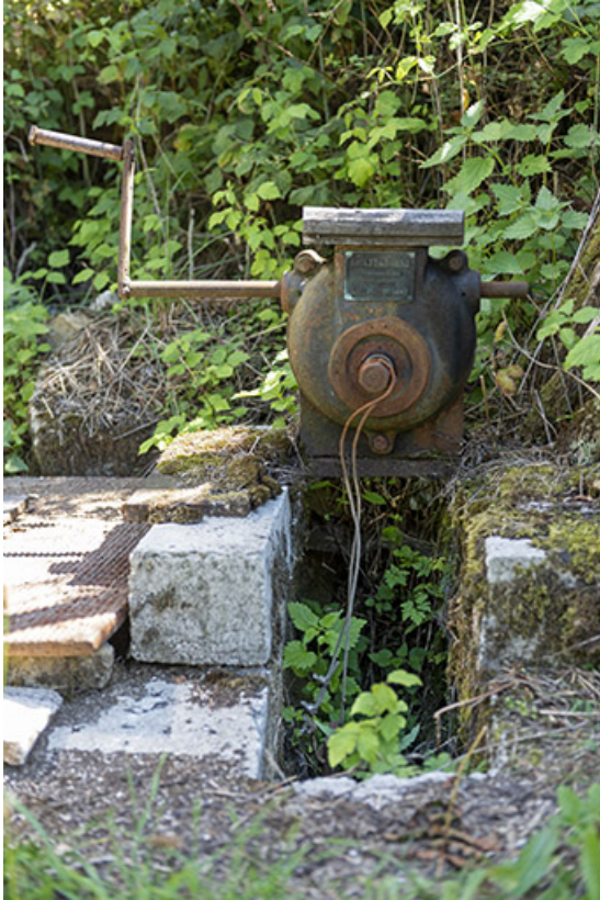
Commande de vanne près du hangar oriental.