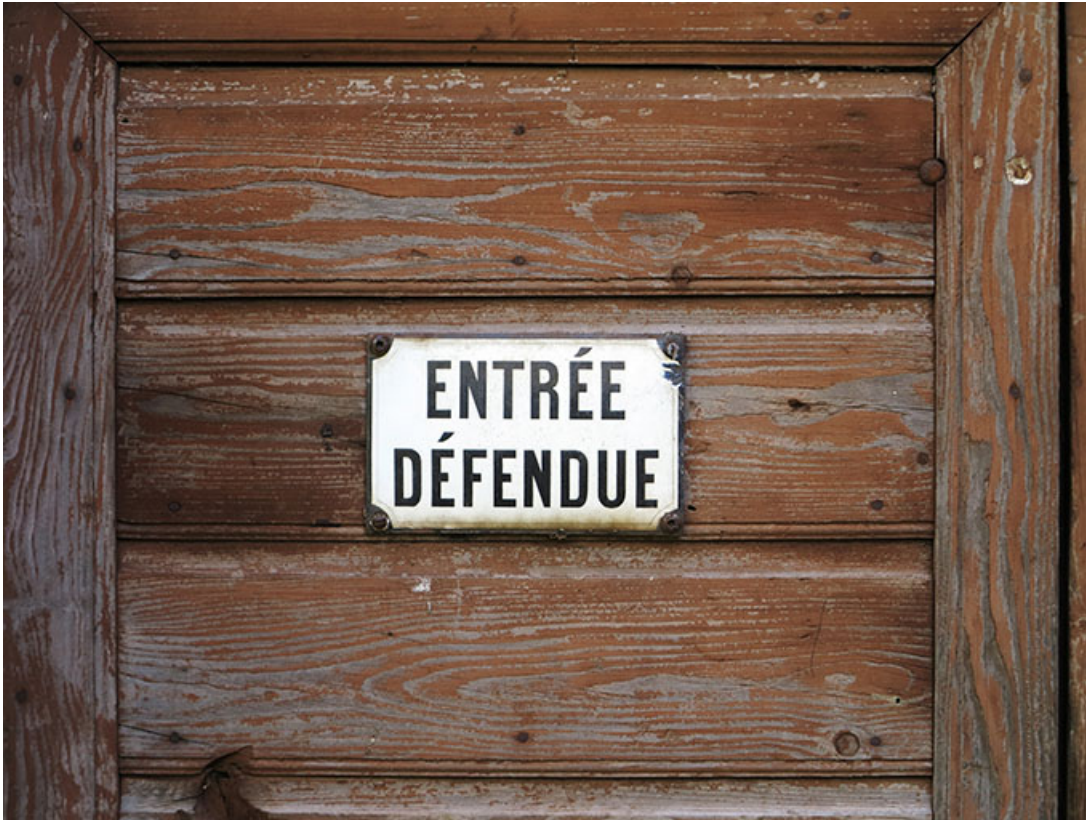
Bâtiment d'eau, façade antérieure : plaque émaillée sur la porte.