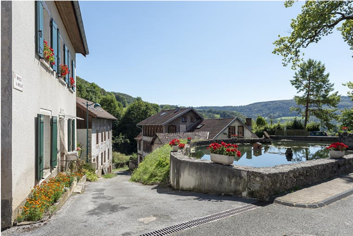
Vue d'ensemble, depuis le nord.