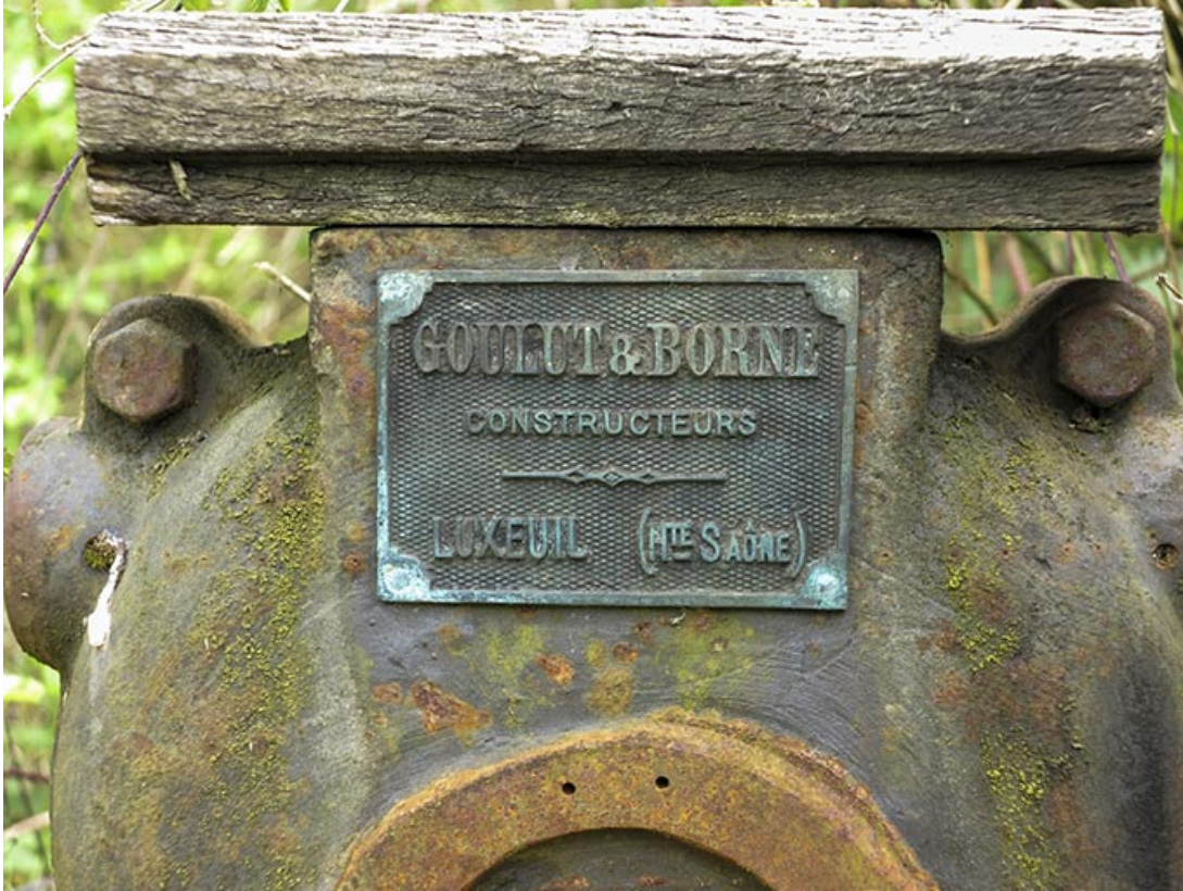
Commande de vanne : plaque du constructeur Goulut & Borne.