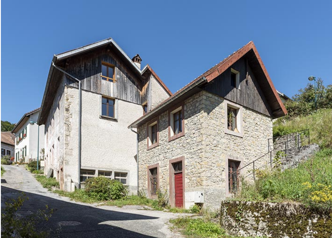
Bâtiment au n° 3 et atelier, vus du sud-est.