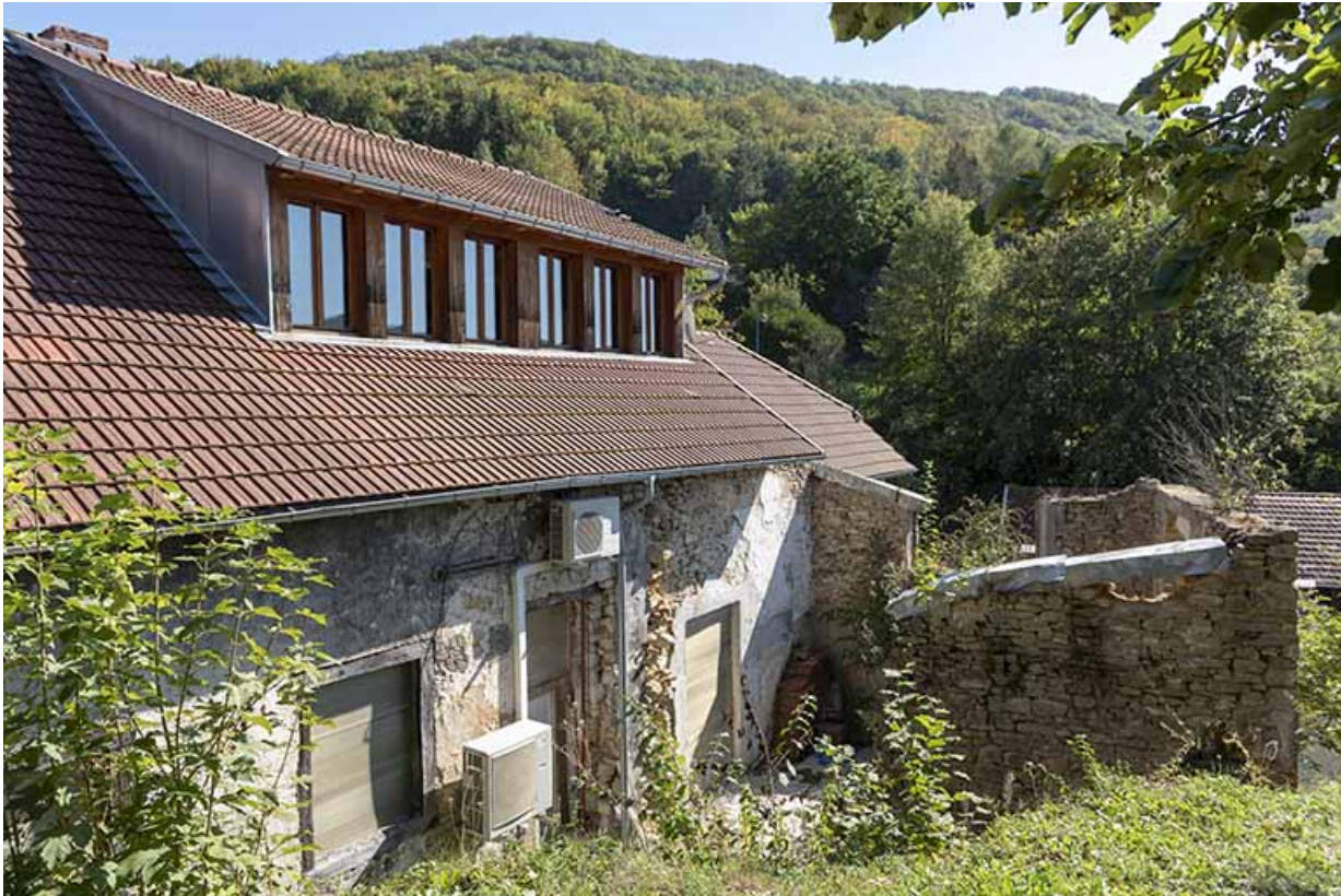
Usine : 2e corps de bâtiment, vu de l'ouest (façade postérieure).