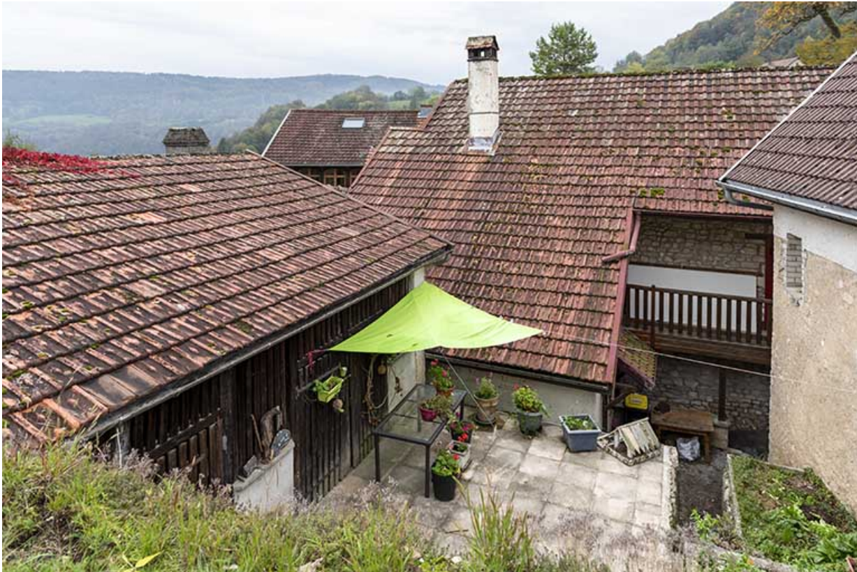
Bâtiment au n° 3 et bûcher, vus de l'est.