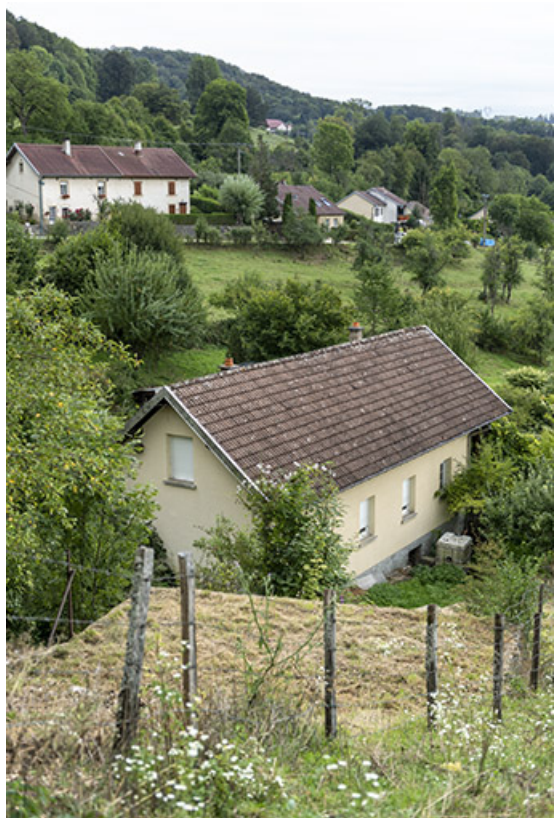
Atelier de polissage, depuis le nord-ouest.