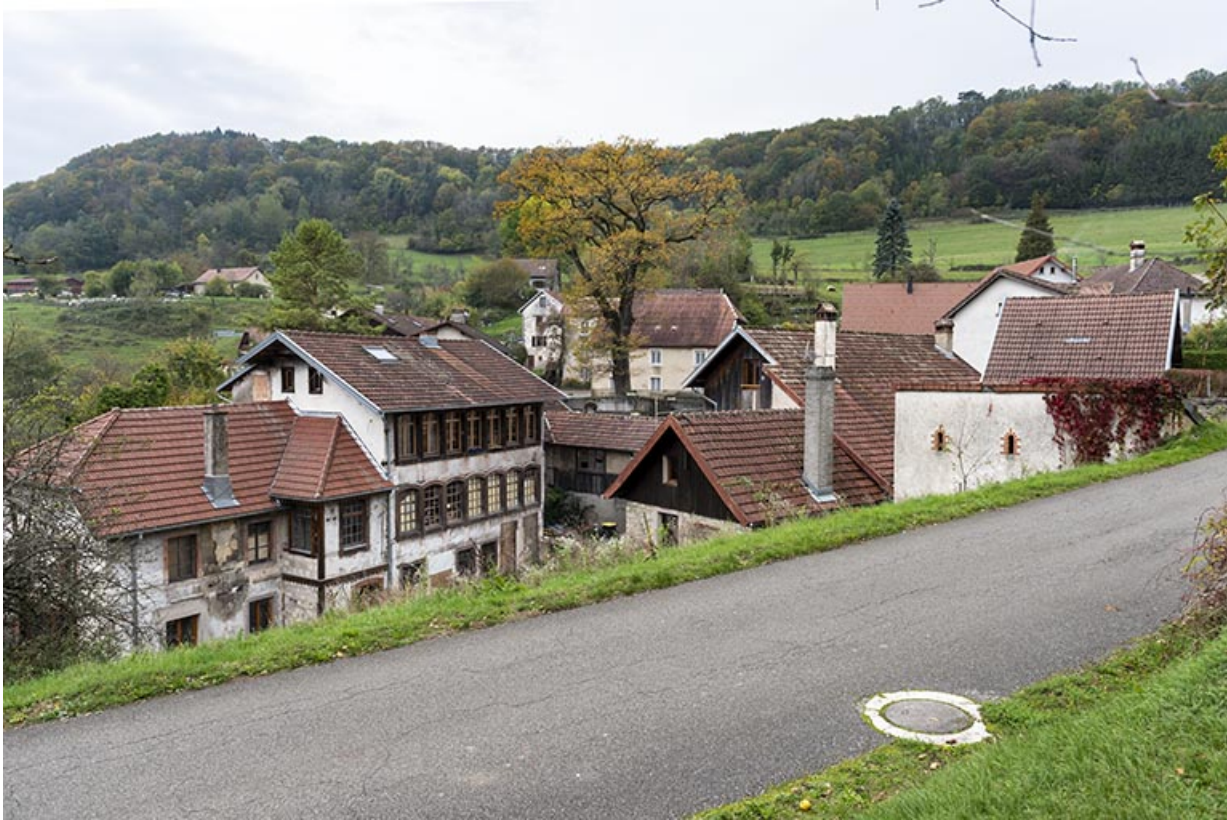
Vue d'ensemble, depuis l'est.