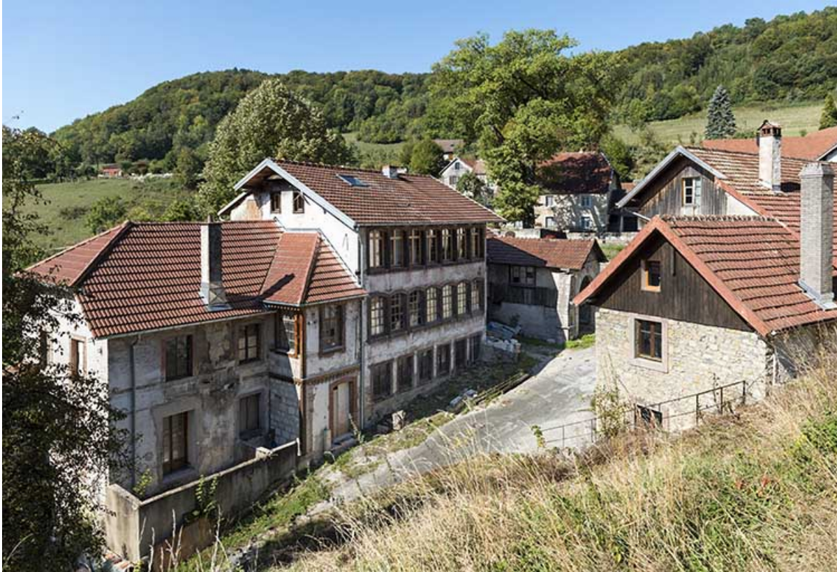
Usine : 2e et 3e corps de bâtiment, vus de l'est (façade antérieure). 25, Liebvillers, 2-4 impasse du Moulin