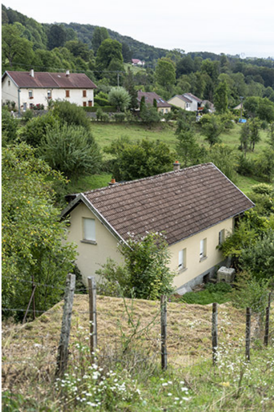
Atelier de polissage, depuis le nord-ouest.