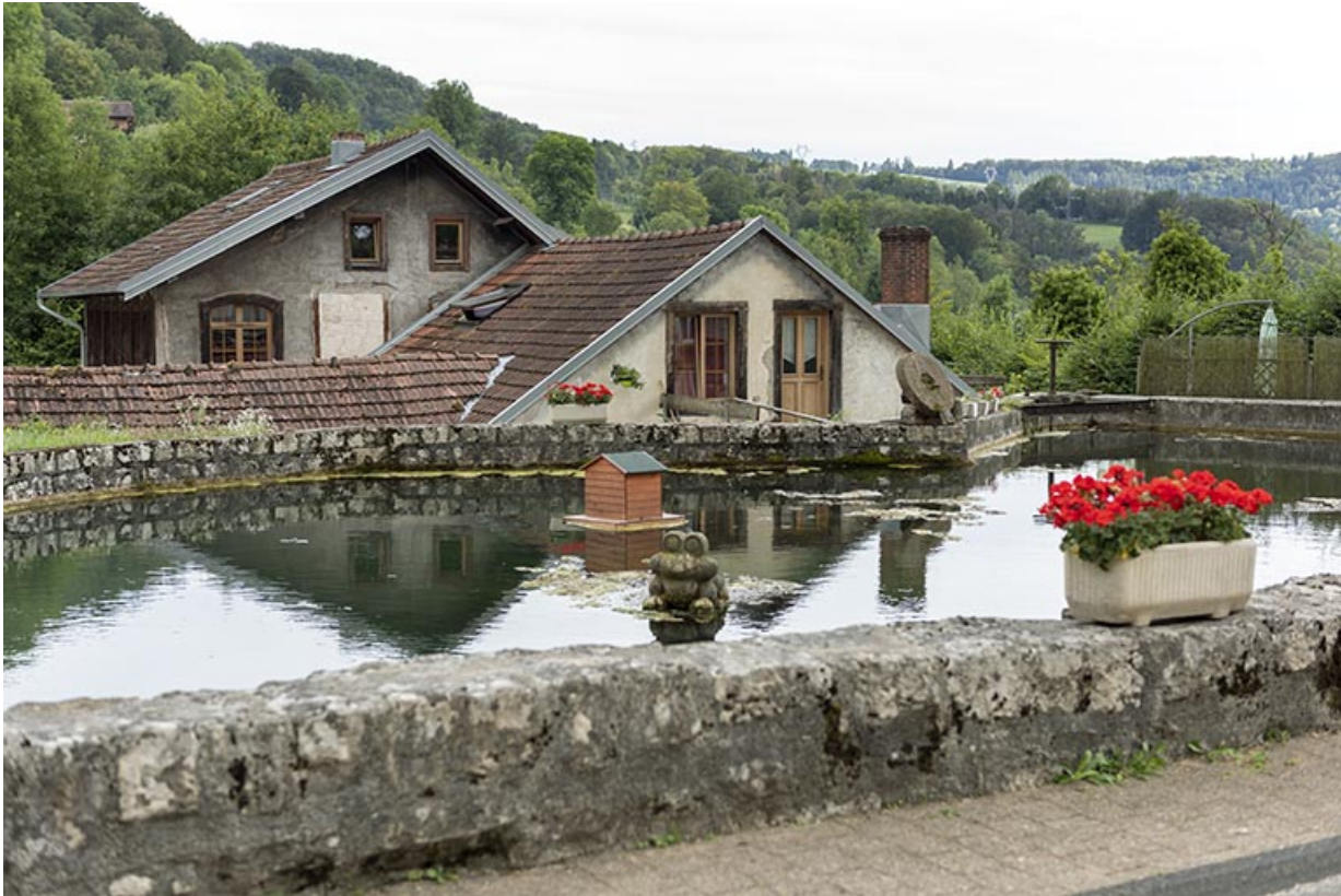
Usine et bassin de retenue, vus du nord.