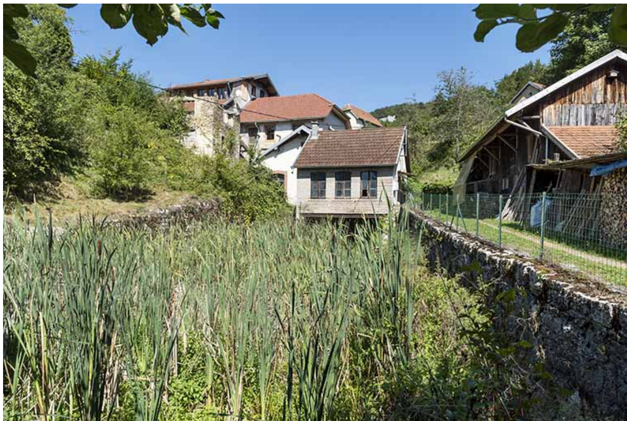
Vue d'ensemble, depuis le sud.