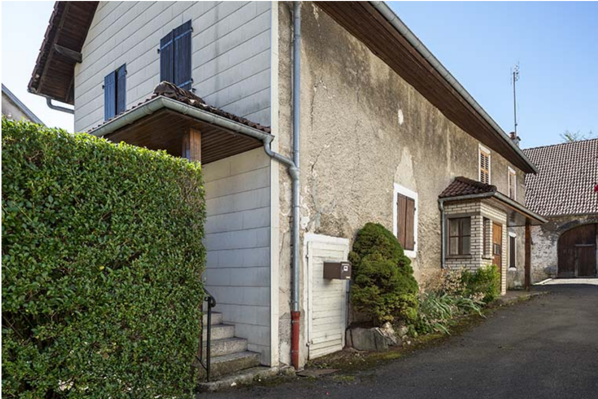
Maison de 1836 ayant abrité le café-restaurant : façades antérieure et latérale droite.