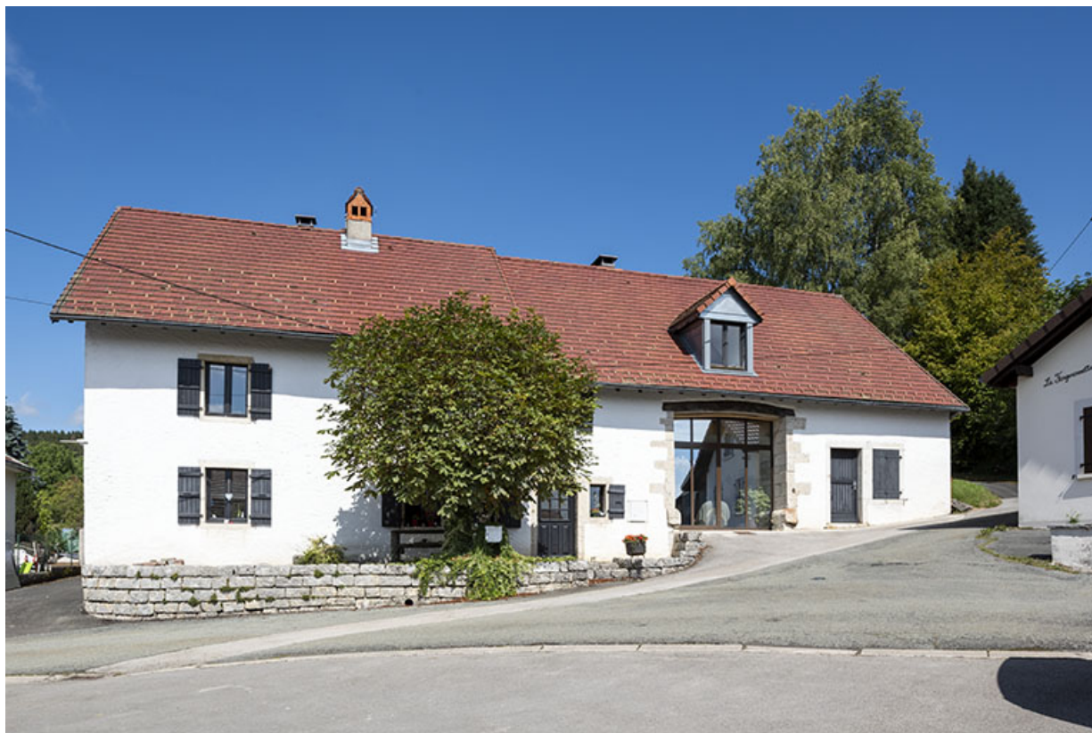
Ferme : façade antérieure.

25, Montécheroux, 13-15 rue de la Pommeraie