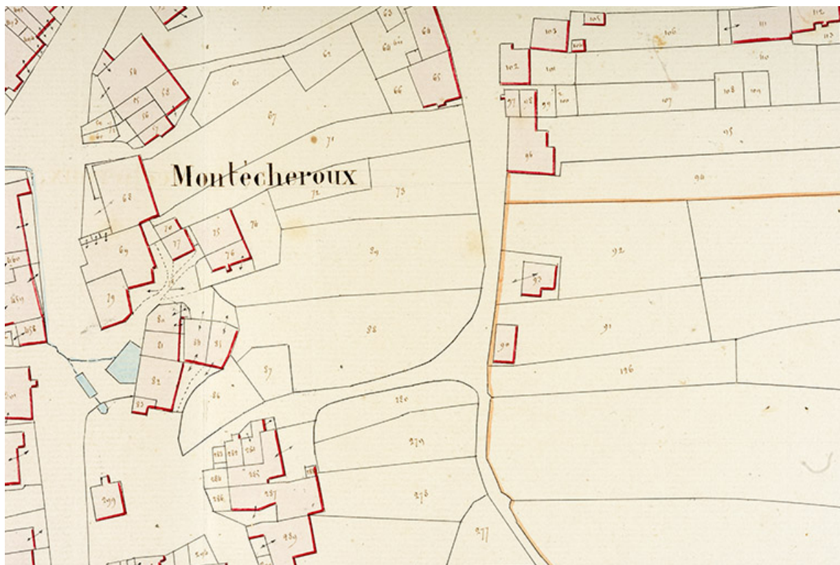
Cadastre de la commune de Montécheroux. Atlas parcellaire, 1830, section D en une feuille [détail : quartier de la rue de la Pommeraié], 1/1 250.