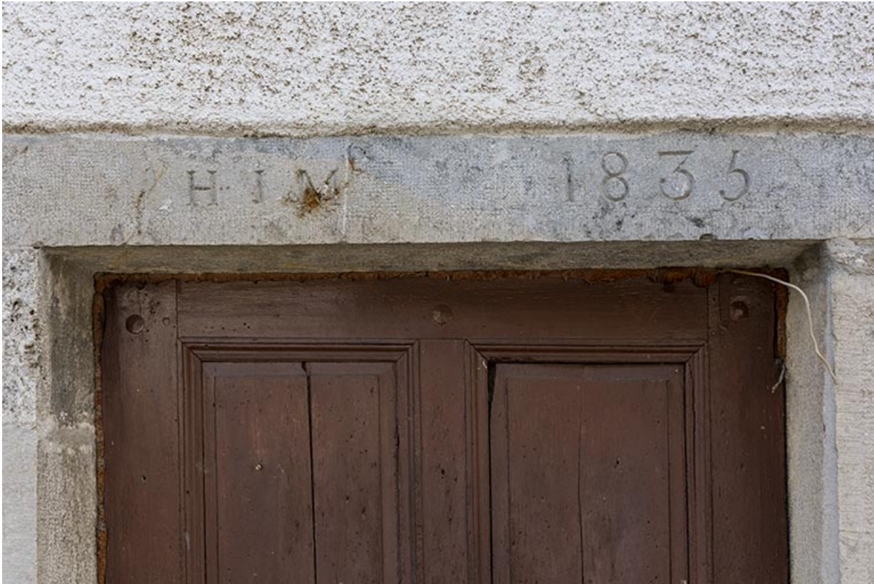
Cave d'affinage : linteau daté 1835, avec initiales.