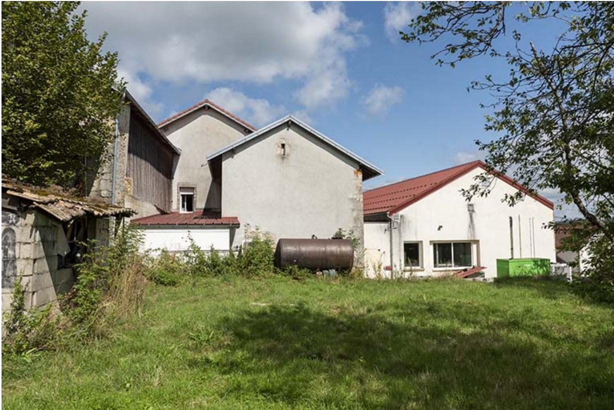
Ancienne maison, chaufferie et atelier de 2012 : façade postérieure.