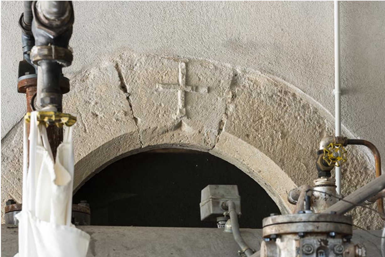
Ancienne maison : porte en plein cintre ornée d'une croix (au rez-de-chaussée). 25, Valoreille, 2 rue de l' Eglise