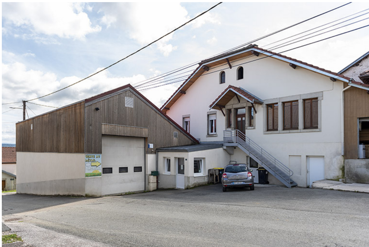
Garage, boutique et fromagerie.