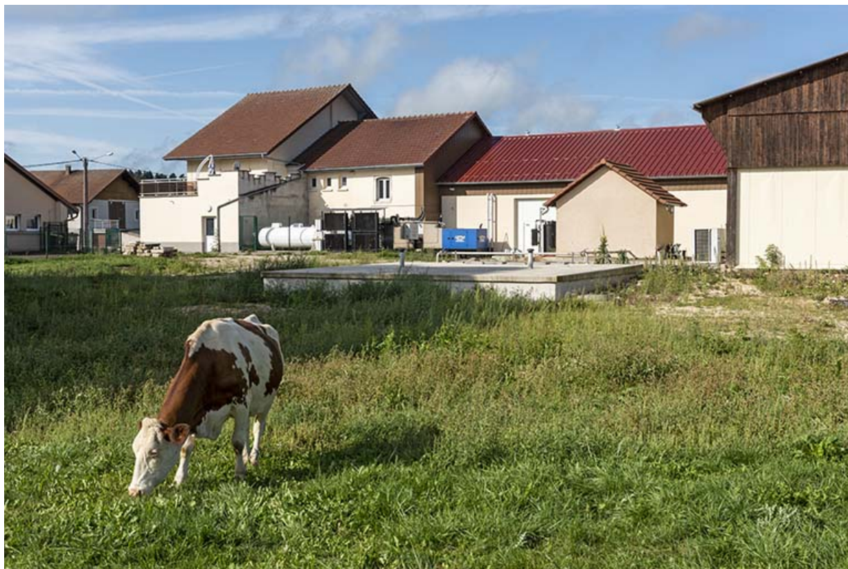
Bâtiment de 1820, extension de 1956, station d'épuration et cave d'affinage de 1991. 25, Les Plains-et-Grands-Essarts, 2 rue des Jonquilles