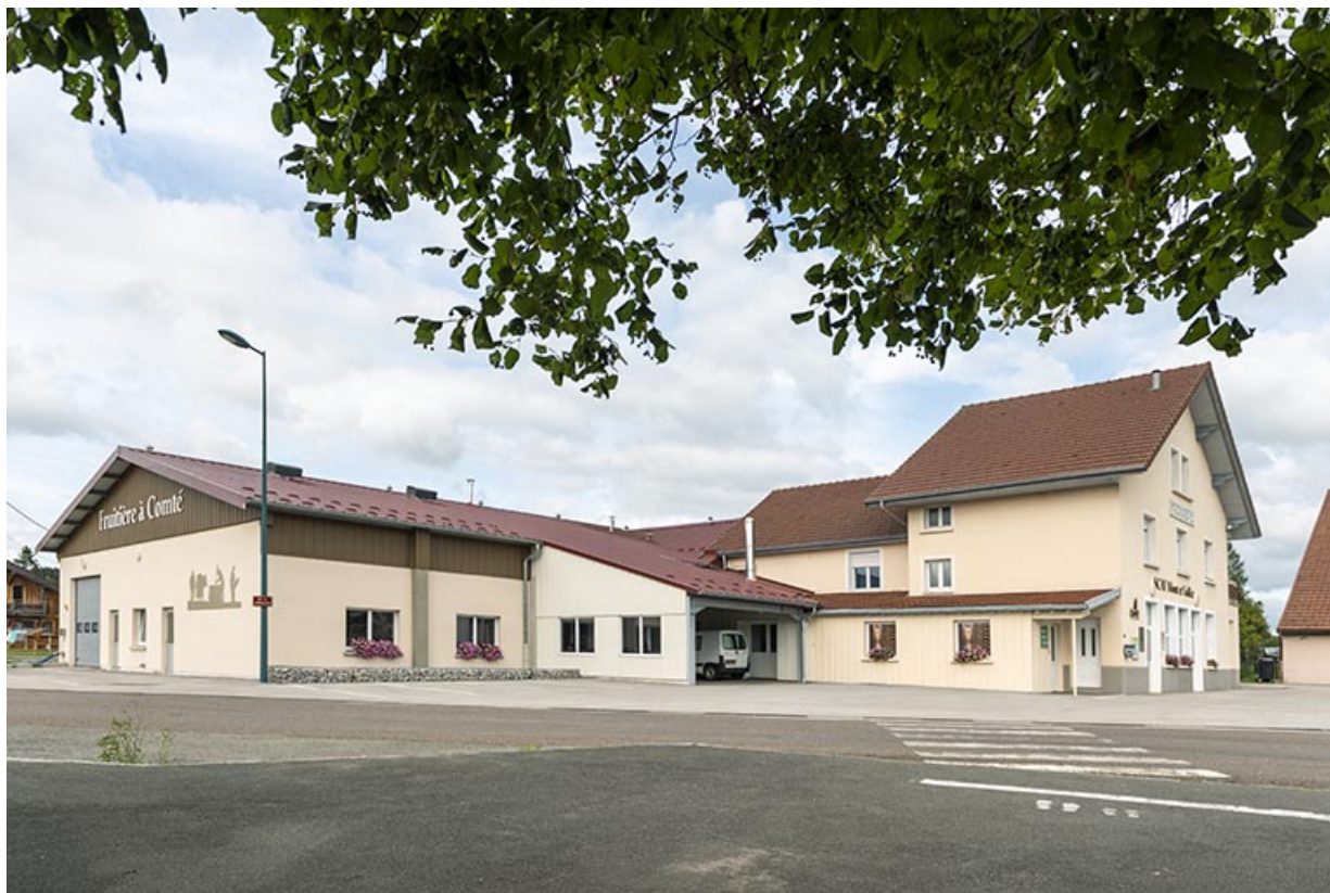
Atelier de 2016 et bâtiment de 1820, depuis le sud-ouest.

25, Les Plains-et-Grands-Essarts, 2 rue des Jonquilles