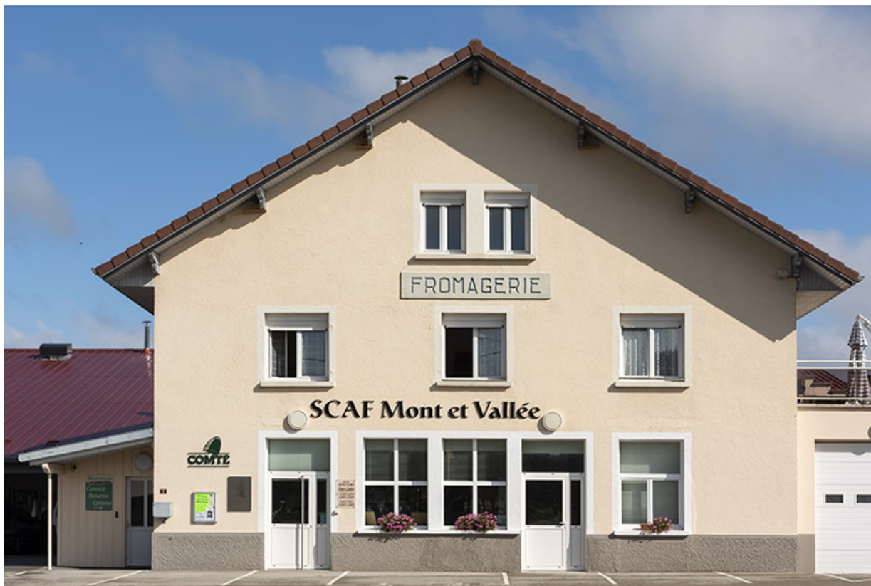
Bâtiment de 1820 : façade antérieure.

25, Les Plains-et-Grands-Essarts, 2 rue des Jonquilles