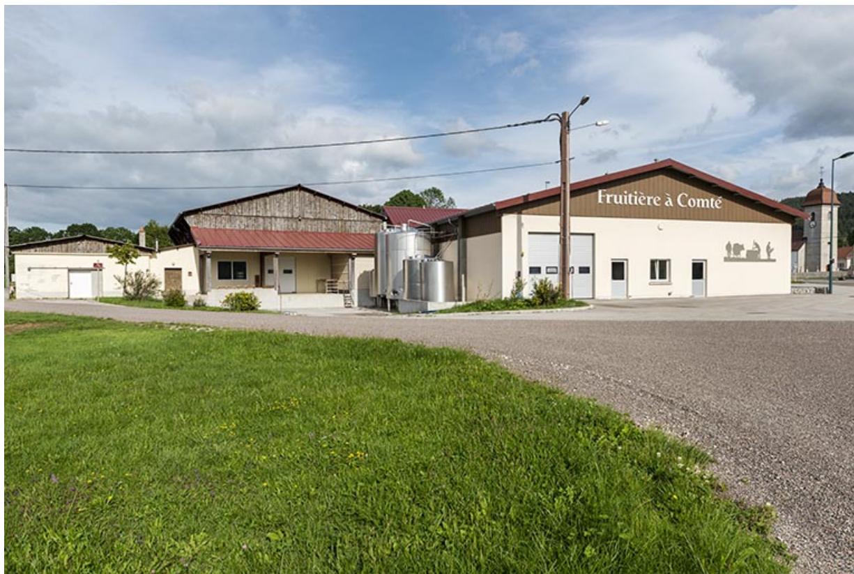
Caves d'affinage de 1970 et 1991 et atelier de 2016. 25, Les Plains-et-Grands-Essarts, 2 rue des Jonquilles