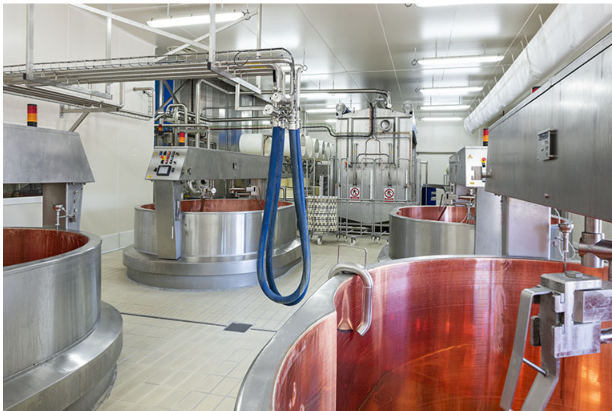
Intérieur de l'atelier de fabrication : cuves, avec l'installation de moulage en arrière-plan.

25, Les Plains-et-Grands-Essarts, 2 rue des Jonquilles