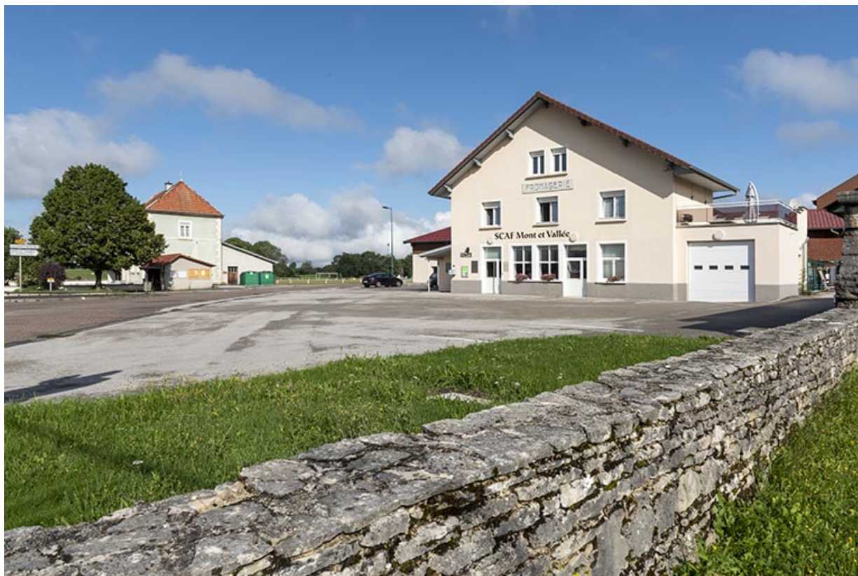
Vue d'ensemble, depuis le sud-est (bâtiment de 1820 et garage).

25, Les Plains-et-Grands-Essarts, 2 rue des Jonquilles