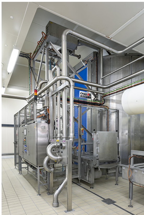
Tour de pressage : vue arrière.

25, Les Plains-et-Grands-Essarts, 2 rue des Jonquilles