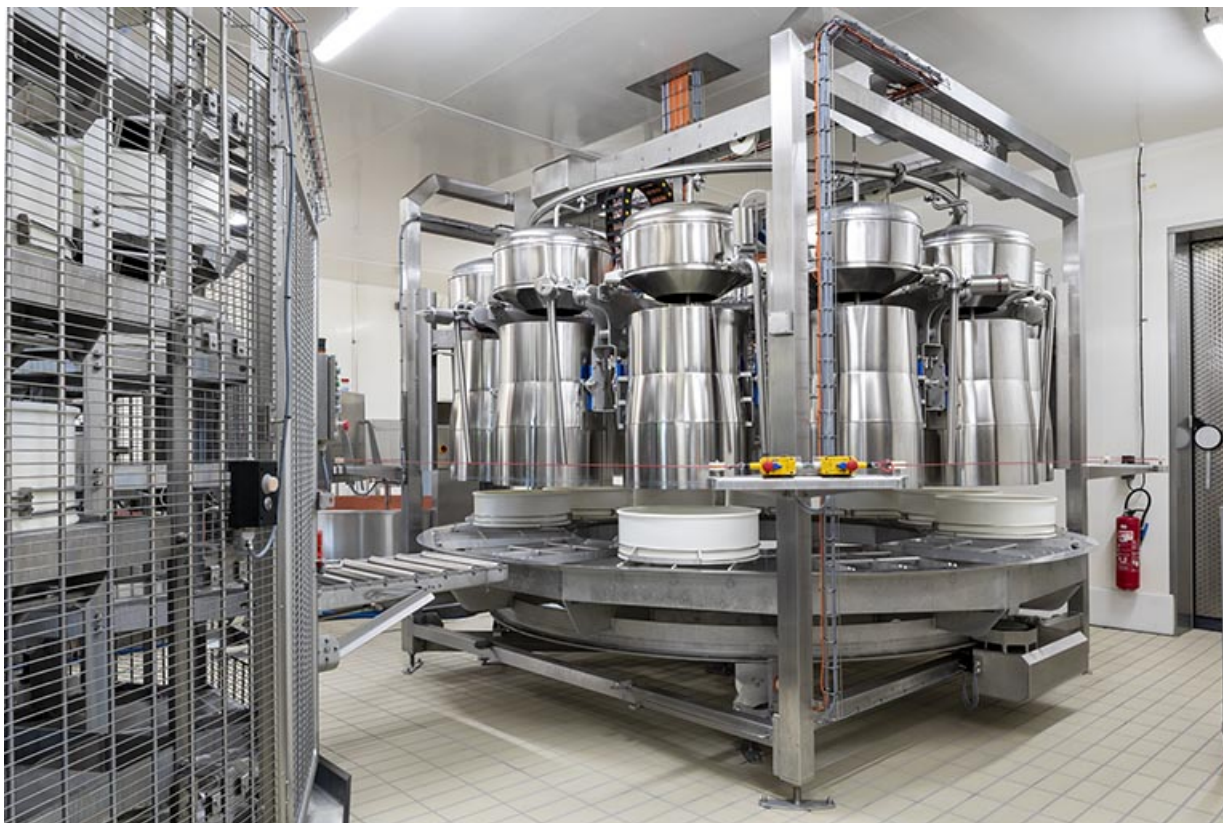
Installation de moulage (avec celle de pressage à gauche).

25, Indevillers, lieudit : au Champs du Rang