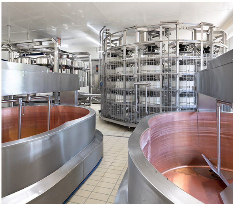
Installation de pressage, vue depuis les cuves.

25, Indevillers, lieudit : au Champs du Rang