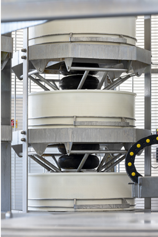
Installation de pressage : places avec moules.

25, Indevillers, lieudit : au Champs du Rang