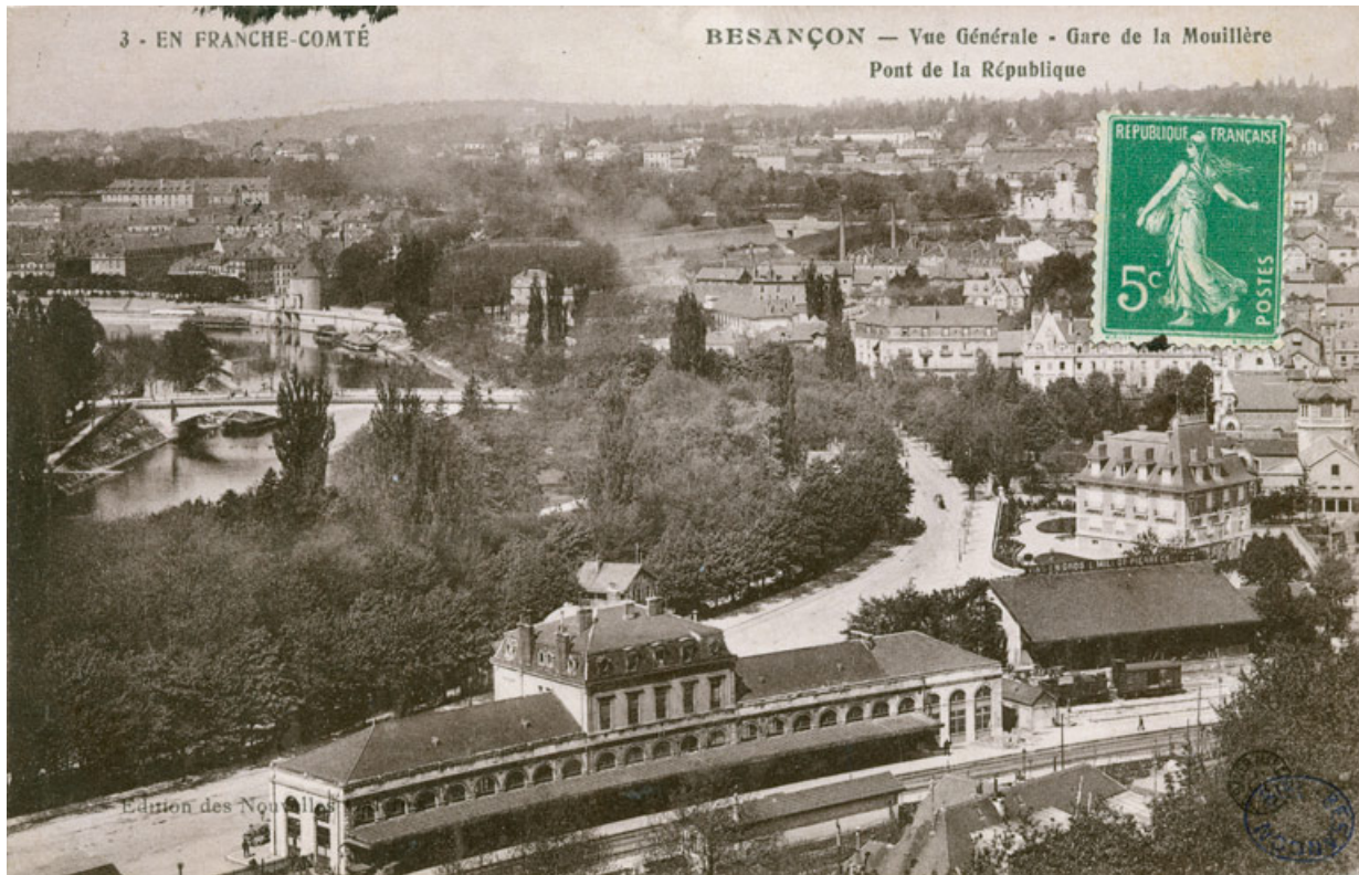
Vue ancienne, depuis le fort de Beauregard. 25, Besançon