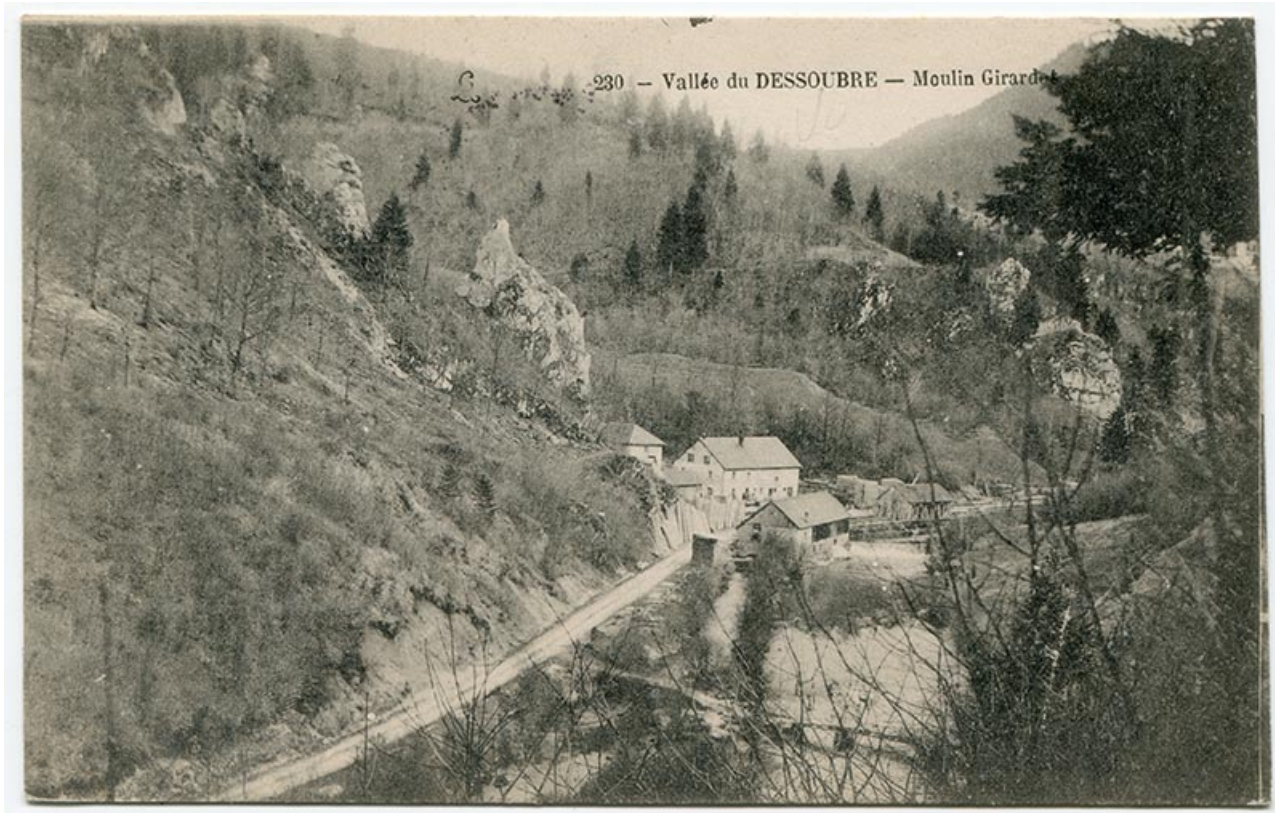
230 - Vallée du Dessoubre - Moulin Girardot, limite 19e siècle 20e siècle.

25, Plaimbois-du-Miroir, lieudit : le Moulin Girardot