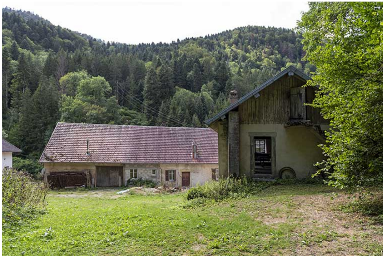
Logements, vus de l'est (à droite celui de 1772). 25, Plaimbois-du-Miroir, lieudit : le Moulin Girardot