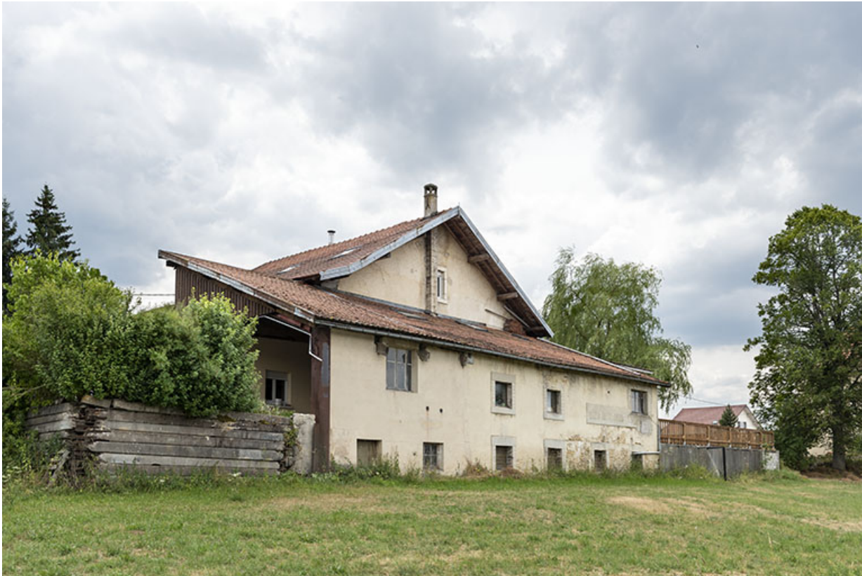
Pièce d'affinage sur la façade postérieure, de trois quarts gauche.