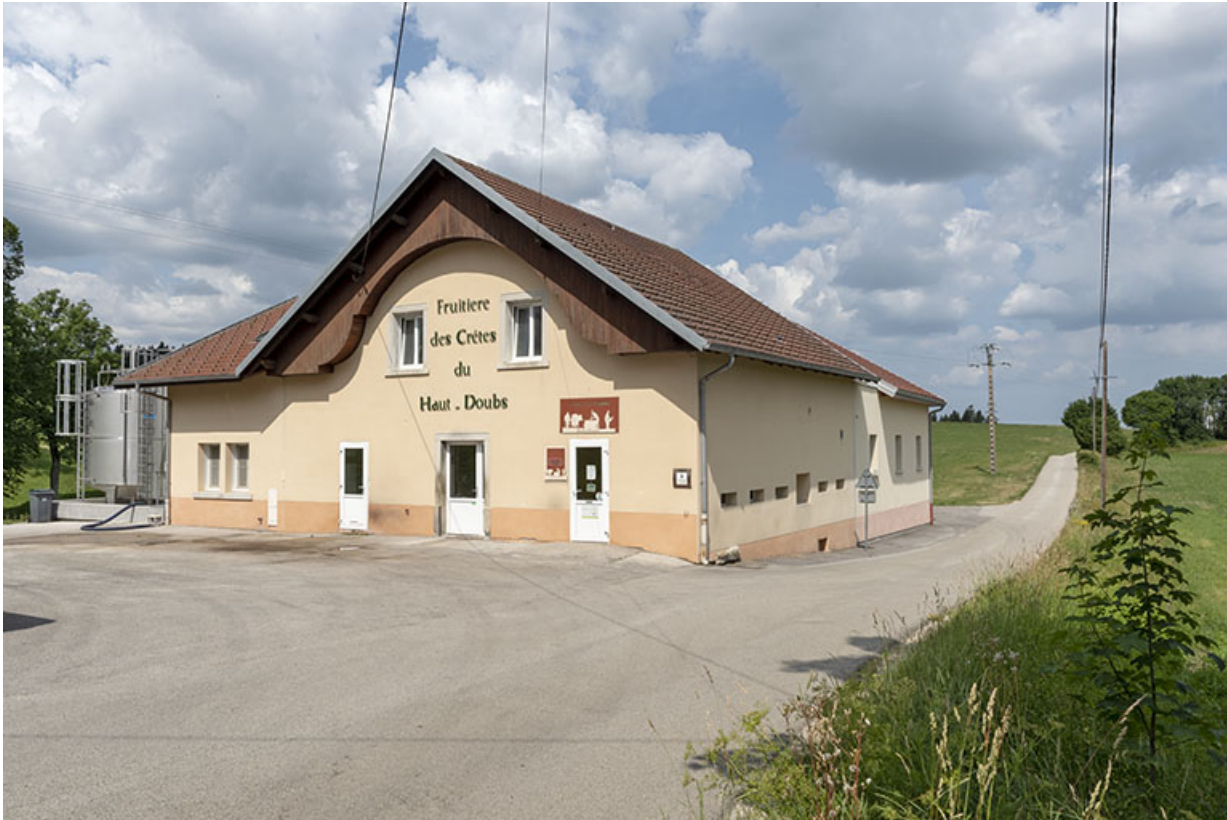
Vue d'ensemble, de trois quarts droite.

25, Grand'Combe-des-Bois, 3 rue des Peux