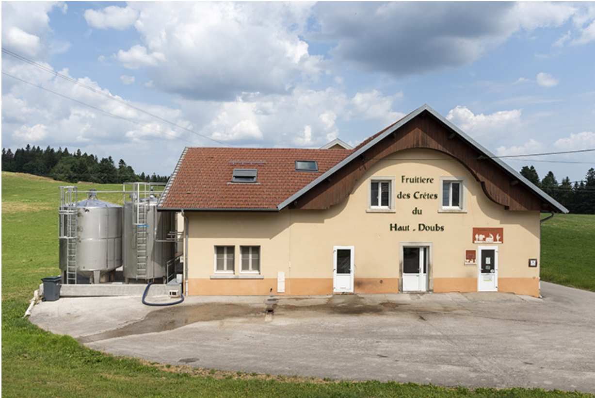
Fromagerie de Grand'Combe-des-Bois dite Fruitière des Crêtes du Haut-Doubs.

25, Grand'Combe-des-Bois, 3 rue des Peux