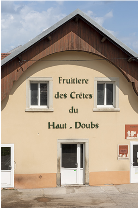
Détail de la façade antérieure.

25, Grand'Combe-des-Bois, 3 rue des Peux