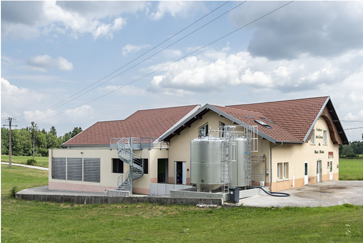
Vue d'ensemble, de trois quarts gauche.

25, Grand'Combe-des-Bois, 3 rue des Peux