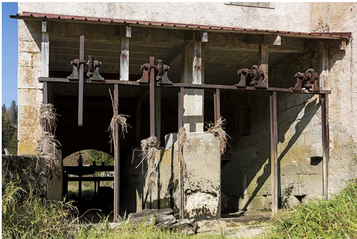
Moulin : vestiges des vannes de prise d'eau.

25, Les Combes, 4 rue du Moulin, lieudit : Remonot