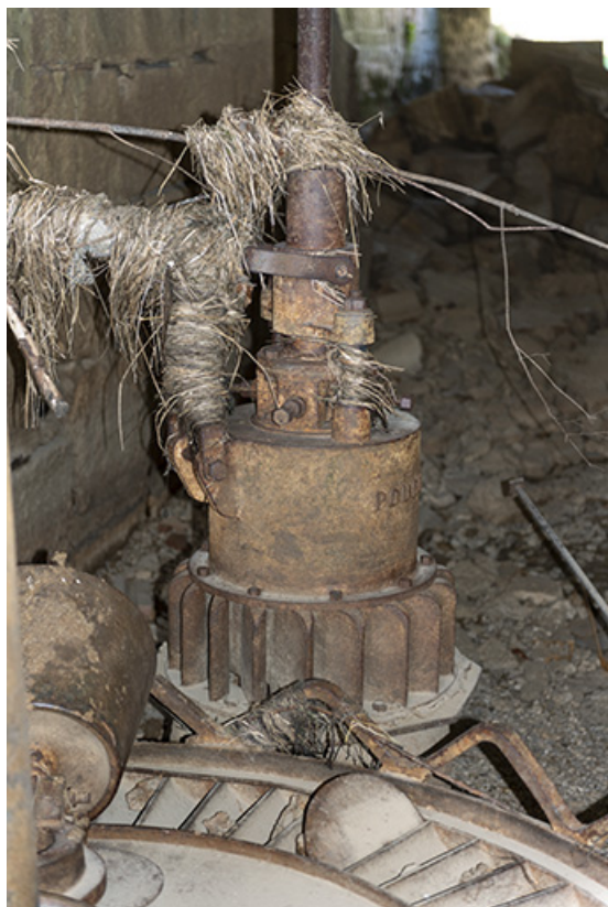
Moulin : transmission de la commande d'admission d'eau.

25, Les Combes, 4 rue du Moulin, lieudit : Remonot