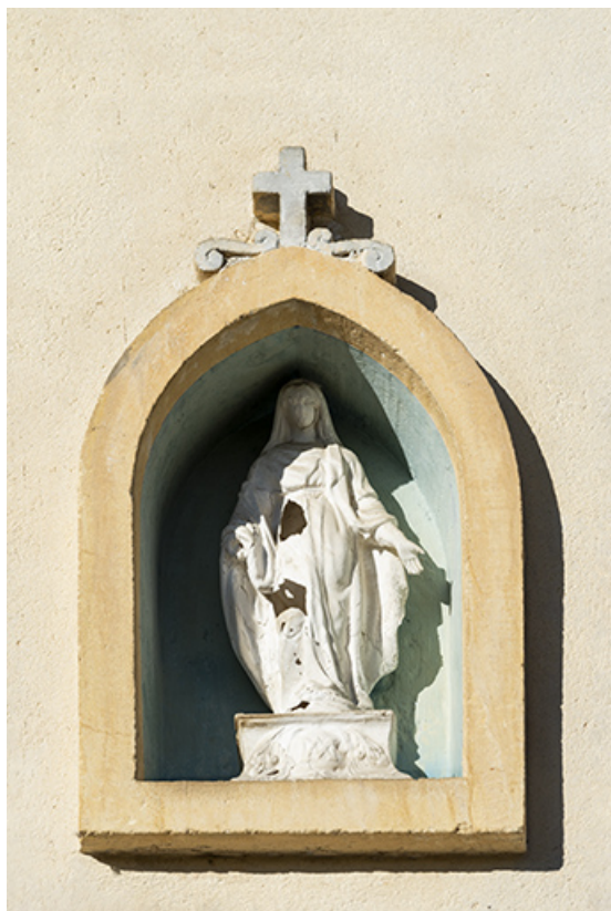
Maison : niche avec statuette de la Vierge sur la façade antérieure.

25, Les Combes, 4 rue du Moulin, lieudit : Remonot