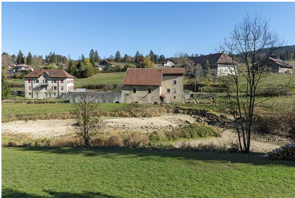
Vue d'ensemble, depuis l'ouest.

25, Les Combes, 4 rue du Moulin, lieudit : Remonot