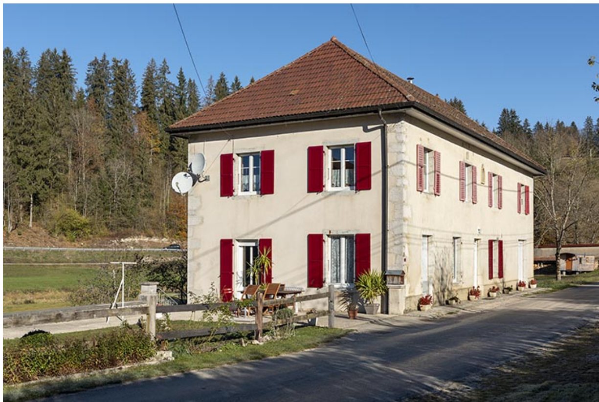
Maison : façades antérieure et latérale gauche. 25, Les Combes, 4 rue du Moulin, lieudit : Remonot