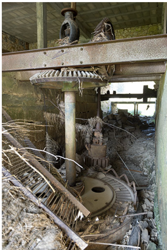
Moulin : turbine Pouguet.

25, Les Combes, 4 rue du Moulin, lieudit : Remonot