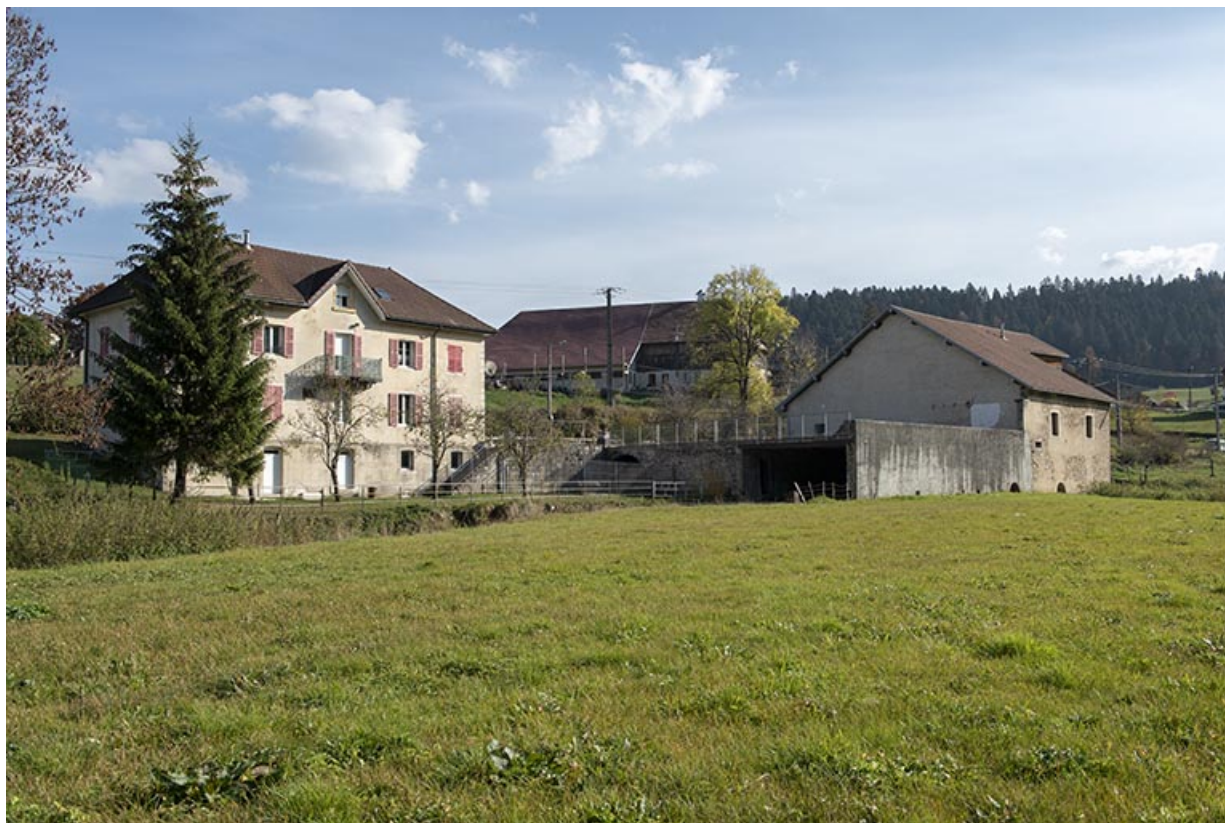
Vue d'ensemble, depuis le nord-ouest.

25, Les Combes, 4 rue du Moulin, lieudit : Remonot