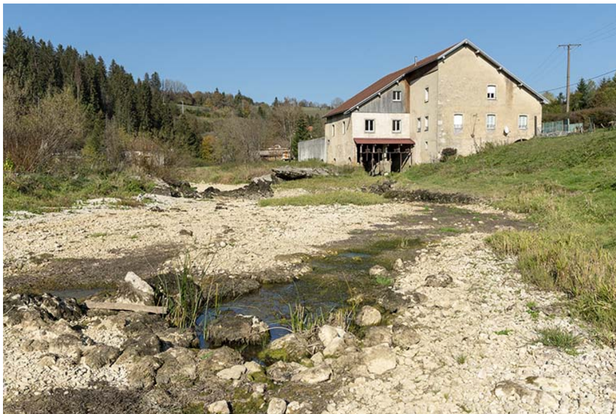
Moulin : vue d'ensemble depuis le sud (amont), avec le Doubs à sec.

25, Les Combes, 4 rue du Moulin, lieudit : Remonot