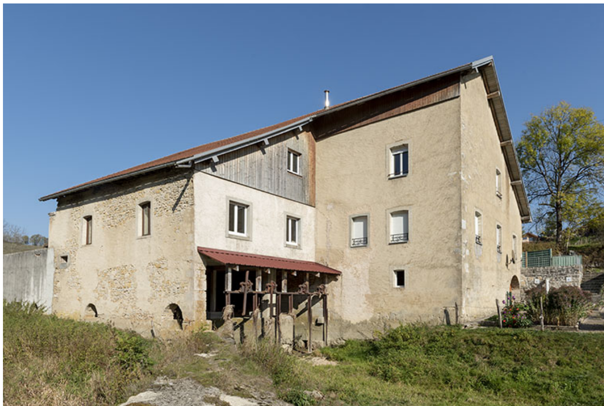
Moulin : façades postérieure et latérale gauche. 25, Les Combes, 4 rue du Moulin, lieudit : Remonot