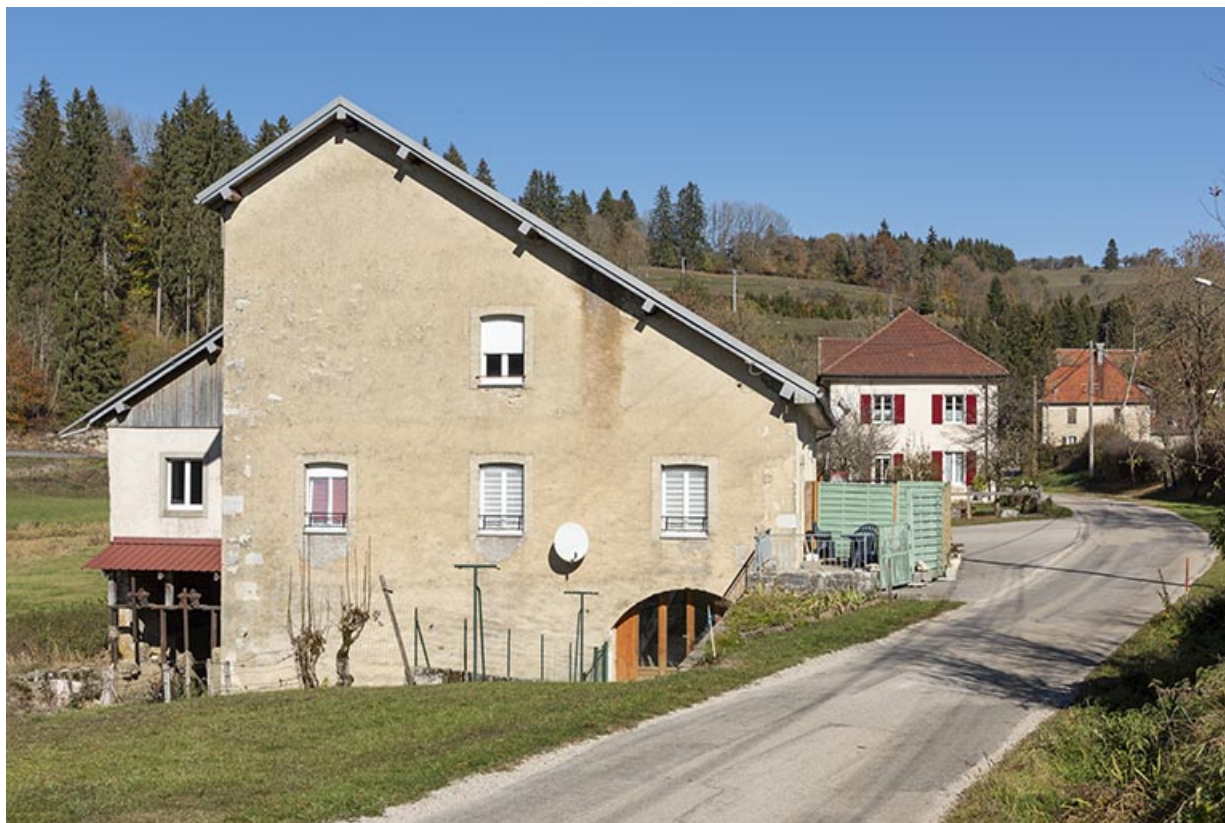
Moulin : façade latérale gauche (sud).

25, Les Combes, 4 rue du Moulin, lieudit : Remonot