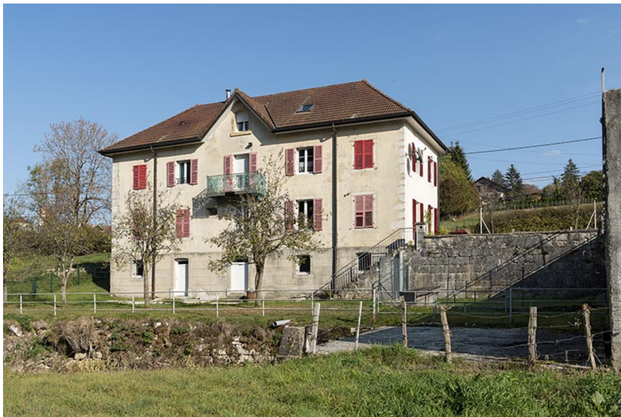
Maison : façade postérieure.

25, Les Combes, 4 rue du Moulin, lieudit : Remonot