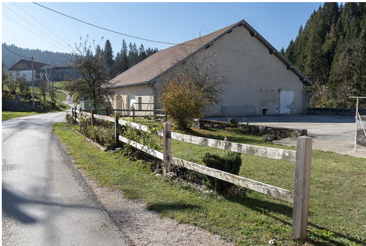
Moulin et emplacement de la scierie, depuis le nord.

25, Les Combes, 4 rue du Moulin, lieudit : Remonot