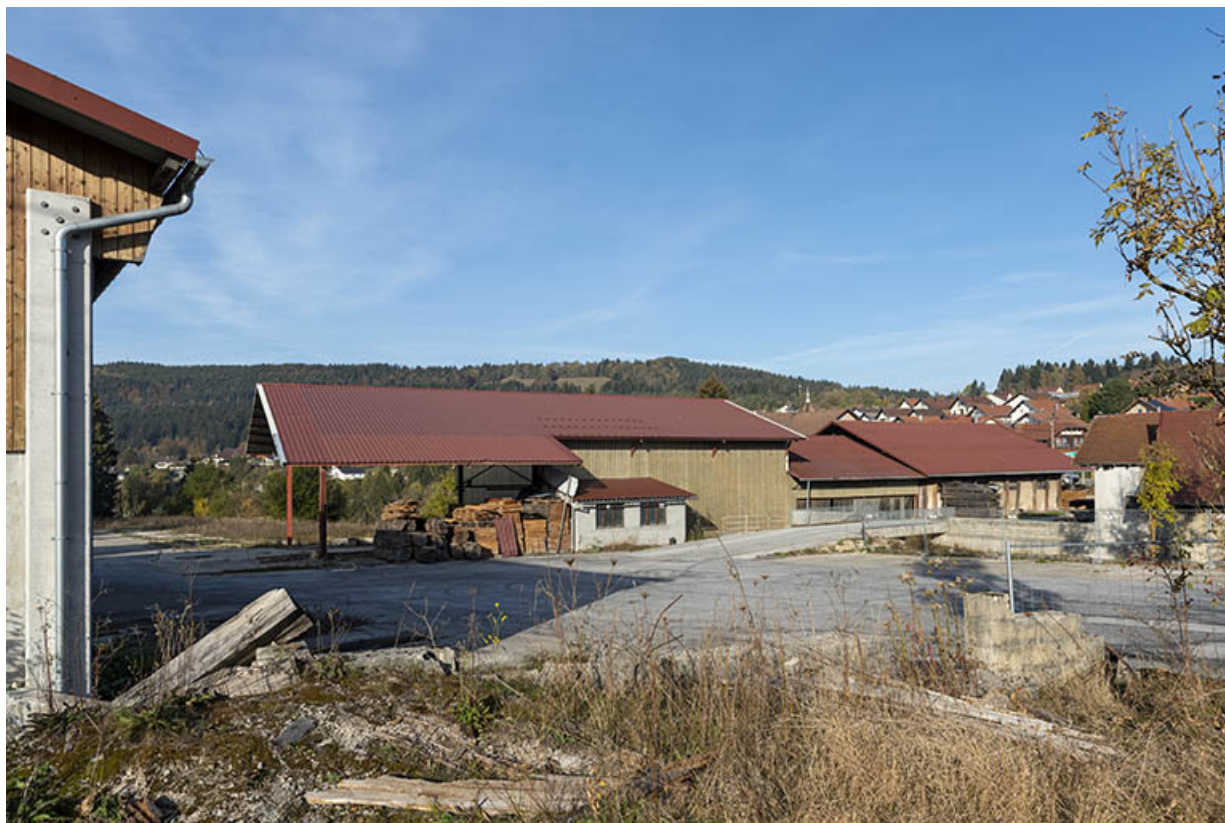
Ateliers de fabrication, depuis le sud-est.