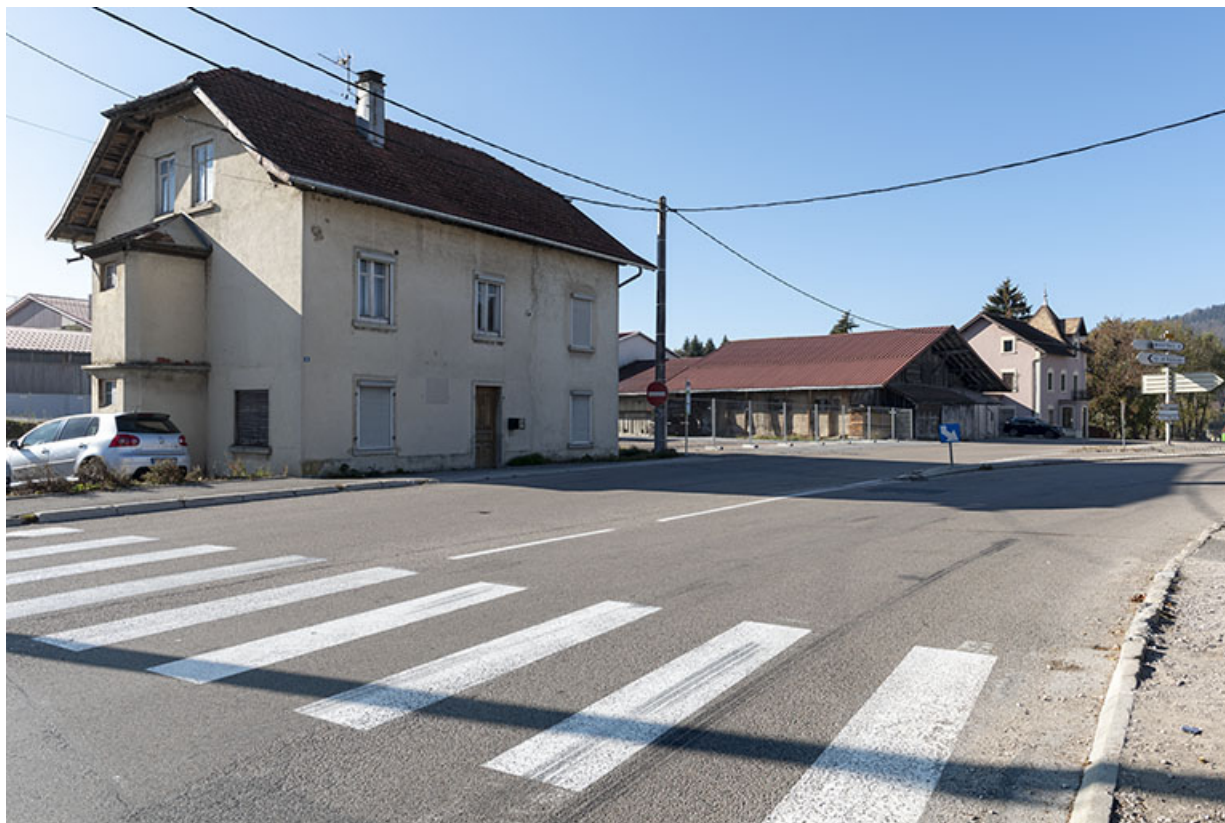
Vue d'ensemble du site, depuis l'est. Au premier plan, maison de 1919.