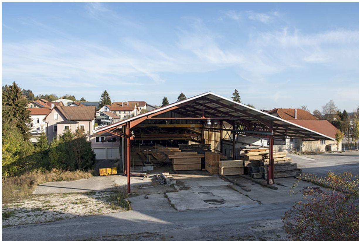
Atelier récent : façade sud.