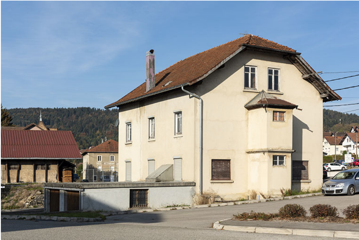
Maison de 1919 : façades postérieure et latérale gauche.