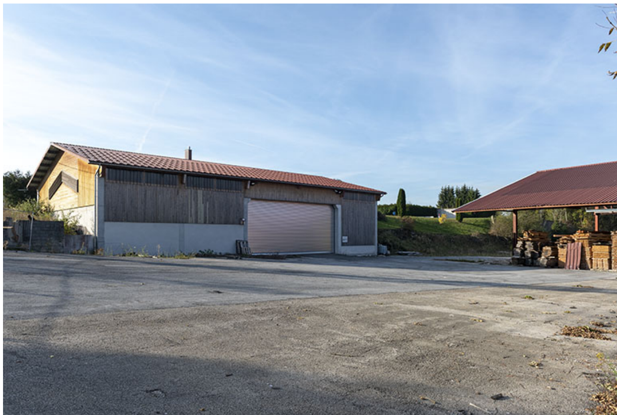
Magasin industriel, de trois quarts gauche.