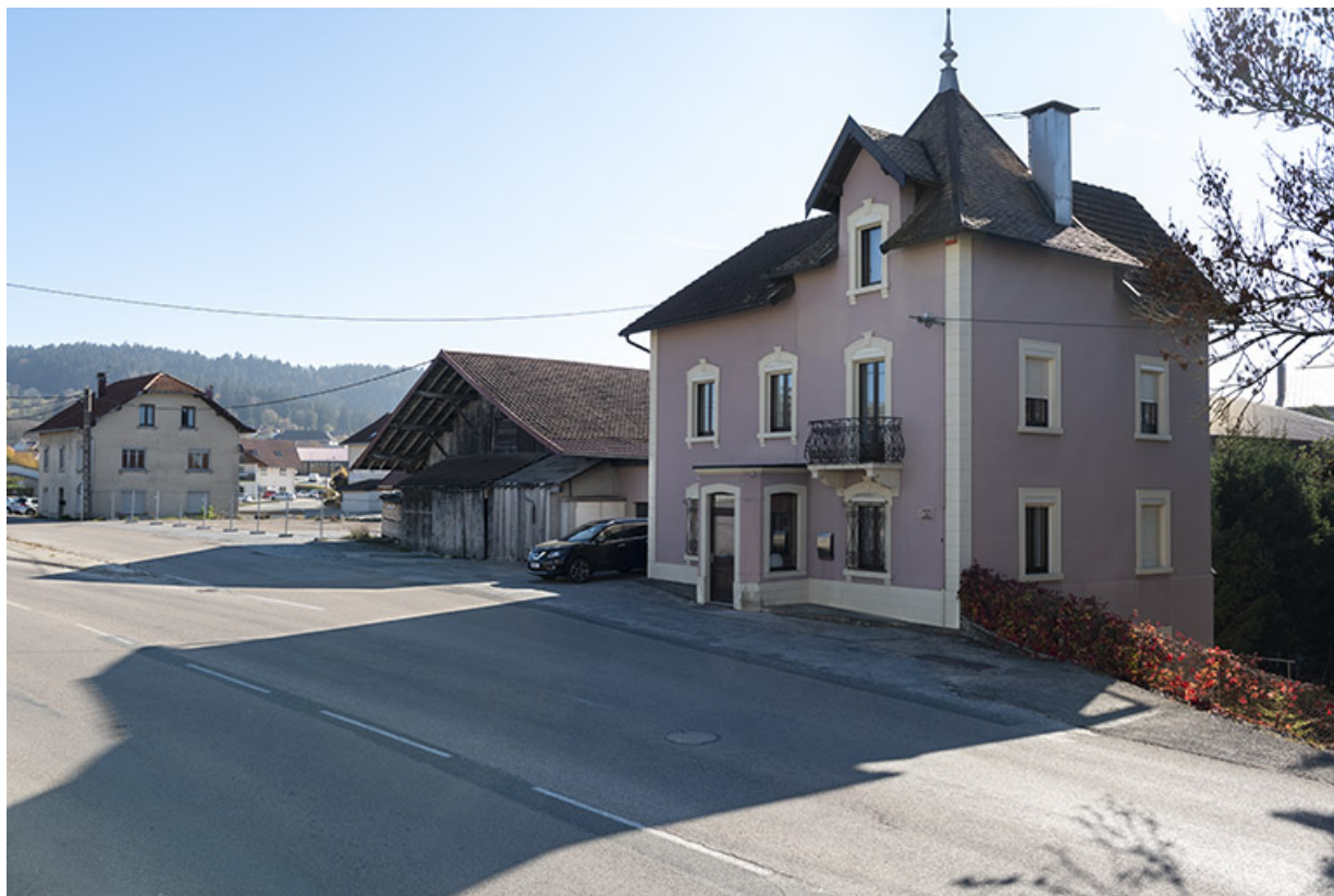
Vue d'ensemble du site, depuis l'ouest. Au premier plan, maison bâtie entre 1928 et 1938.