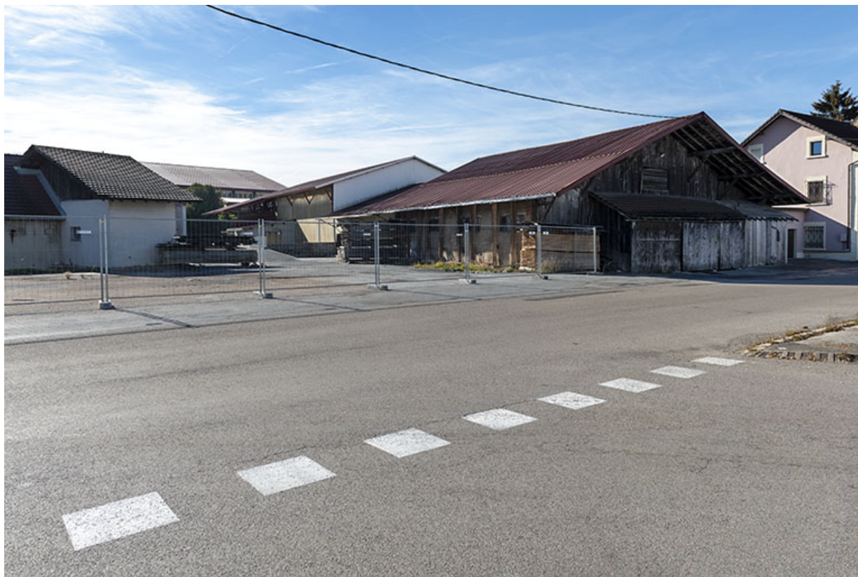
Ateliers de fabrication, depuis le nord-est.