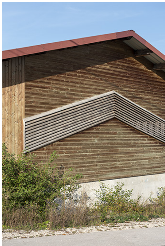
Magasin industriel : essentage de planches sur le mur est.