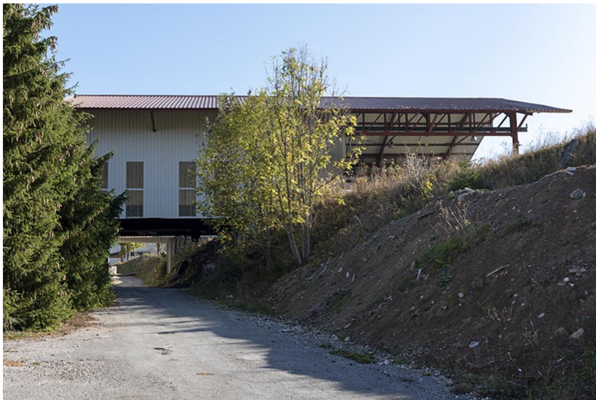
Atelier récent et chemin, depuis l'ouest.