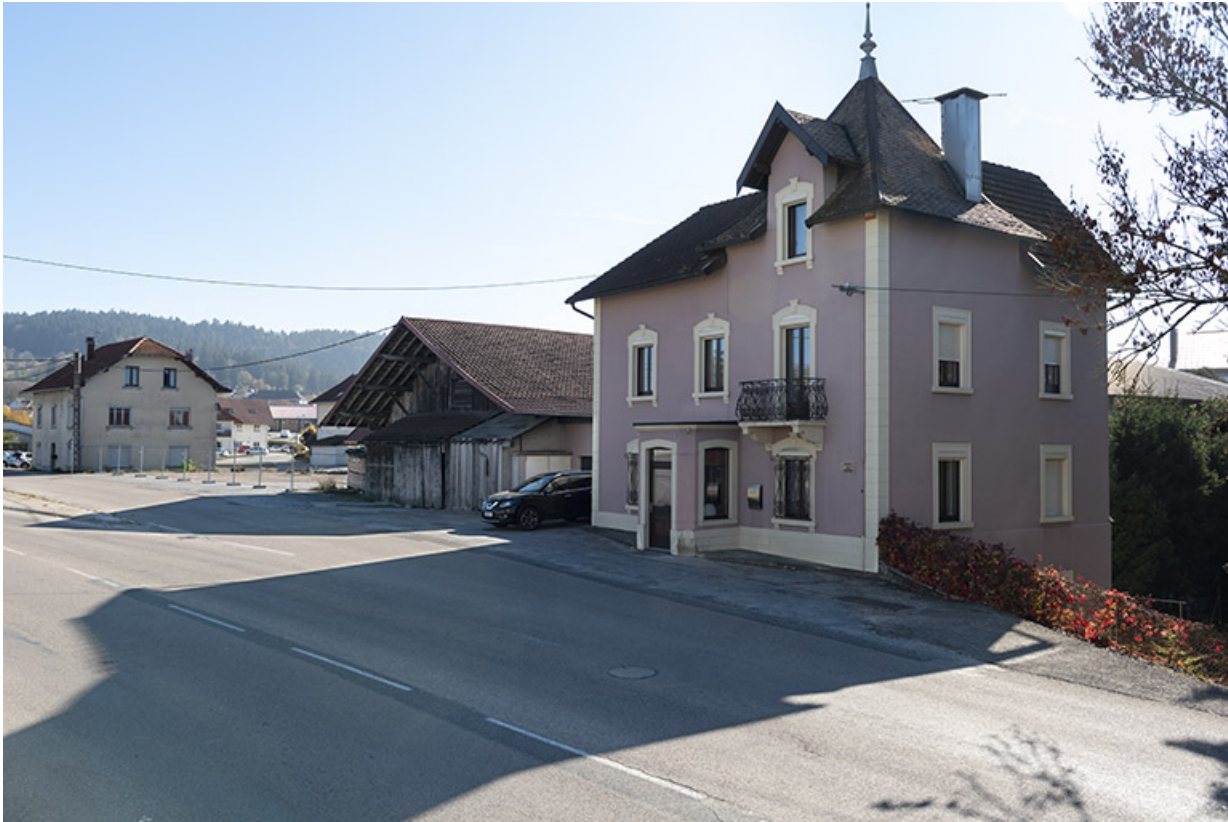
Vue d'ensemble du site, depuis l'ouest. Au premier plan, maison bâtie entre 1928 et 1938. 25, Les Fins, 1-3 route de Maîche