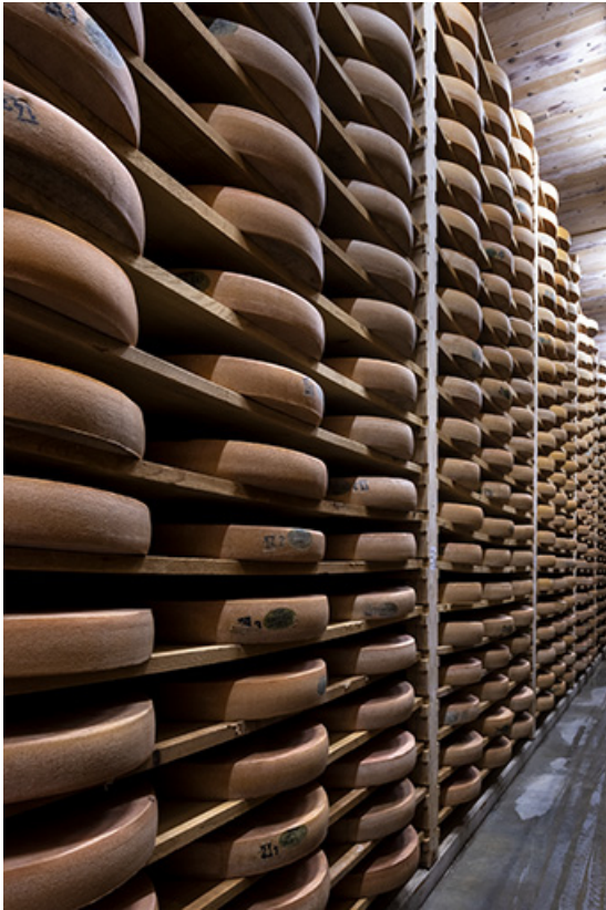
Cave d'affinage : meules de comté.

25, Les Fins, 1 rue des Tilleuls, lieudit : les Suchaux