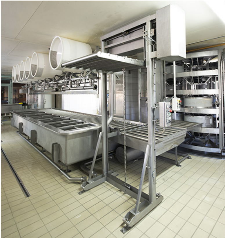
Atelier de fabrication: installations de soutirage et de pressage.

25, Les Fins, 1 rue des Tilleuls, lieudit : les Suchaux