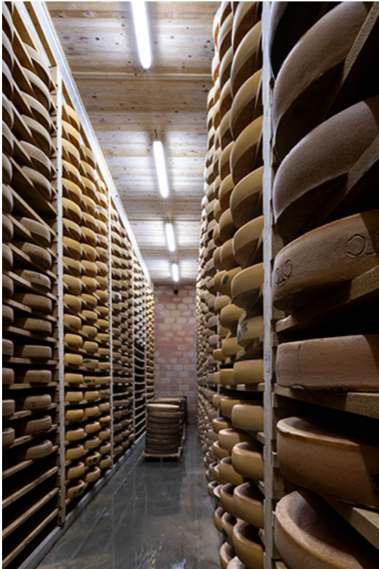
Cave d'affinage : intérieur d'une pièce.

25, Les Fins, 1 rue des Tilleuls, lieudit : les Suchaux