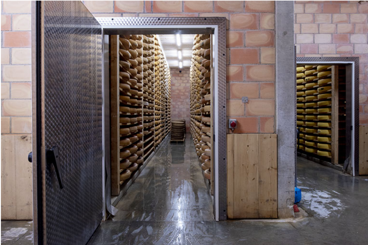
Cave d'affinage : entrée de deux pièces depuis le couloir.

25, Les Fins, 1 rue des Tilleuls, lieudit : les Suchaux