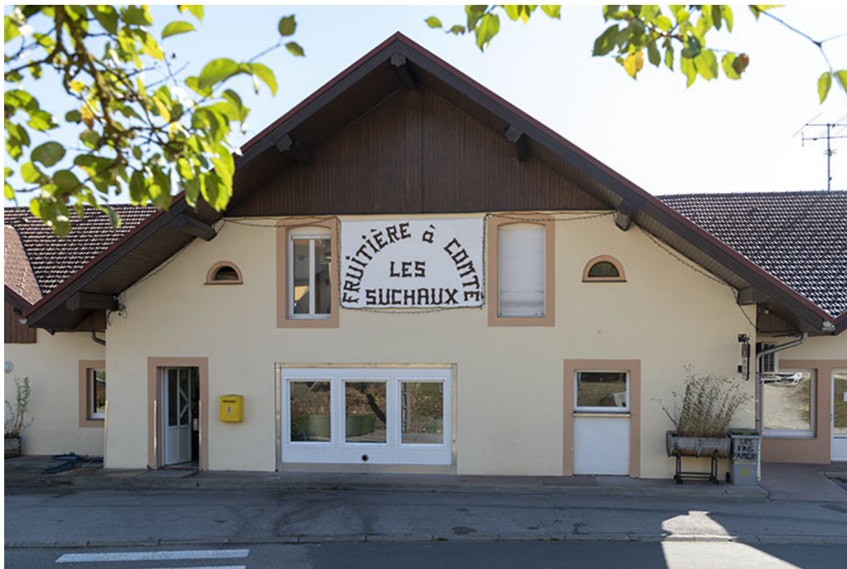
Façade antérieure : bâtiment d'origine.

25, Les Fins, 1 rue des Tilleuls, lieudit : les Suchaux