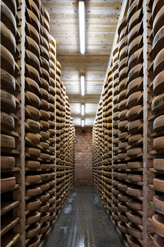
Cave d'affinage : intérieur d'une pièce.

25, Les Fins, 1 rue des Tilleuls, lieudit : les Suchaux