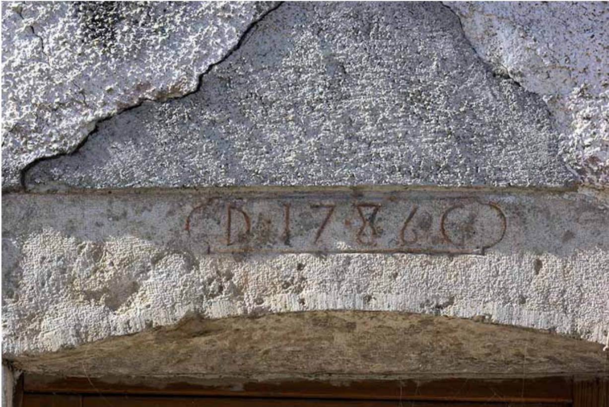
Maison de 1786, façade antérieure : linteau daté.