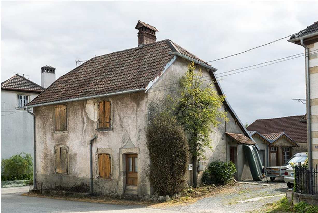
Maison de 1786, de trois quarts droite.