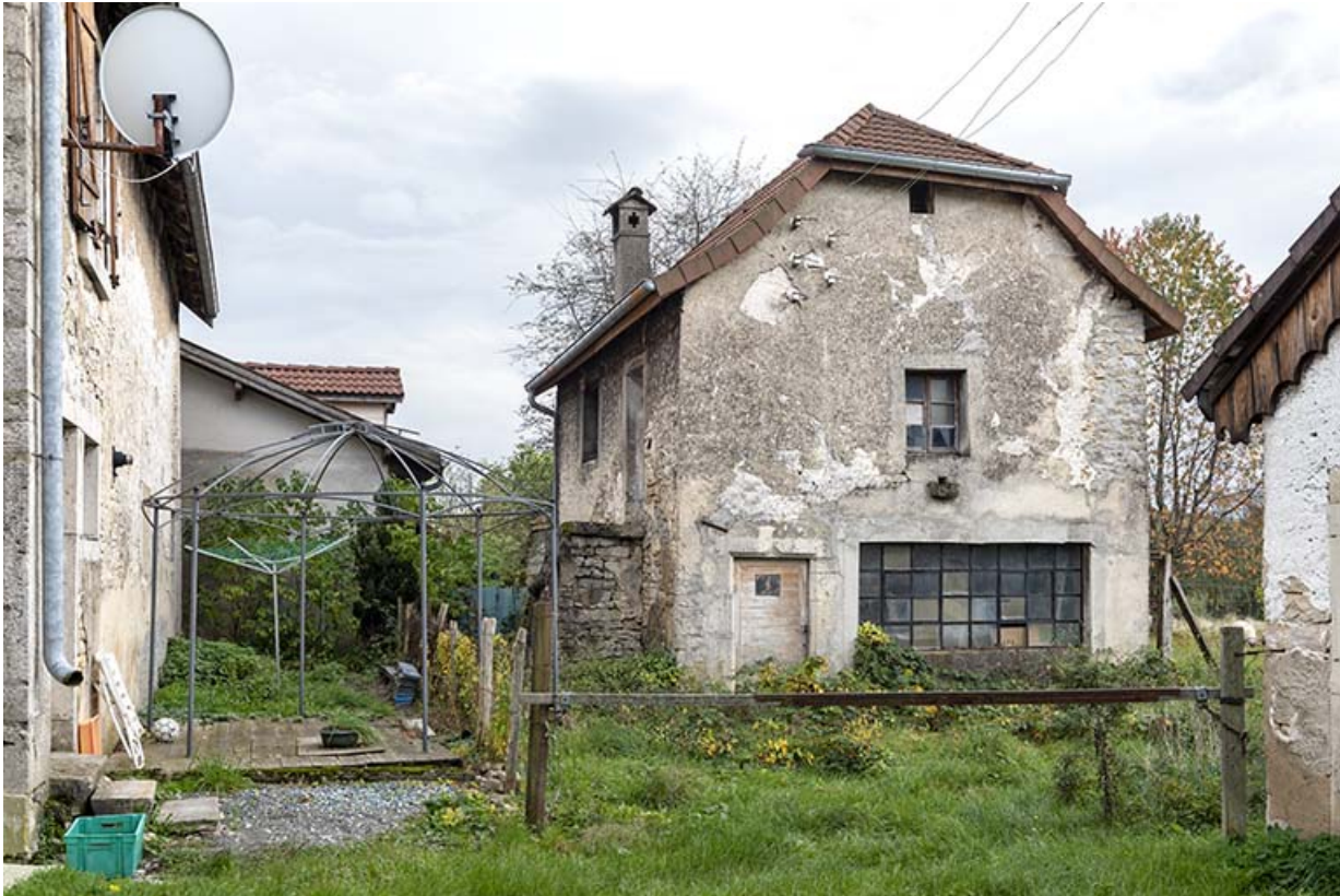
Forge. Façade postérieure de la grange à gauche.