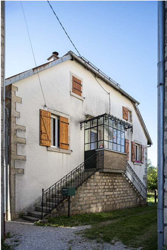
Grange : façade latérale droite, avec accès aux logements à l'étage.