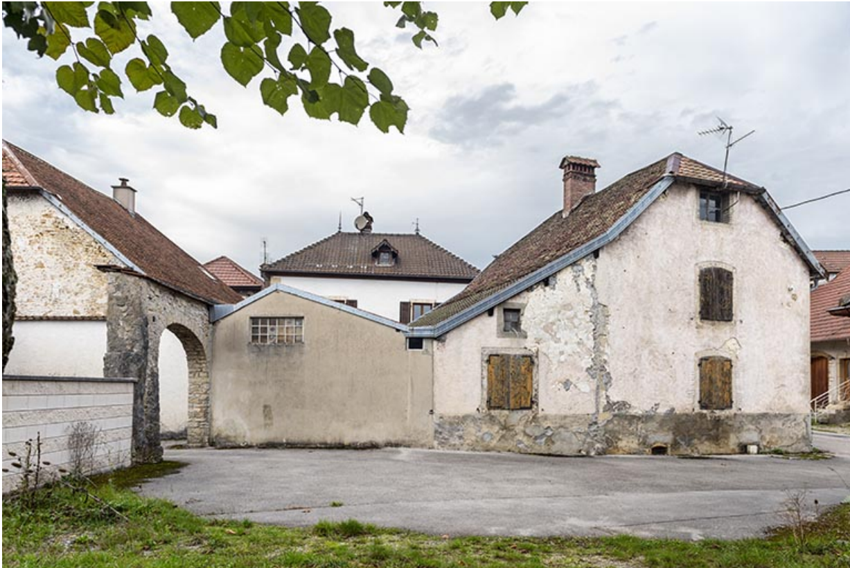
Vue d'ensemble, depuis le sud-est.