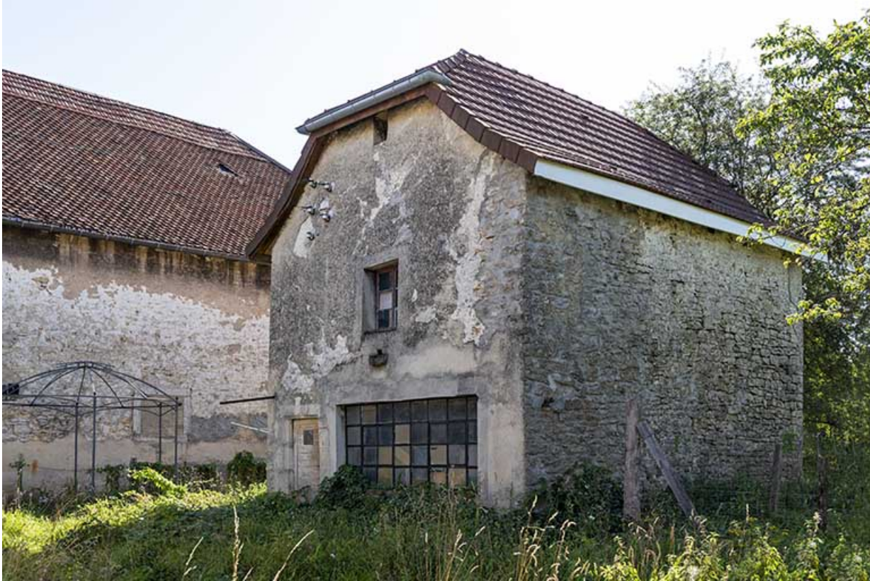
Forge : façades antérieure et latérale droite.