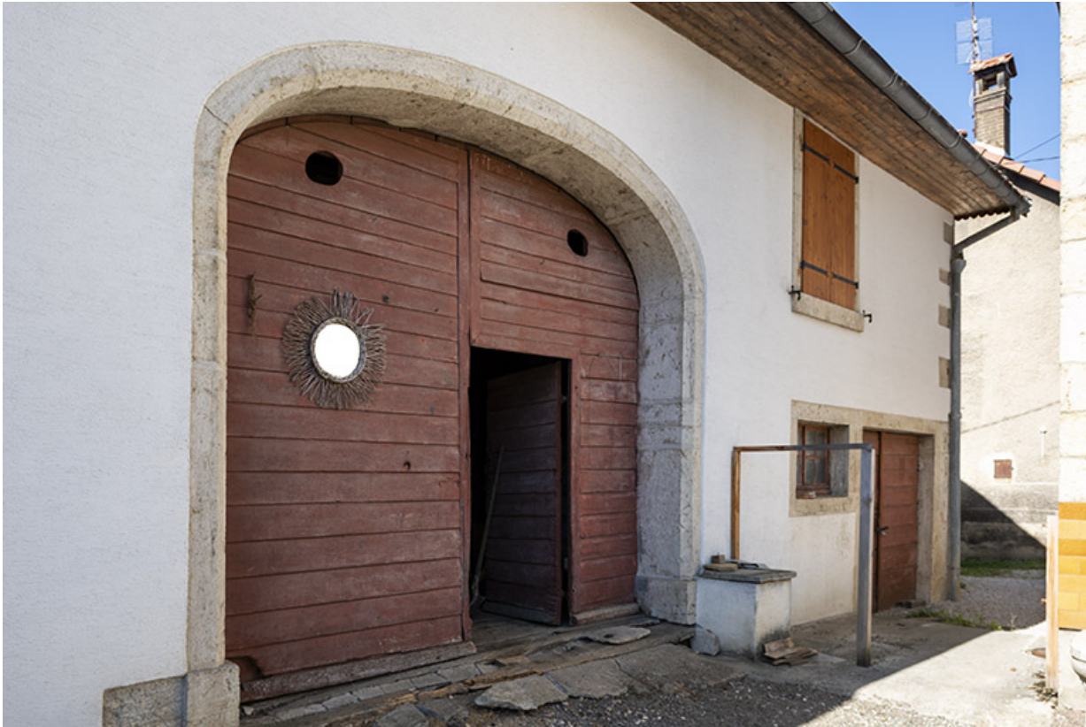
Grange : façade antérieure, de trois quarts gauche.