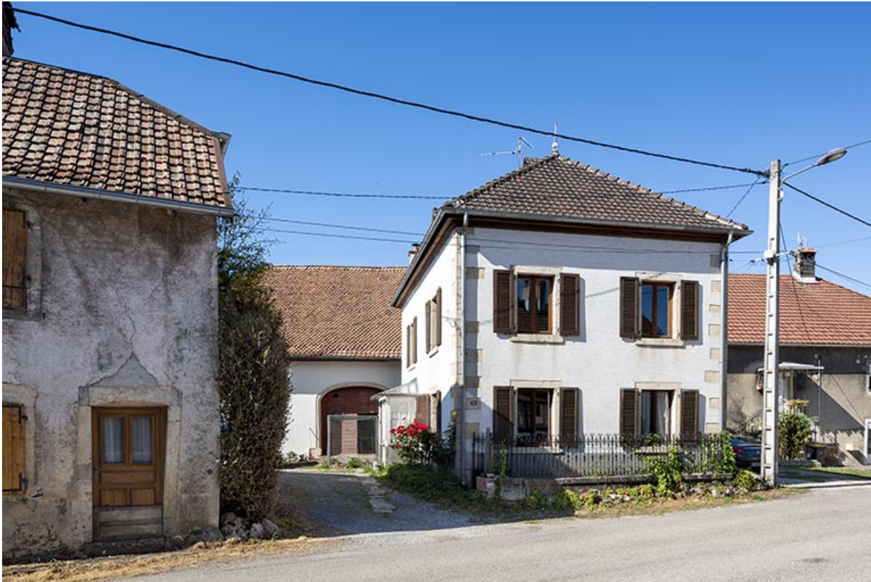
Maison de 1853, en avant de la grange (à gauche).