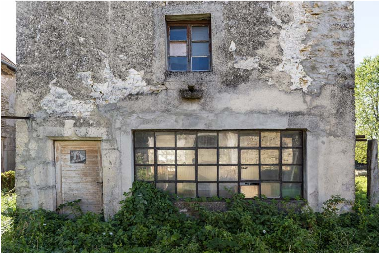
Forge, façade antérieure : porte et fenêtres.