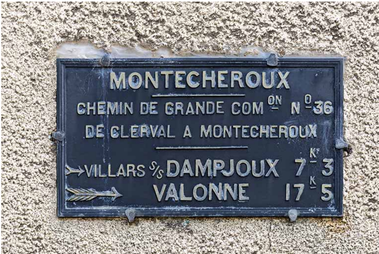
Bureau et logement : panneau indicateur sur la façade latérale droite. 25, Montécheroux, 55, 66 Grande Rue