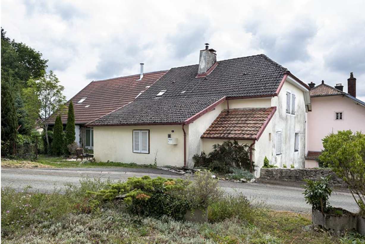
Vue d'ensemble, depuis le nord-ouest.