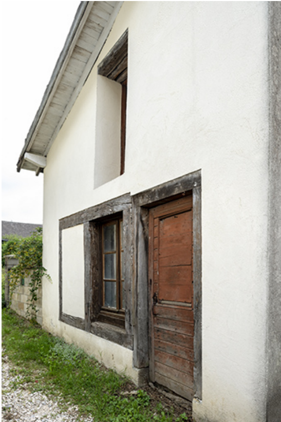
Atelier de fabrication : façade antérieure, vue en enfilade.