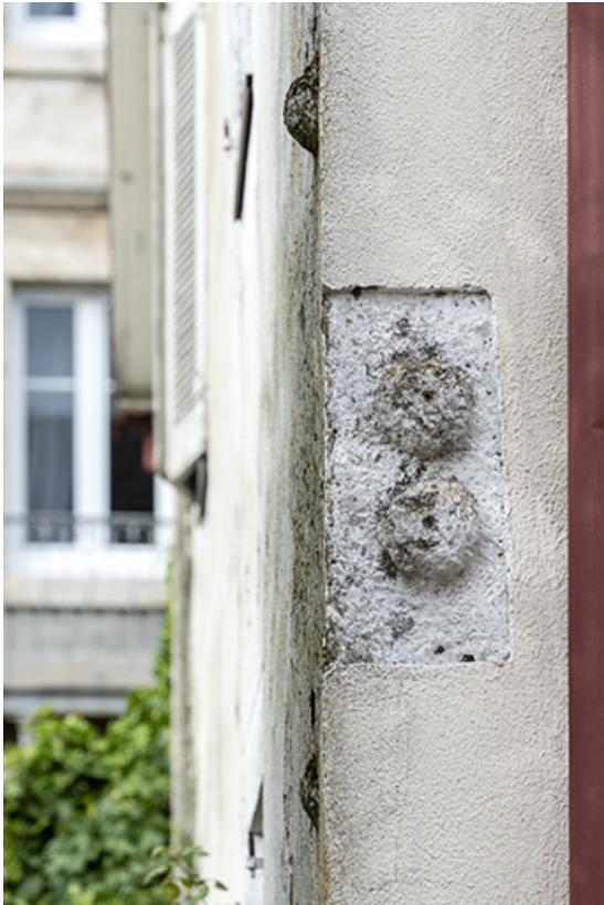
Bâtiment de 1723, façade antérieure : boules apotropaïques.