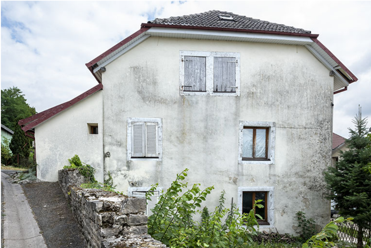
Bâtiment de 1723 : façade latérale gauche.