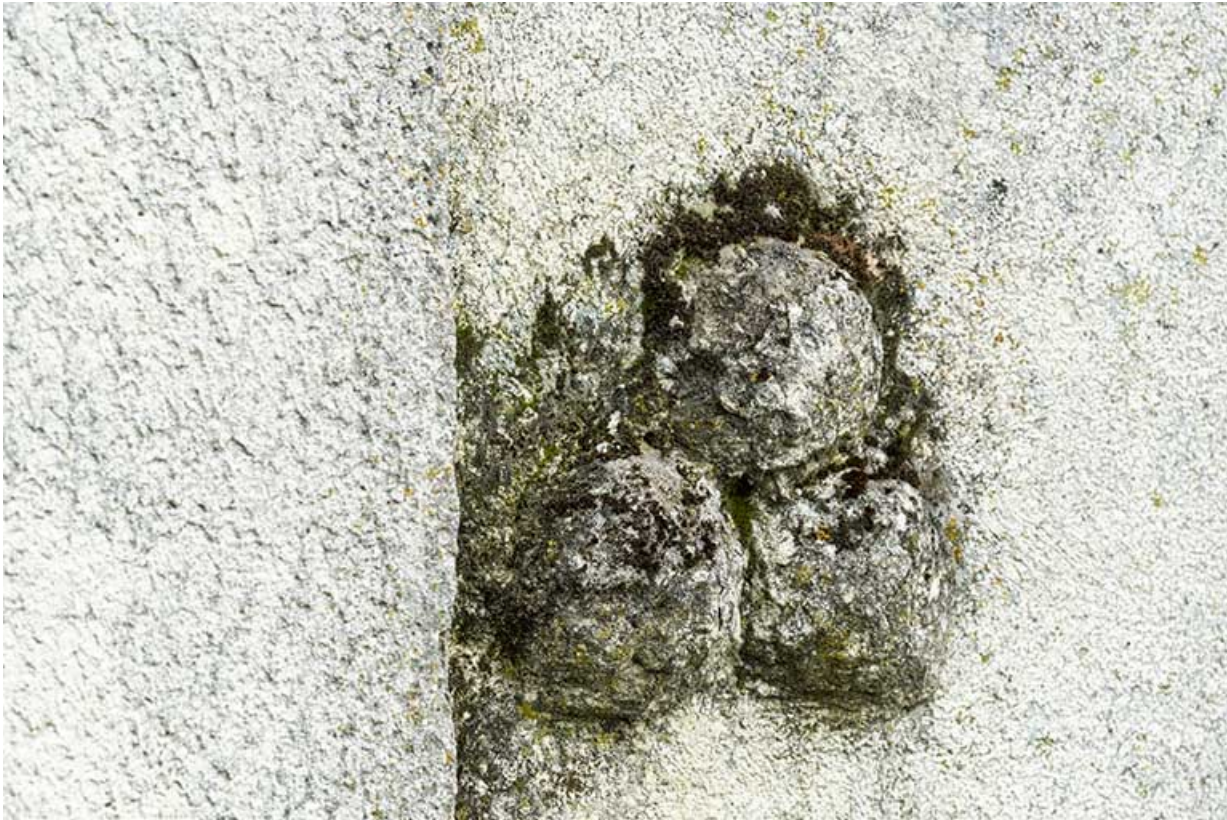
Bâtiment de 1723, façade latérale gauche : boules apotropaïques.