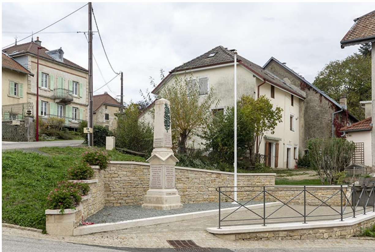
Vue d'ensemble, depuis le sud-ouest. Les bâtiments sont situés entre les comptoirs d'outillage Hugoniot-Perrenoud (visible à gauche) et Hugoniot-Tissot (à droite).