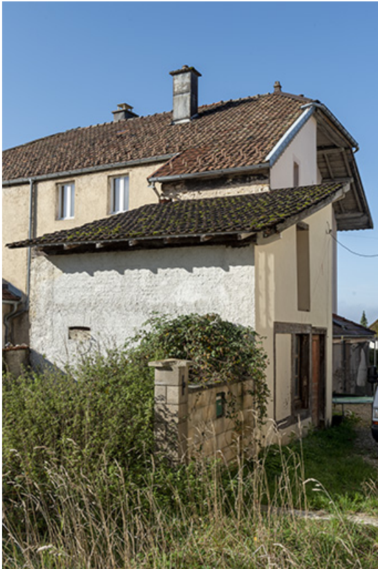
Atelier de fabrication, de trois quarts gauche.