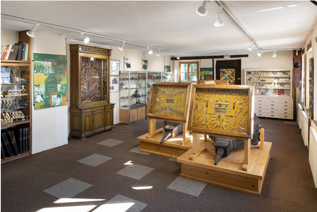
Atelier de fabrication : salle d'exposition du musée au rez-de-chaussée surélevé. 25, Montécheroux