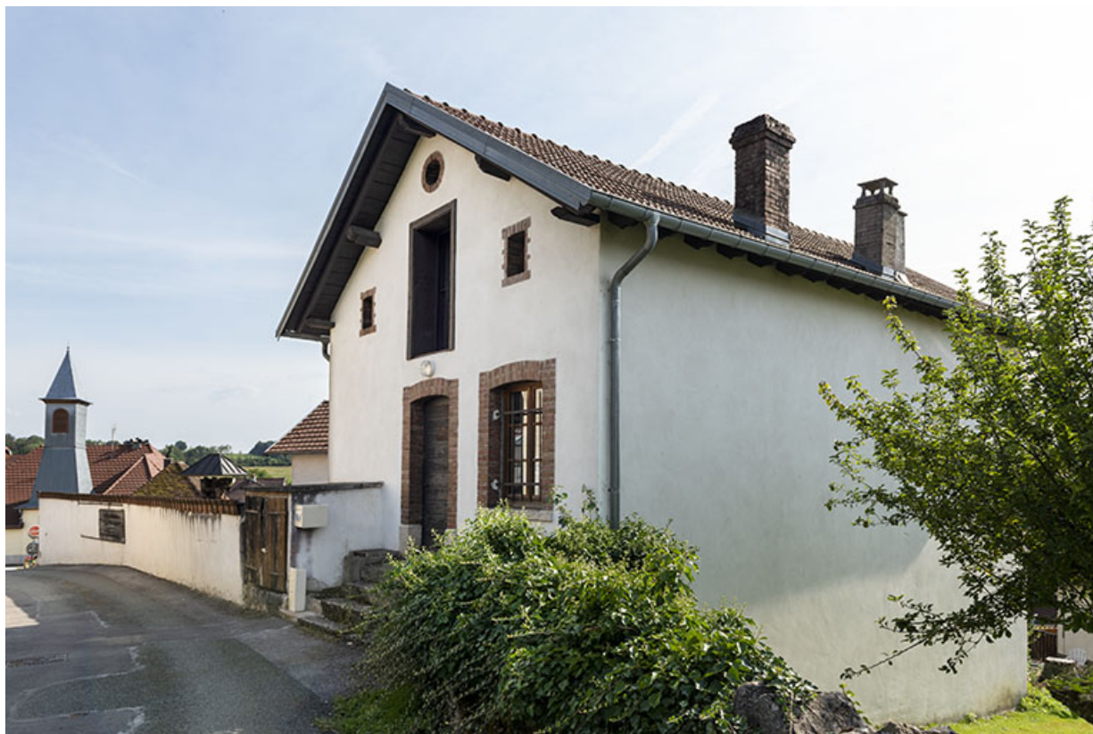
Vue d'ensemble, depuis le nord.

25, Montécheroux, 12 rue de la Pommeraie