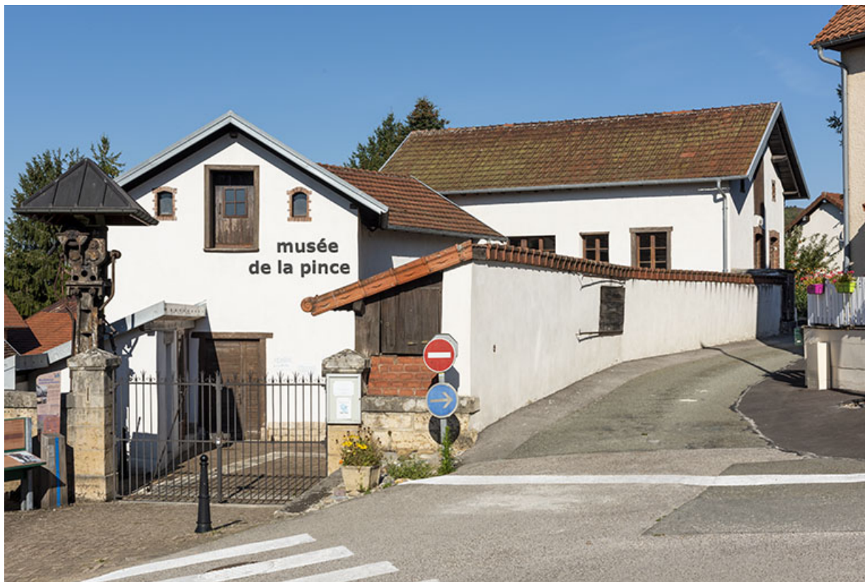
Usine d'outillage (actuel musée de la Pince), 12 rue de la Pommeraie. 25, Montécheroux