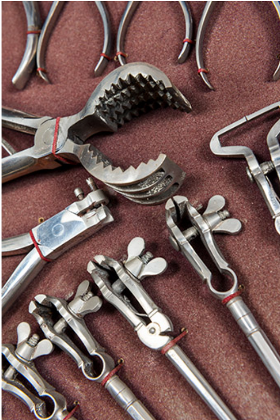
Meuble d'exposition Hugoniot-Tissot : pinces et étaux à main.

25, Montécheroux, 12 rue de la Pommeraie