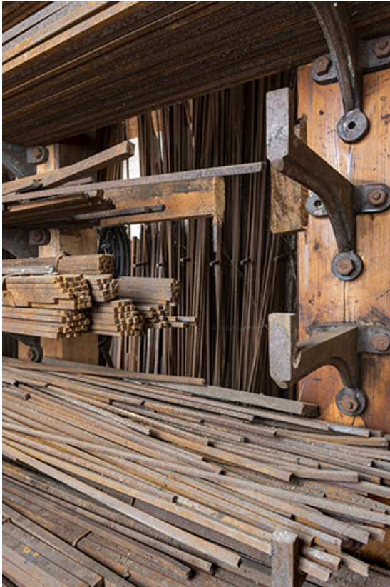
Entrepôt industriel : barres de fer en stock.

25, Montécheroux, 12 rue de la Pommeraie