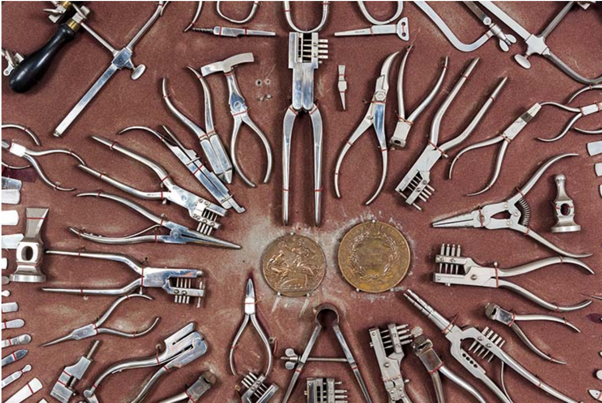
Meuble d'exposition Hugoniot-Tissot : assortiment de pinces, brucelles, etc. (vue rapprochée).

25, Montécheroux, 12 rue de la Pommeraie