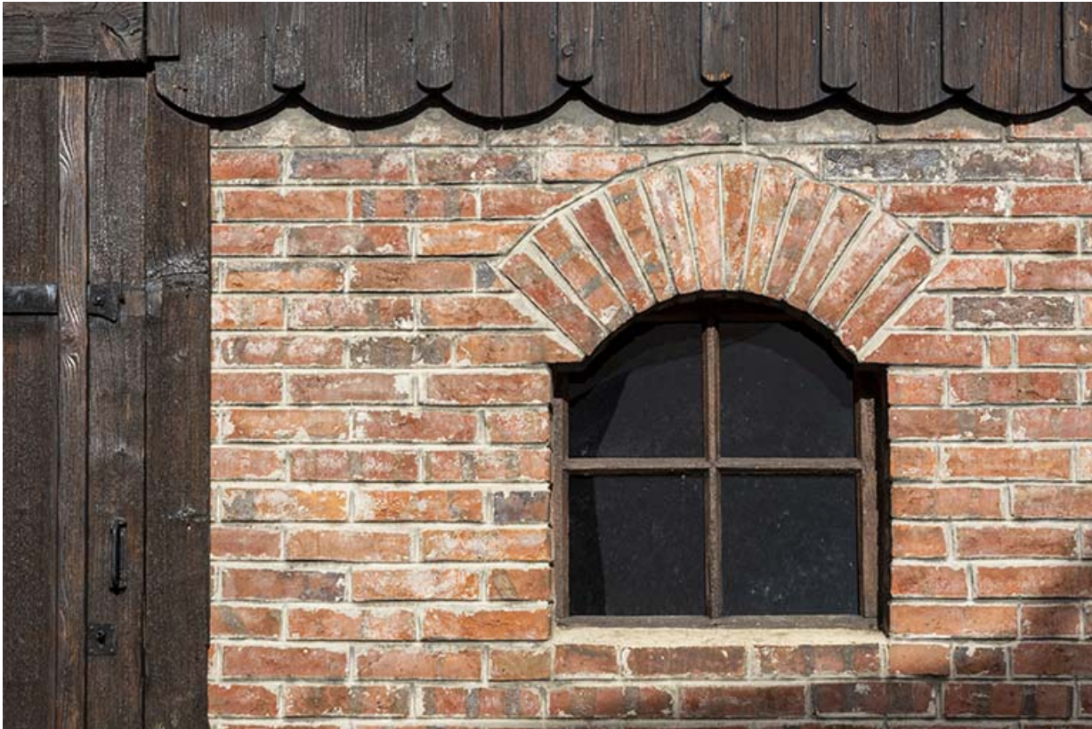
Une fenêtre de la pièce de stockage du combustible.

25, Montécheroux, 12 rue de la Pommeraie