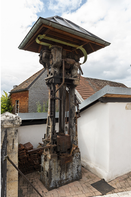
Marteau-pilon de la "Fabrique".

25, Montécheroux, 31-33 rue de Saint-Hippolyte