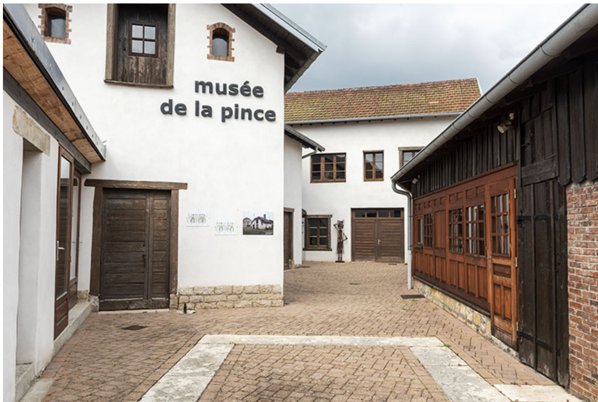
Entrepôt industriel à gauche, atelier de fabrication au fond et pièce de stockage du combustible à droite. 25, Montécheroux, 12 rue de la Pommeraie