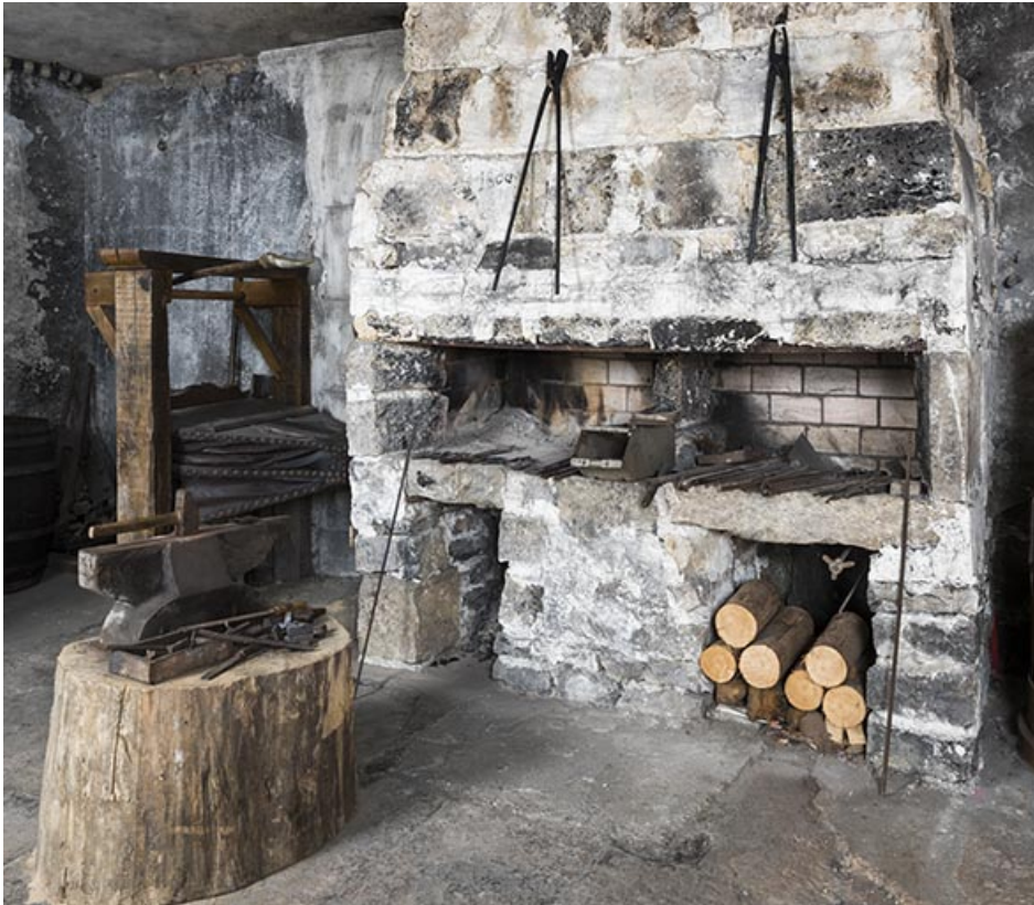
Atelier de fabrication : feu de forge et soufflet (donnés au musée par Bernard Chaney). 25, Montécheroux, 12 rue de la Pommeraie