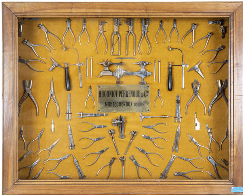
Vitrine Hugoniot-Perrenoud (musée de la Pince, Montécheroux) : assortiment de pinces et outils, dont un tour d'horloger. 25, Montécheroux