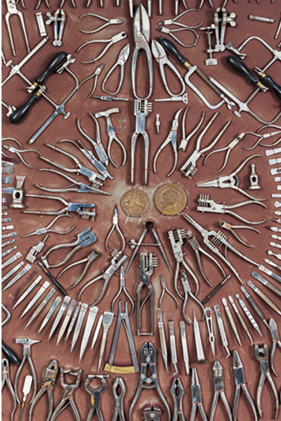
Meuble d'exposition Hugoniot-Tissot (musée de la Pince, Montécheroux) : assortiment de pinces, brucelles, etc. 25, Montécheroux