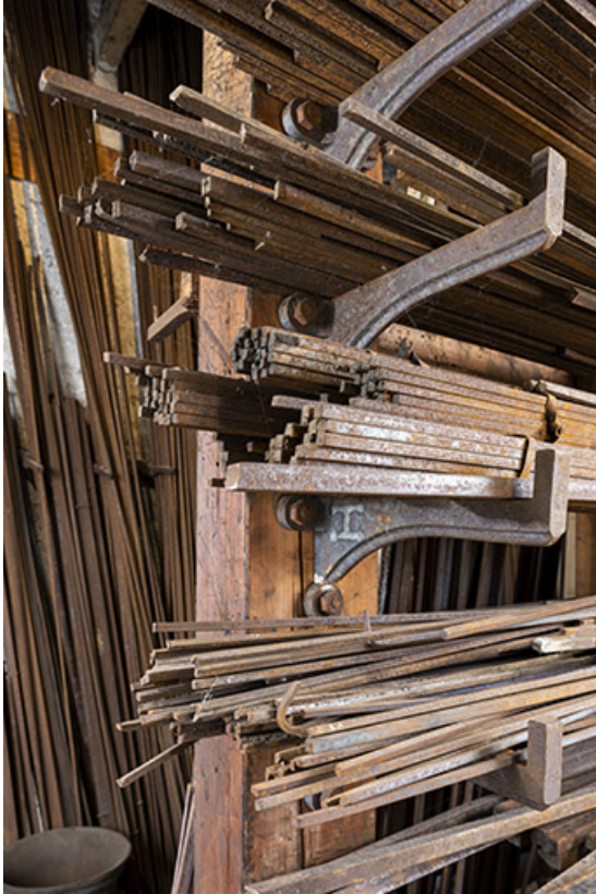
Entrepôt industriel : barres de fer en stock.

25, Montécheroux, 12 rue de la Pommeraie