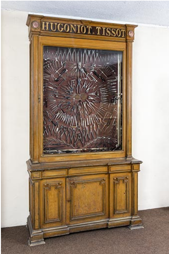
Meuble d'exposition Hugoniot-Tissot (musée de la Pince, Montécheroux). 25, Montécheroux