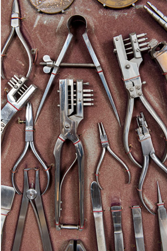
Meuble d'exposition Hugoniot-Tissot : pinces, brucelles et compas.

25, Montécheroux, 12 rue de la Pommeraie