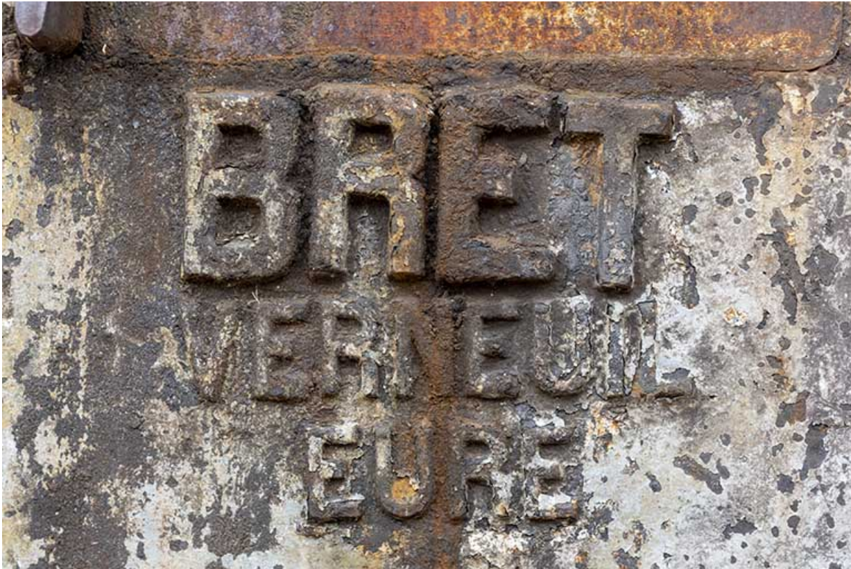
Marteau-pilon de la "Fabriquee : marque du constructeur Bret.

25, Montécheroux, 12 rue de la Pommeraie