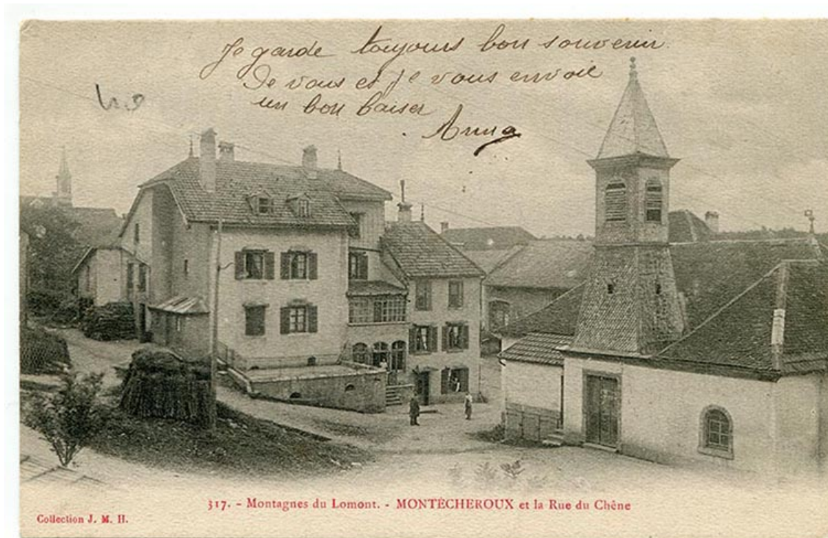
317. - Montagnes du Lomont. - Montécheroux et la rue du Chêne, limite 19e siècle 20e siècle.