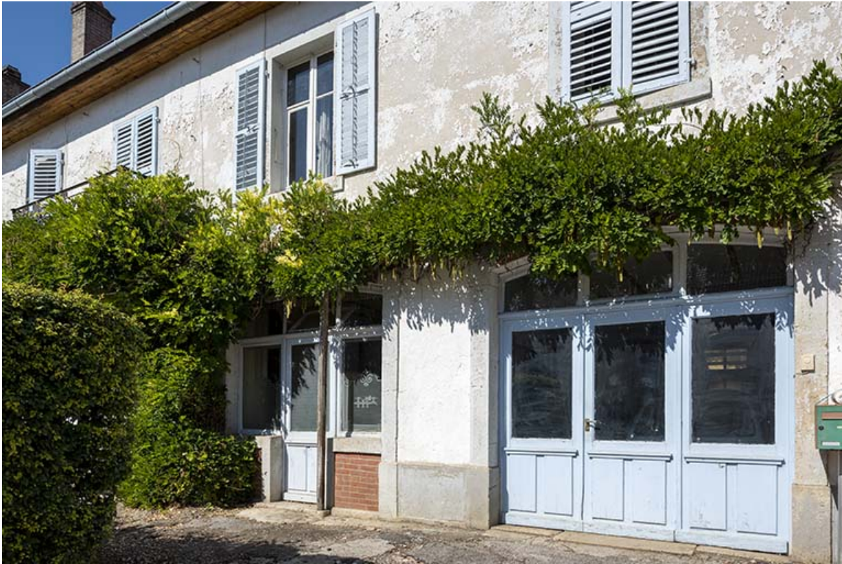
Bâtiment au 8 Grande Rue : portes du magasin.