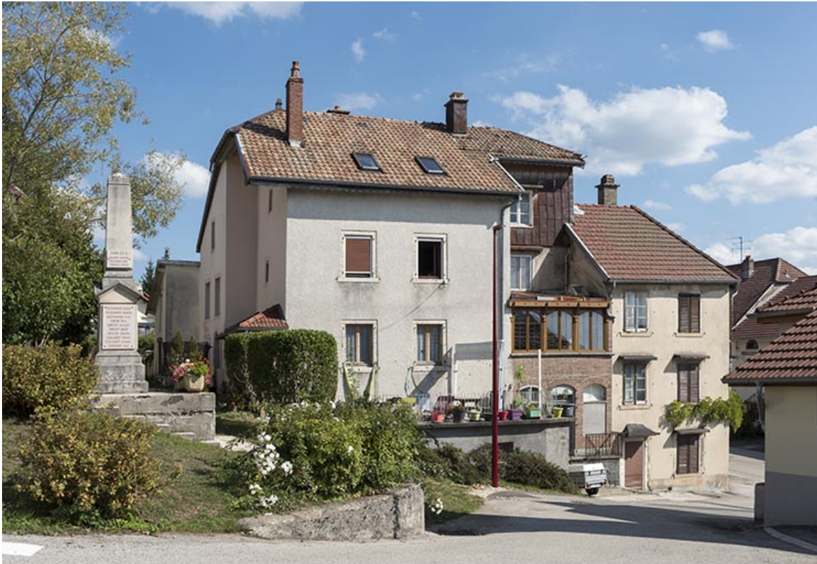
Comptoir d'outillage Hugoniot-Tissot, 2 rue du Chêne. 25, Montécheroux