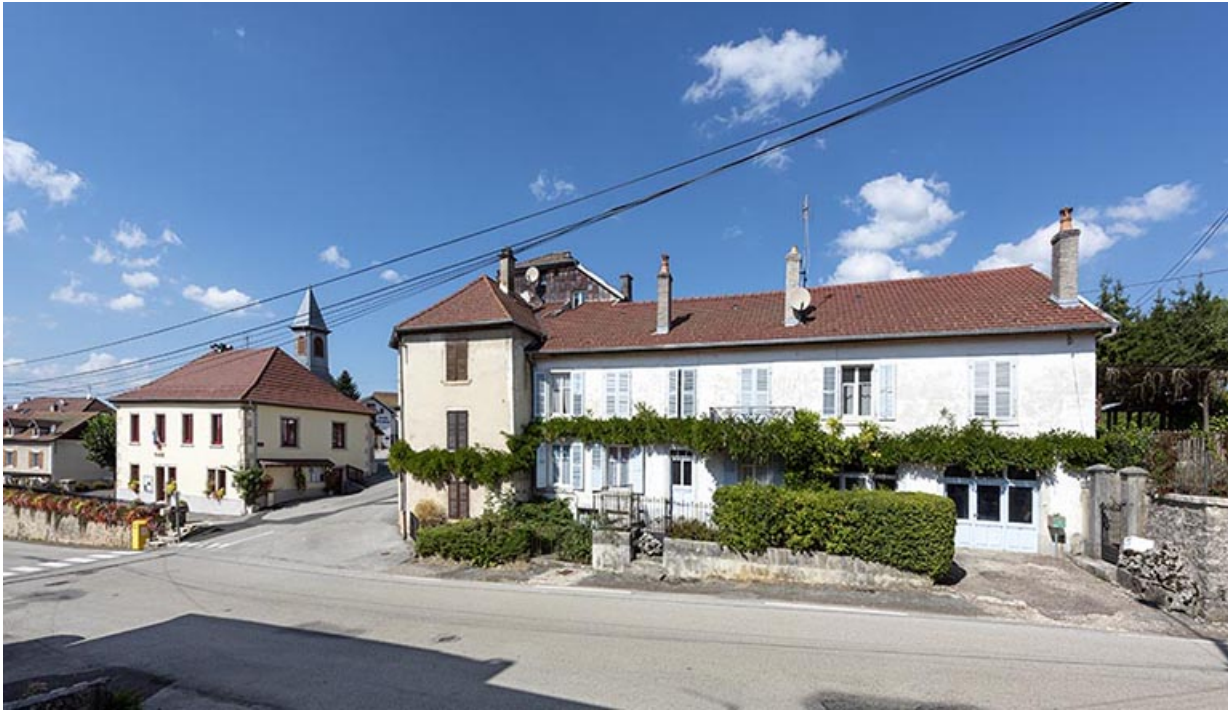
Vue d'ensemble sur la Grande Rue.