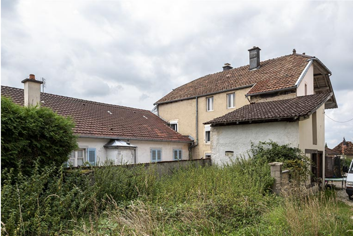
Bâtiment au 2 rue du Chêne : façade postérieure.