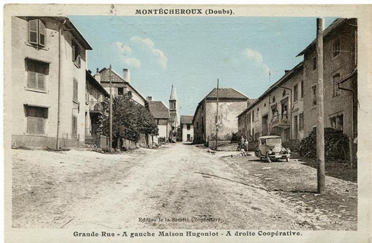
Montécheroux (Doubs). Grande Rue - A gauche Maison Hugoniot - A droite Coopérative, 2e quart 20e siècle [avant 1935]. 25, Montécheroux, 8-10 Grande Rue

Montécheroux (Doubs). Grande Rue - A gauche Maison Hugoniot - A droite Coopérative, carte postale colorisée, s.n., 2e quart 20e siècle [avant 1935], Ed. de la Société coopérative. Porte la date 30 août 1935 (tampon) au verso. Lieu de conservation : Collection particulière