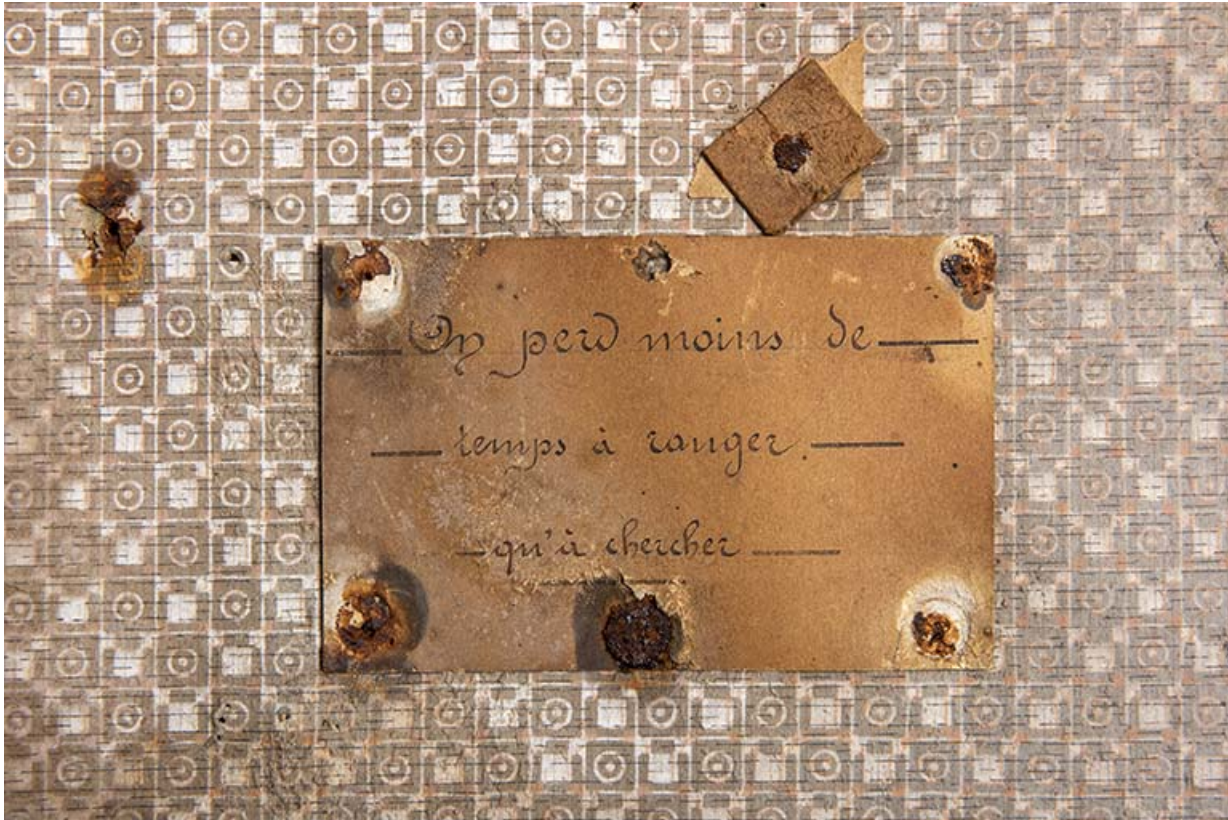
Bâtiment au 2 rue du Chêne, étage de soubassement (magasin industriel) : affichette. 25, Montécheroux, 8-10 Grande Rue