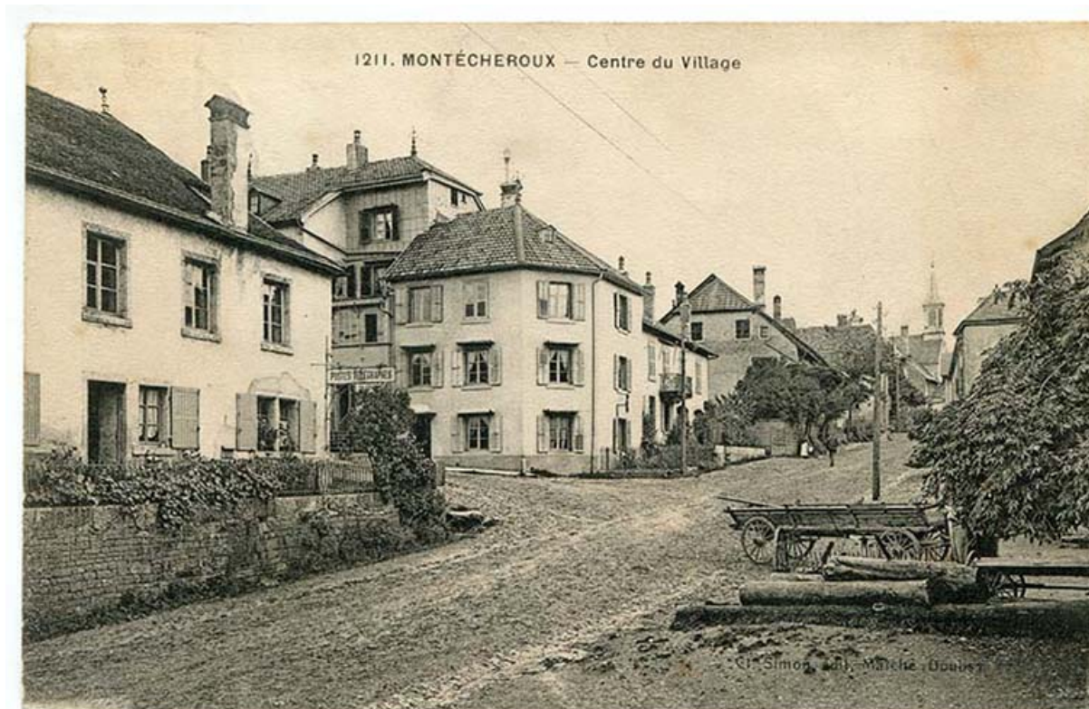
1211. Montécheroux - Centre du village, 1er quart 20e siècle [avant 1921].