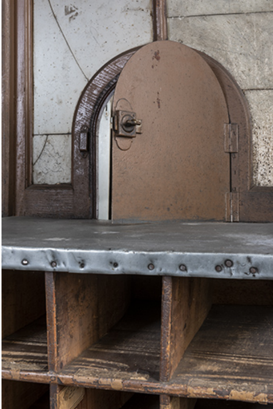
Bâtiment au 2 rue du Chêne, étage de soubassement (magasin industriel) : guichet pour la paie des artisans (détail). 25, Montécheroux, 8-10 Grande Rue