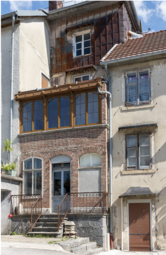
Magasin industriel rue du Chêne.