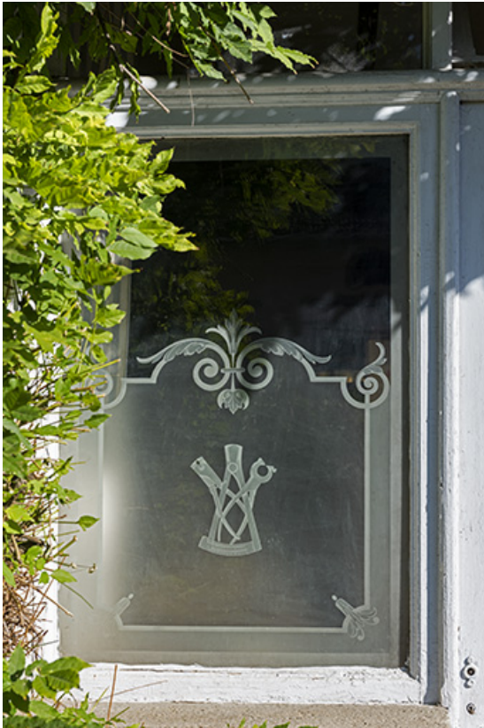
Bâtiment au 8 Grande Rue : fenêtre ornée d'un dessin de pinces gravé sur le verre. 25, Montécheroux