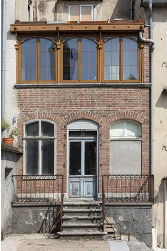
Magasin industriel rue du Chêne, de face. 25, Montécheroux, 8-10 Grande Rue