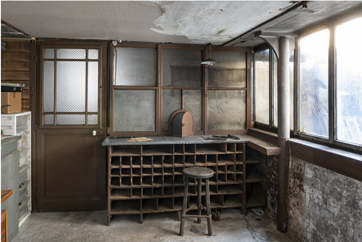
Bâtiment au 2 rue du Chêne, étage de soubassement (magasin industriel) : guichet pour la paie des artisans. 25, Montécheroux