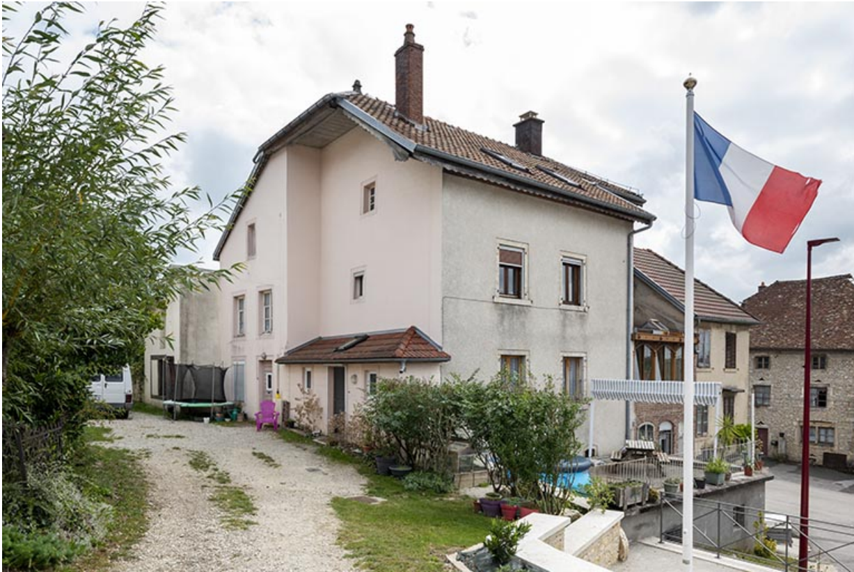
Bâtiment au 2 rue du Chêne, de trois quarts gauche.