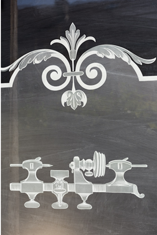
Bâtiment au 8 Grande Rue : tour d'horloger gravé sur verre.