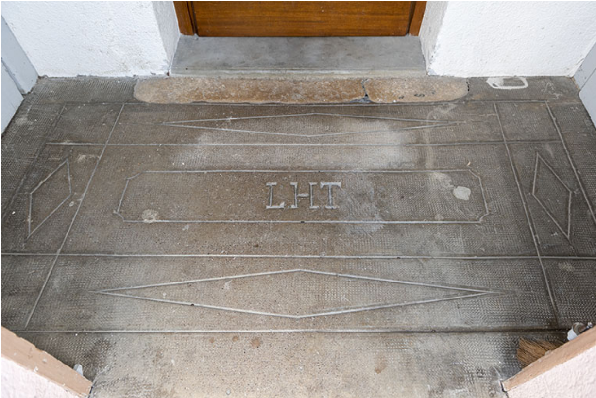
Bâtiment au 2 rue du Chêne : initiales de Lucien Hugoniot-Tissot sur le sol de l'entrée. 25, Montécheroux, 8-10 Grande Rue