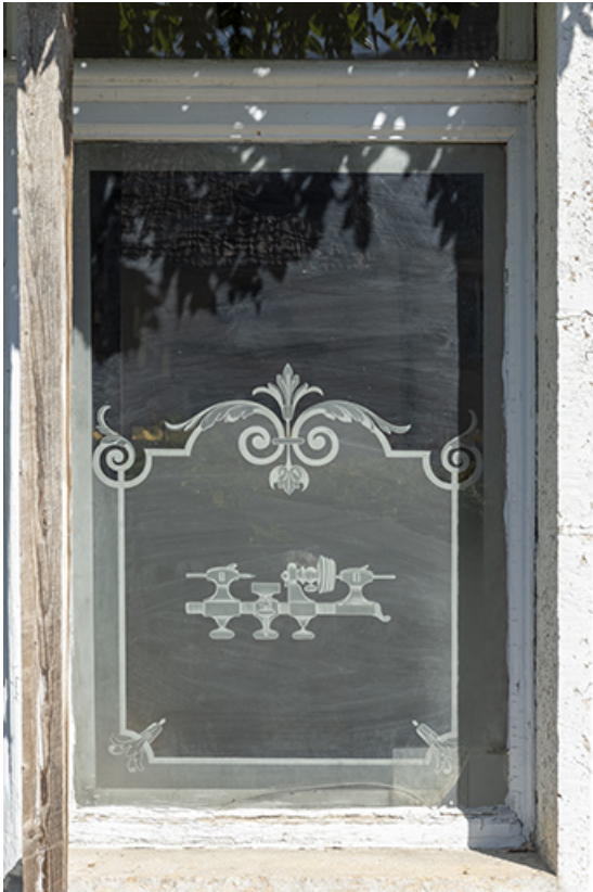
Bâtiment au 8 Grande Rue : fenêtre ornée d'un dessin de tour d'horloger gravé sur le verre. 25, Montécheroux