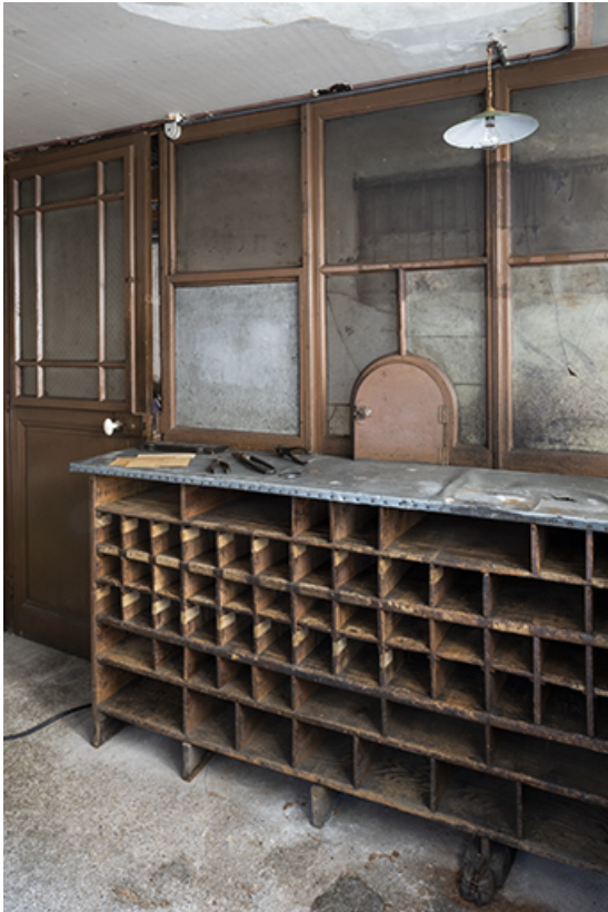
Bâtiment au 2 rue du Chêne, étage de soubassement (magasin industriel) : guichet pour la paie des artisans, de trois quarts. 25, Montécheroux, 8-10 Grande Rue