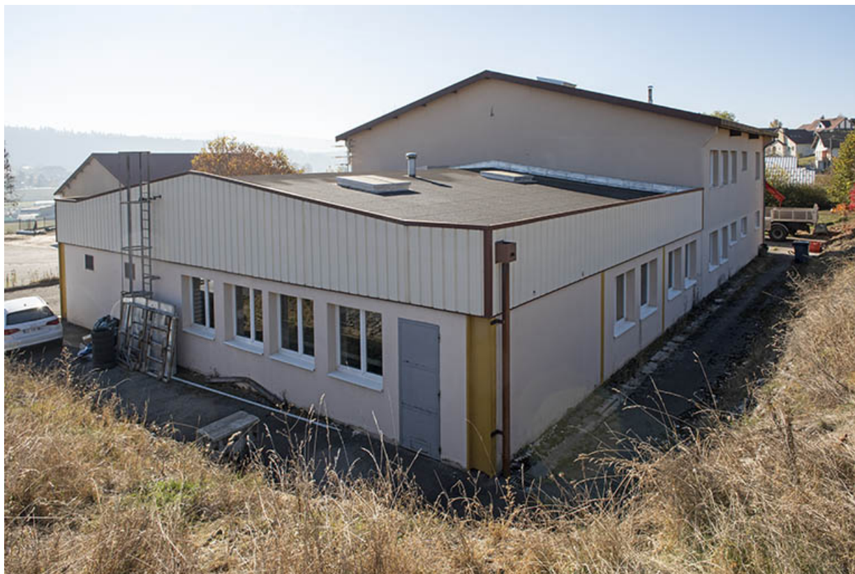
Vue plongeante, depuis le nord.