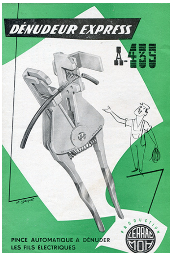
Fiches de présentation des outils Lerrac - MOH, 3e quart 20e siècle. 25, Les Fins, 25 rue des Prés Mouchets