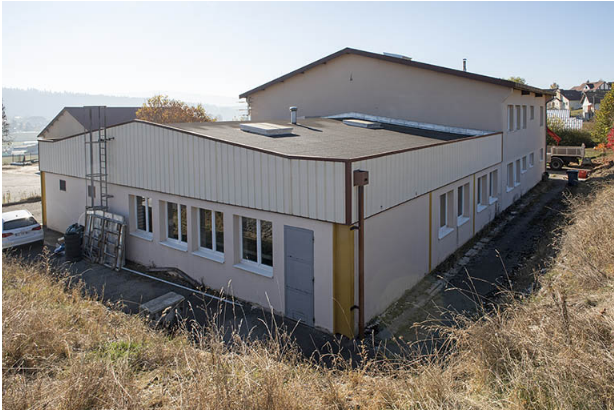
Vue plongeante, depuis le nord.