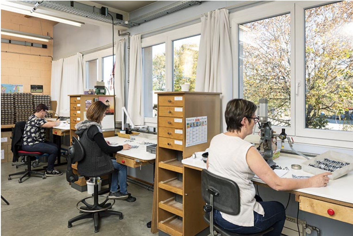
Atelier de fabrication sud : assemblage des tournevis.