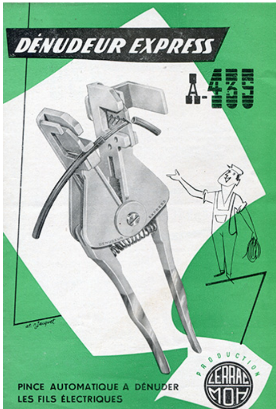
Fiches de présentation des outils Lerrac - MOH, 3e quart 20e siècle. 25, Les Fins, 25 rue des Prés Mouchets