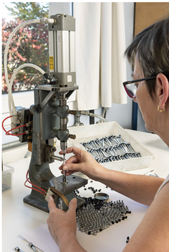
Atelier de fabrication sud : ouvrière assemblant un tournevis.