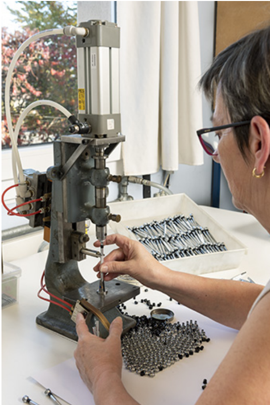
Atelier de fabrication sud : ouvrière assemblant un tournevis.