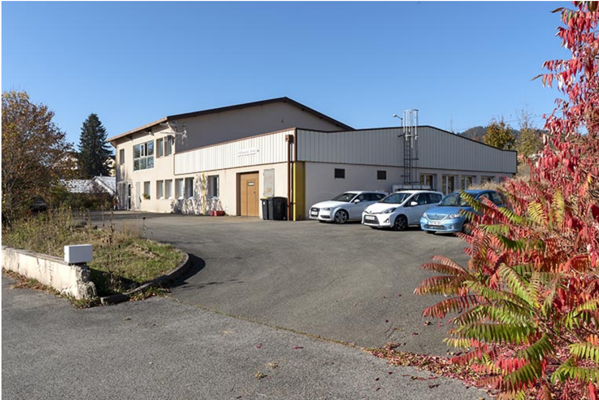
Vue d'ensemble, depuis le nord-est.