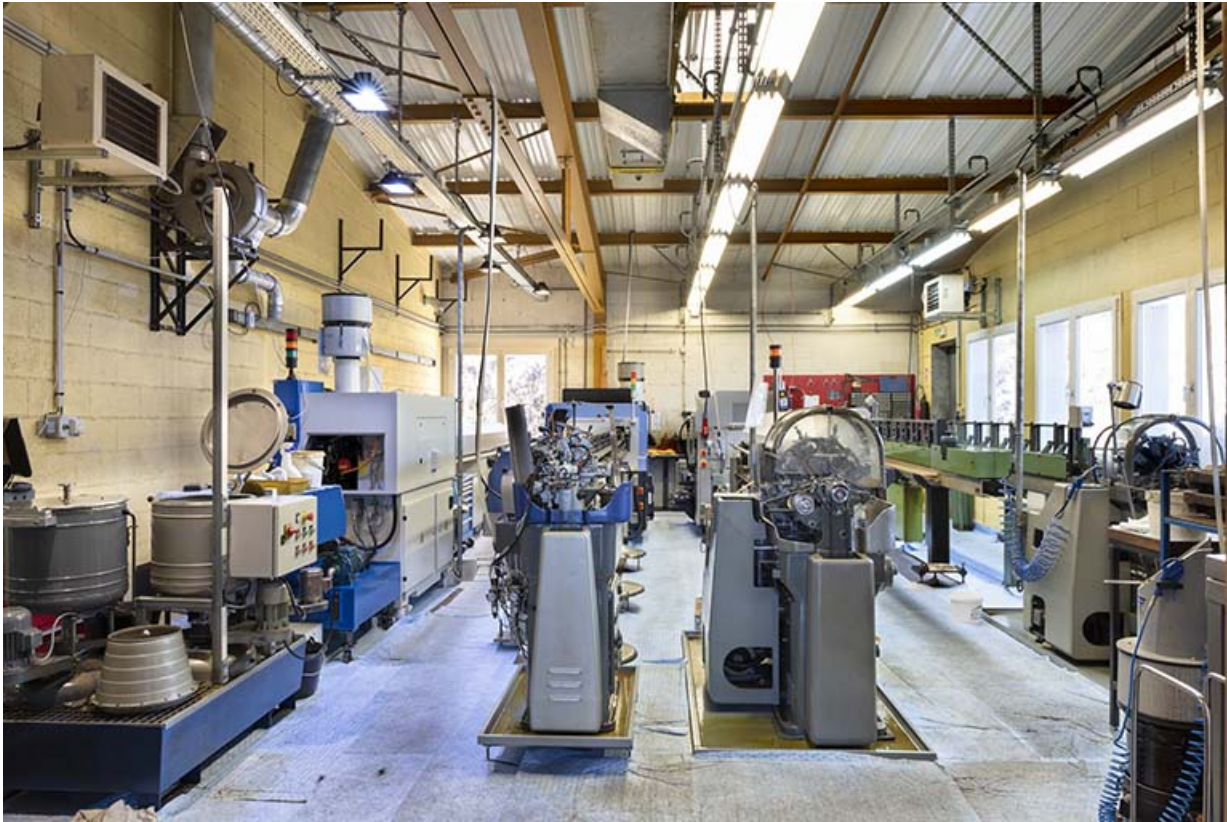
Atelier de fabrication nord : intérieur.